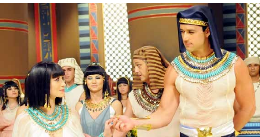
A novela "Os Dez Mandamentos", da Record, foi o 17º programa mais visto da TV aberta no mês passado

Goiânia (GO), Vitória (ES) e até mesmo em confrontos com "Babilônia" (Globo), no Recife. Em São Paulo, desde março, elevou a audiência da emissora em 75%.