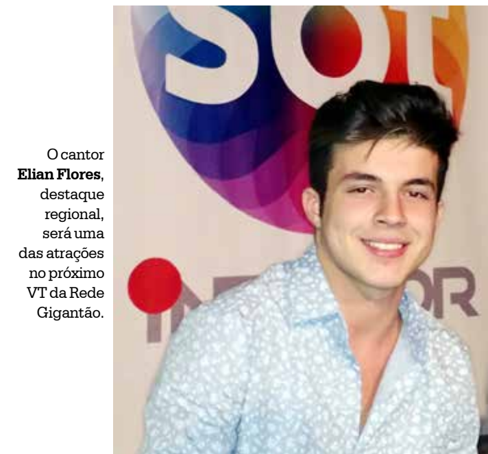
O cantor Elian Flores , destaque regional, será uma das atrações no próximo VT da Rede Gigantão.