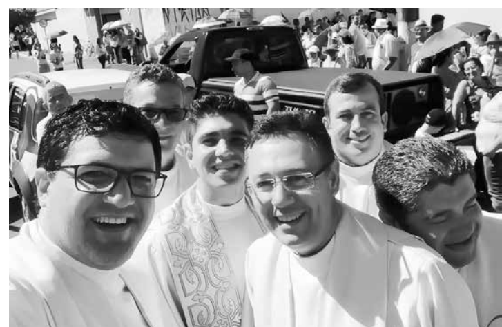
Em destaque, padres da Diocese participando no último domingo da Romaria, em Jales.