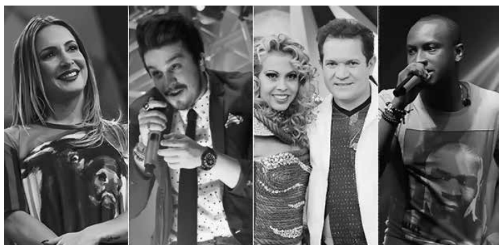
Claudia Leitte, Luan Santana, Calypso e Thiaguinhos estão entre os vetados