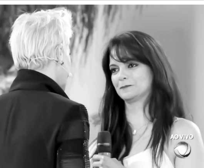
Xuxa se desculpou com Érica por sua atitude na época