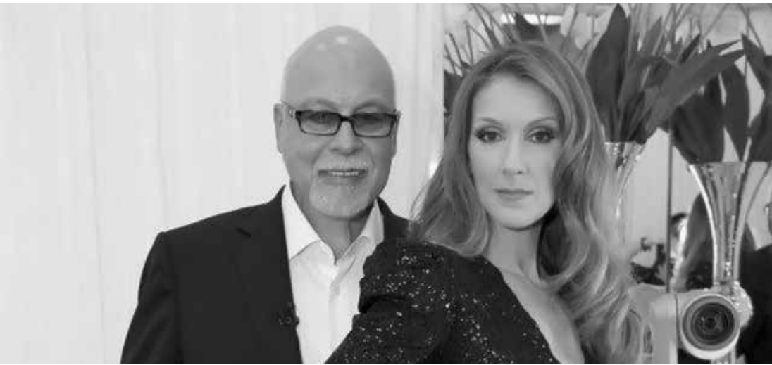
Celine Dion e o marido René Angélil: ele luta contra um câncer de garganta

Celine Dion, de 47 anos, contou que o marido René Angélil, de 73 anos, que está lutando contra um câncer na garganta, quer “morrer em seus braços”. A cantora falou sobre a doença do marido para o “USA Today”, e afirmou que voltará a se apresentar em Las Vegas, nos Estados Unidos, para atender a um pedido dele. A cantora tinha ficado lon-