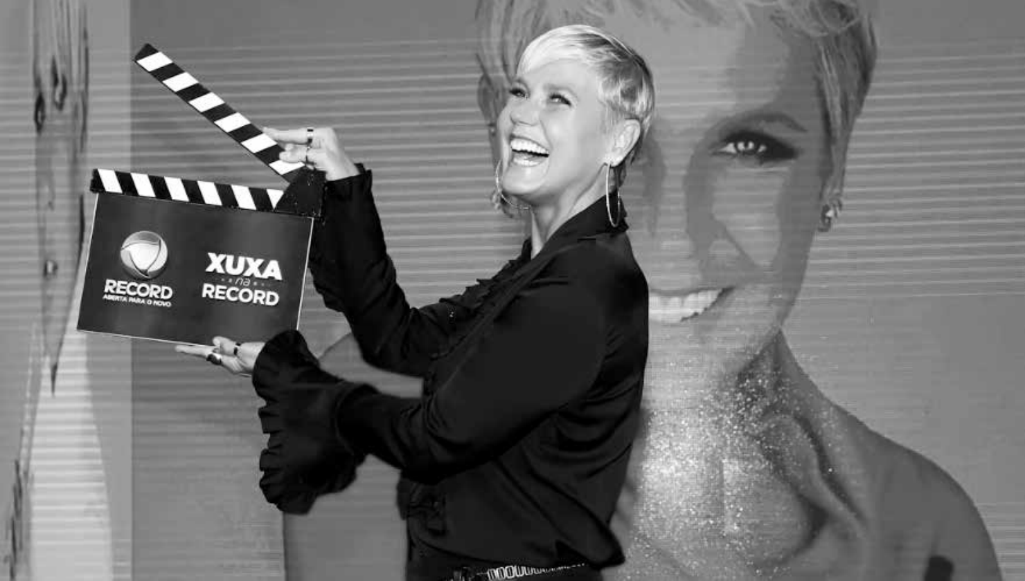
Depois de estreiar com 10,1 pontos de média em São Paulo, na semana passada, o programa rendeu média em torno de 7,3 pontos

quero viver longe de Joelma, a única mulher que amo verdadeiramente nessa vida”. Se Chimbinha diz estar sofrendo, Joelma tem um discurso diferente. “Para quem pensa que estou triste, estou muito feliz solteira”, escreveu ela para os fãs.