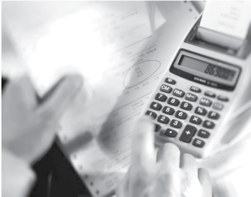
O contrato de Depósito Interfinanceiro (DI) com vencimento em janeiro de 2016 fechou em 14,21%, contra 14,245% do ajuste de ontem

A melhora da percepção mundial sobre a China nesta quinta-feira (27), foi determinante para um dia mais ameno e o mercado futuro de juros ajustou as taxas para baixo. A queda acompanhou principalmente a tendência do dólar, que recuou 1,11%, após quatro altas consecutivas. Pela manhã, o Banco do Povo da China (PBoC) anunciou que vai usar swaps cambiais para abrandar as crescentes expectativas de recuo do yuan e o governo do país flexibilizou as regras sobre investimentos em imóveis por empresas e indivíduos estrangeiros, como parte dos esforços para estimular o enfraquecido mercado imobiliário local e dar suporte à economia. Ontem, o BC chinês já havia injetado US$ 21,8 bilhões no sistema financeiro local. Na terça-feira, a instituição cortou a taxa de juros e o compulsório dos bancos. Assim, as bolsas da China finalmente se recuperaram de cinco pregões de baixa. A bolsa de Xangai fechou em alta de 5,34% e impulsionou as negociações ao redor do planeta. Os preços das commodities subiram significativamente, com destaque para o petróleo Brent para outubro, que fechou em alta de 9,50%, maior porcentual diário desde março de 2009. Nos EUA, o alívio vindo da China foi reforçado