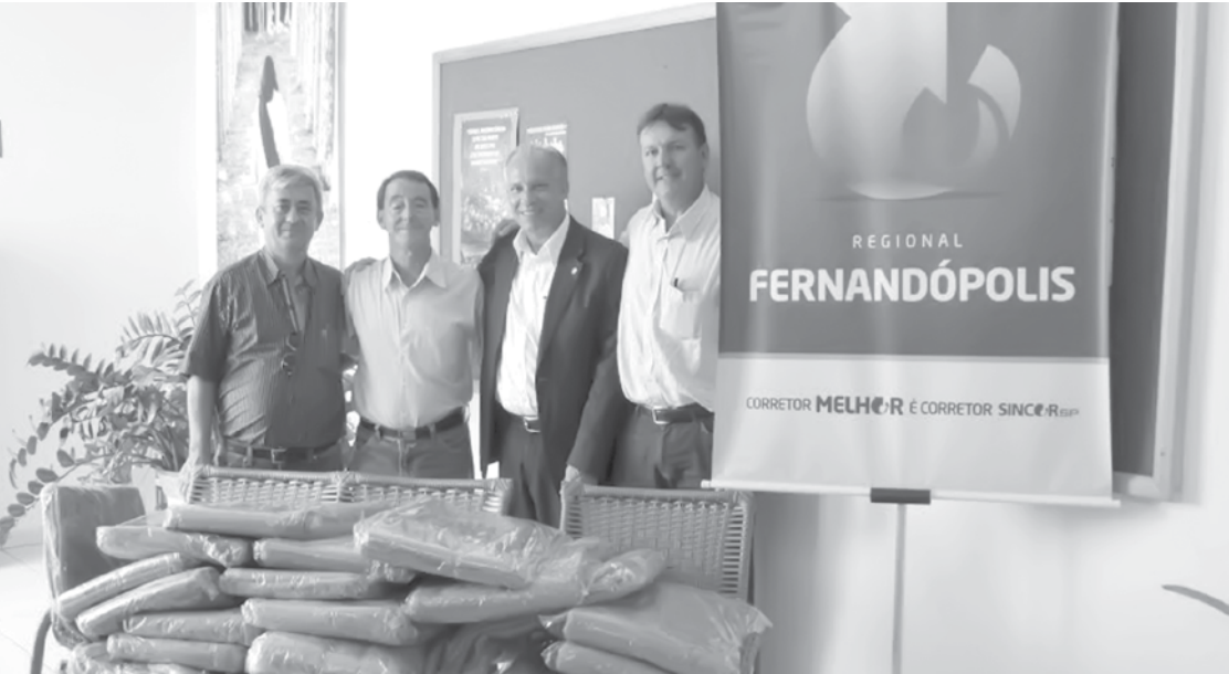
Representantes do SINCOR e da Promoção Humana durante a entrega dos cobertores