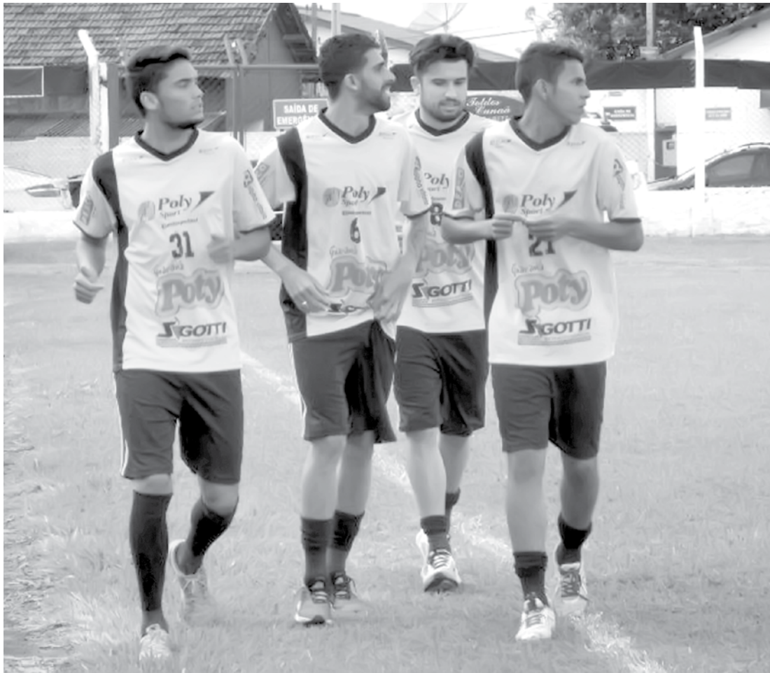
Jogadores do Fefecê durante treinamento no municipal Claudio Rodante