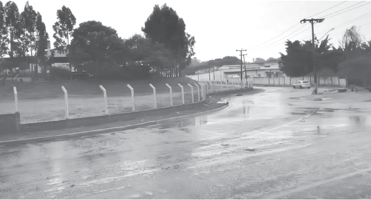
Quinta-feira foi marcada por chuva fina e fim da poeira