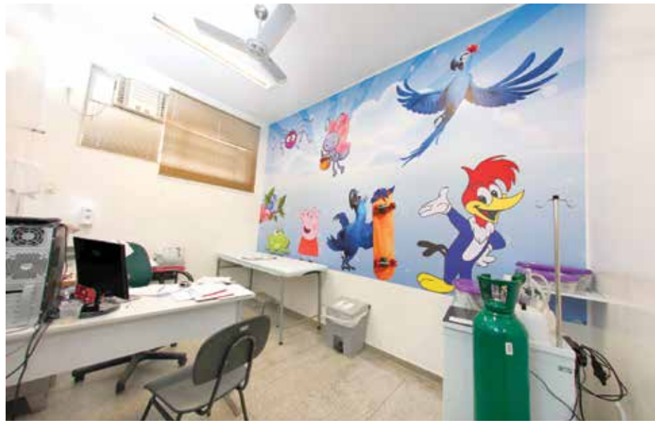
Consultório Pediátrico da UBS I que também ganhou um colorido especial para garantir o bem-estar das crianças

atenção básica. "Estou muito satisfeito e só tenho que parabenizar toda a equipe pelos resultados obtidos. O conceito mostra mais uma vez a preocupação do governo em manter um nível de excelência em saúde. Nossa preocupação é oferecer ao município uma assistência que garante cada vez mais qualidade aos serviços prestados à população", comenta.