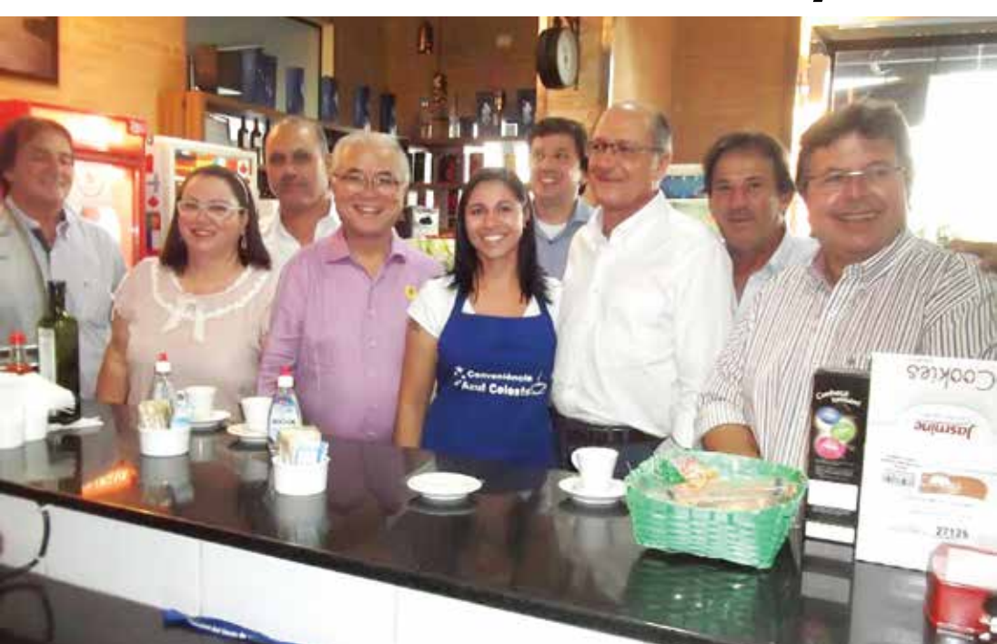
Na loja de conveniência: o vice-prefeito Zezinho Assumpção; 1ª dama Dona Rosinha, vereador Kim, prefeito Pedro Itiro, funcionária da Loja de Conveniência do Posto Azul Celeste, Eliane; secretário do Desenvolvimento e da Assistência Social, Flávio Pesaro; governador Geraldo Alckmin; vereador Baroninho e deputado Estadual Carlião Pignatari