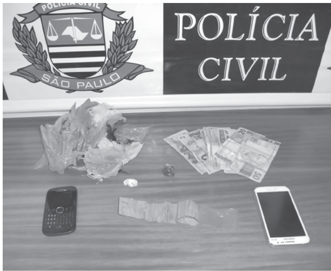
Dinheiro, retalhos plásticos, aparelhos celulares e entorpecentes apreendidos pela Polícia

Levado à sede da DISE, o acusado foi autuado em flagrante por tráfico de drogas, crime que prevê de 5 a 15 anos de prisão, em caso de condenação. O rapaz foi recolhido à cadeia de Guarani d'Oeste, na qual permanece à disposição da Justiça. A sua mulher, que estava na residência no momento da chegada da Polícia, foi liberada na delegacia por não ter ficado bem clara a sua participação na atividade ilegal.