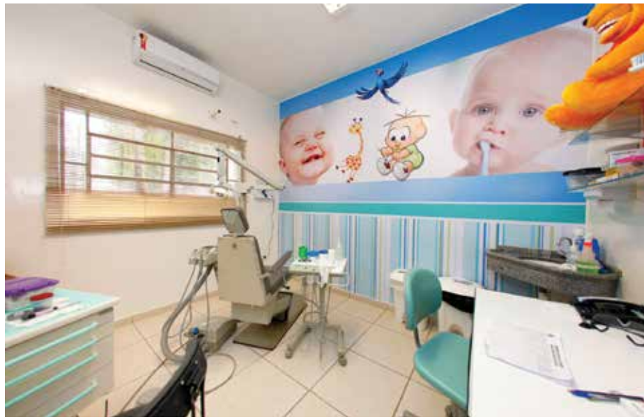
Consultório odontológico da UBS I que recentemente teve o ambiente personalizado