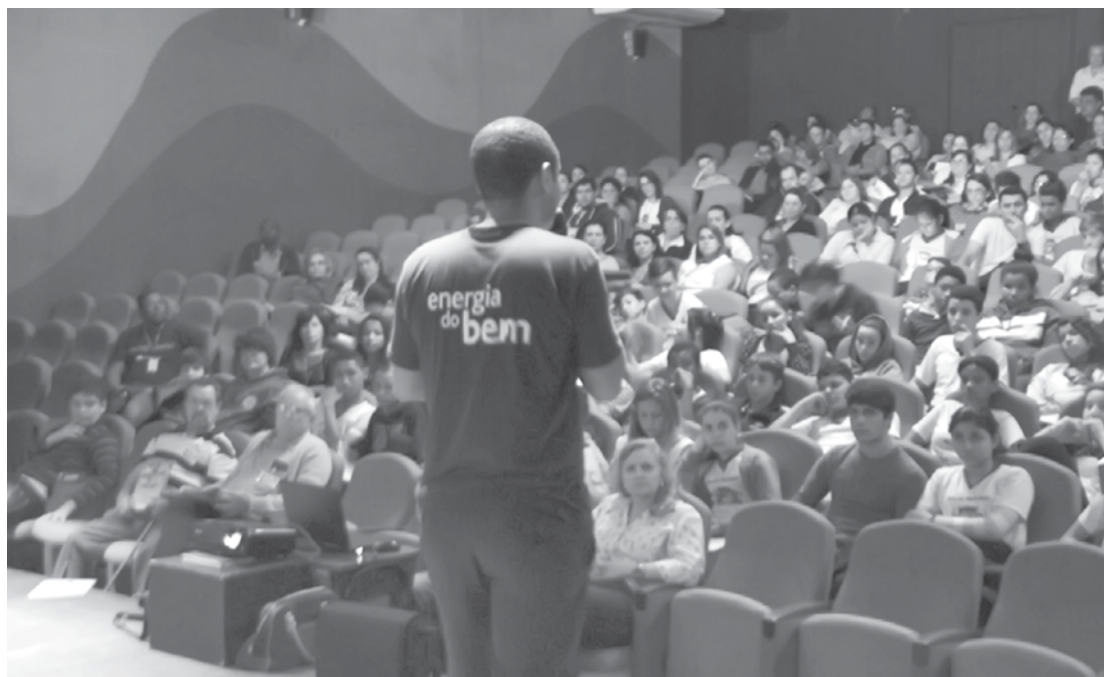
Palestra realizada no Teatro Municipal na manhã de ontem

sa, eólica, etc., e explicaram o caminho que a energia elétrica faz até as residências ou trabalho. Os participantes receberam material com informações sobre o consumo dos aparelhos em casa e no trabalho, com dicas citadas durante a palestra sobre economia de energia elétrica. Para mais informações sobre a campanha, acesse o site www.aesbrasilsustentabilidade.com.br