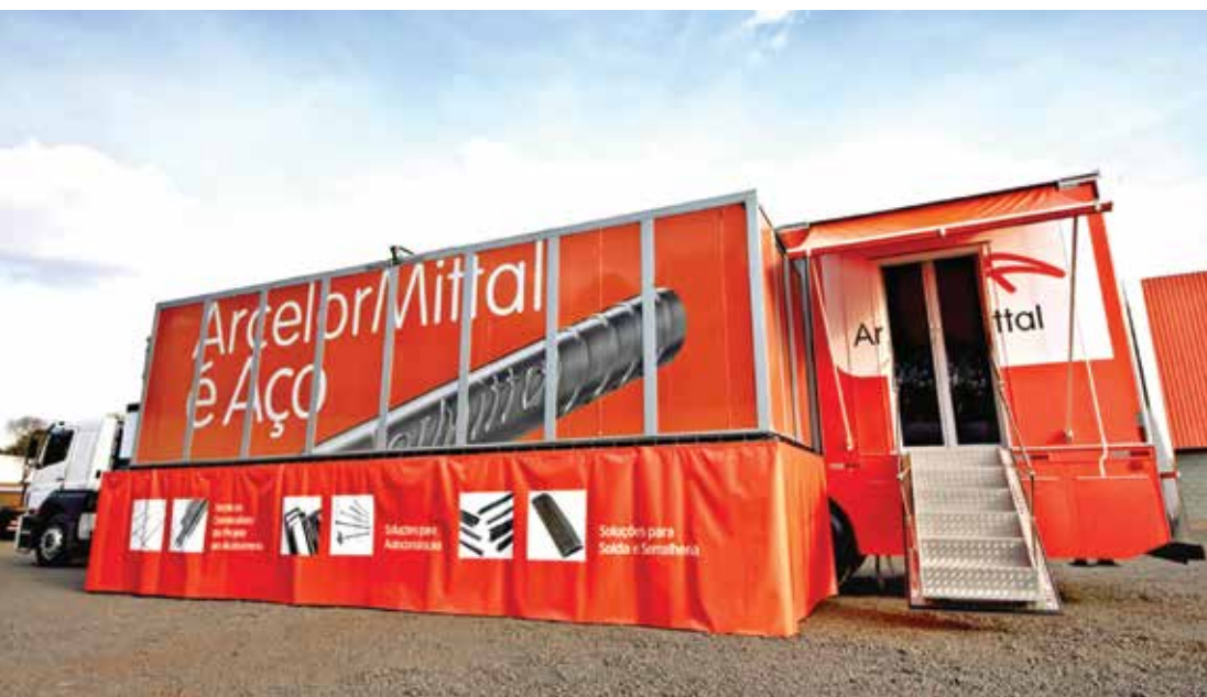
Caminhão-escola que oferecerá treinamentos na área da construção civil em Fernandópolis

Programa “Mestre ArcelorMittal” será realizado na cidade em setembro