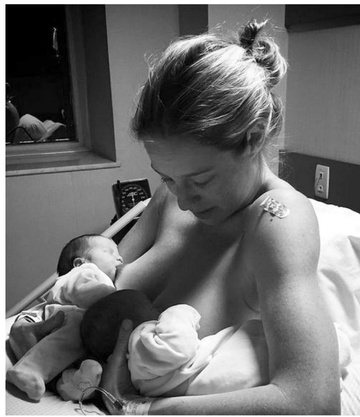
Bem e Liz nasceram em plena madrugada no Rio de Janeiro

PEIXES Um clima de bom entendimento nas relações familiares é promovido pelo trígono estabelecido entre Lua e Mercúrio. As demandas em comum promovem sinergia e diálogo. Diante dos conflitos, atue de maneira emocionalmente confortável!