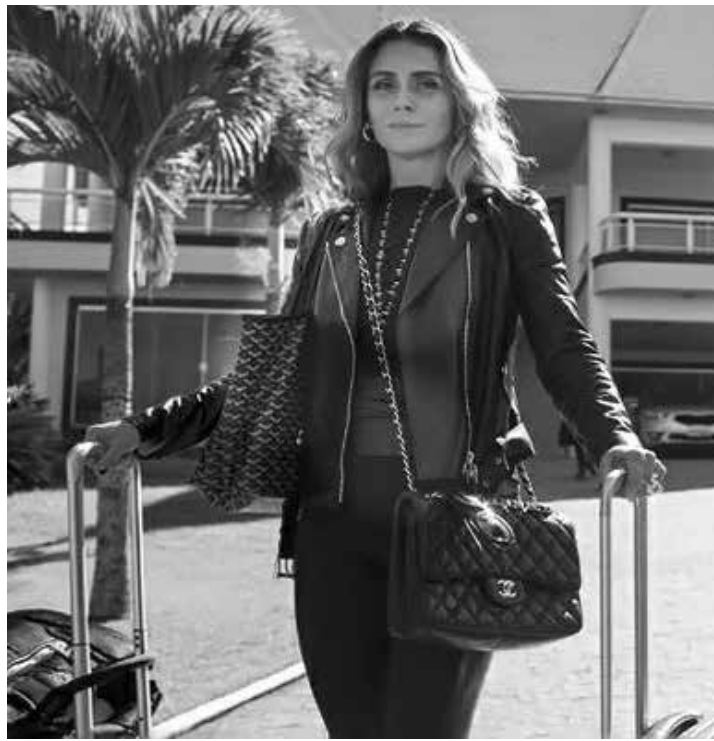
Em destaque, Giovanna Antonelli, encarando a vilã Atena, que ditará a regra do jogo

No final da apresentação, o casal, que vai voltar a atuar junto em uma série da Globo, trocou beijos e abraços e posou para fotos.