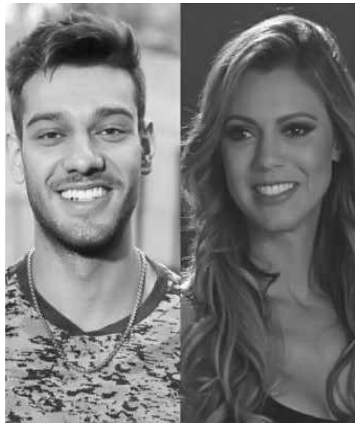
Cantores foram vistos juntos na semana passada, diz jornal