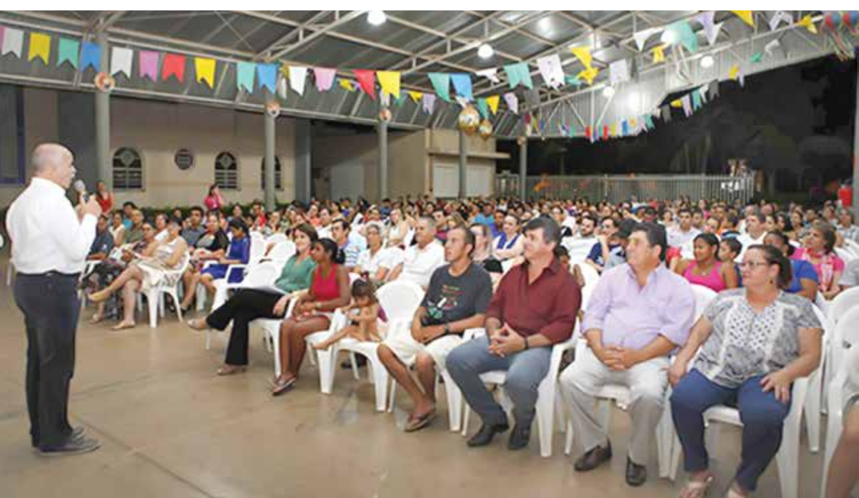
Salão Paroquial foi tomado pela participação dos pais durante a palestra