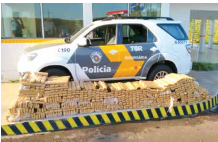
Registros da abordagem ao caminhão, do “pente-fino” na carga de milho e da maconha localizada e apreendida pela Polícia Militar Rodoviária