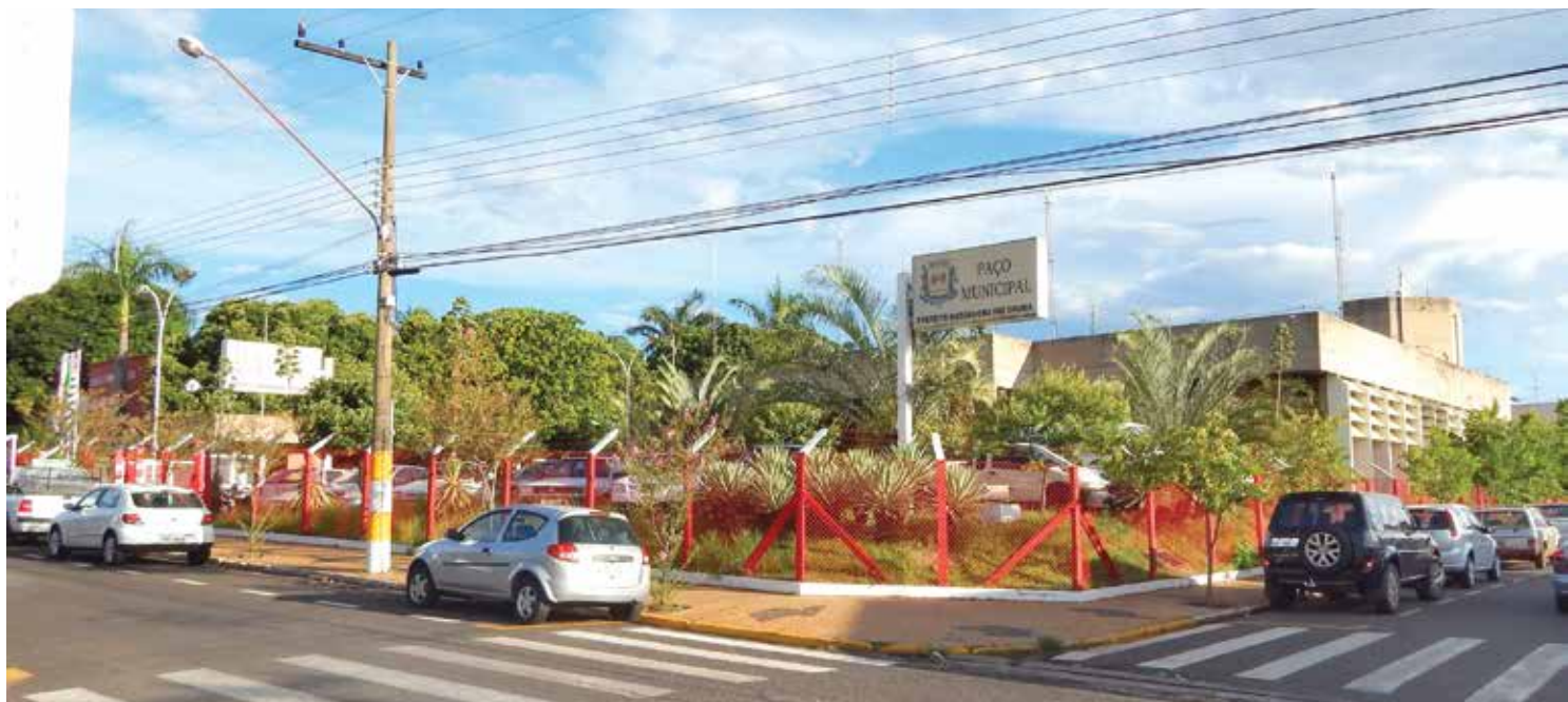
Prefeitura de Fernandópolis garante que até o final da próxima semana todos os salários dos servidores serão quitados

no máximo no dia 12 de setembro". Estas informações foram publicadas ontem (04), na página do Sindicato dos Servidores Municipais de Fernandópolis no Facebook. Em contato com a Assessoria de Imprensa da Prefeitura, o critério adotado neste mês de setembro, para o pagamento dos salários do funcionalismo público referente ao mês de agosto, foi confirmado. As dificuldades financeiras neste segundo semestre do ano recaem principalmente na queda de receita, principalmente no baixo repasse de recursos dos governos federal e estadual.