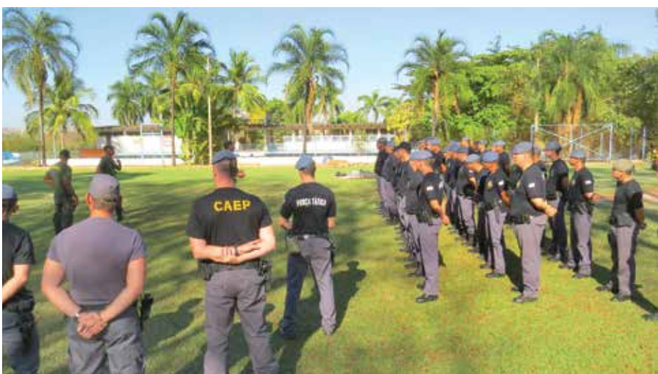
Treinamento visou o nivelamento dos padrões de segurança oferecidos à sociedade