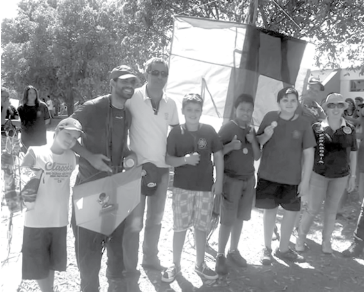
Campeonato de Pipas 29/08 – Beira-Rio