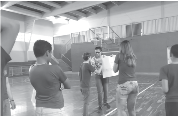
Gincana Esportiva Cultural – Comemoração Dia do Estudante 11/08