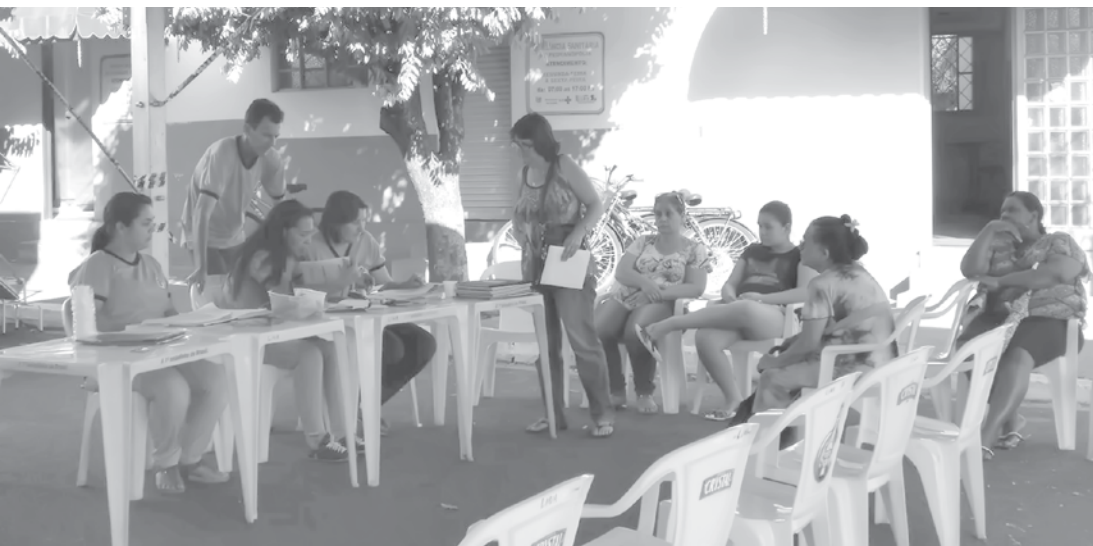
203 mamografias foram realizadas com a presença da Carreta do Hospital de Câncer em Pedranópolis