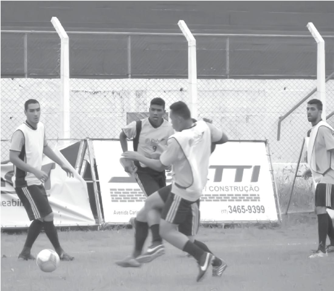
Treinamento do Fefecê durante a semana no estádio municipal Claudio Rodante