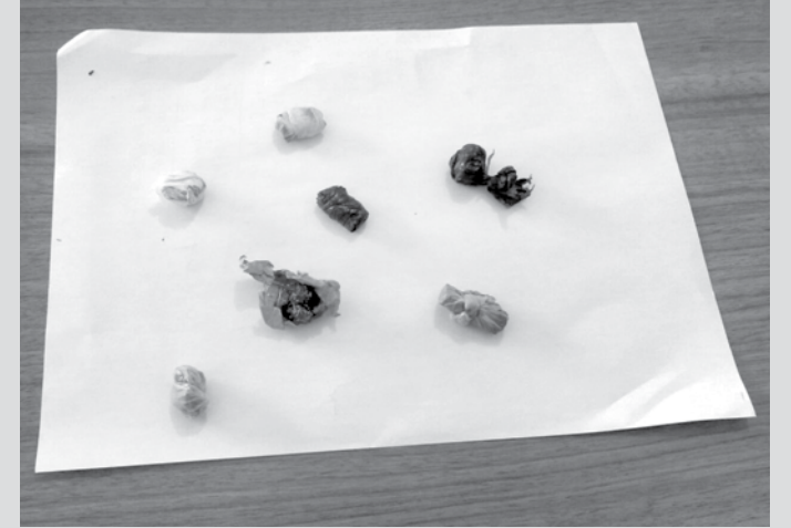
A Polícia Militar encontrou 05 porções de maconha com o garoto, além de outras duas jogadas no chão

Policiais militares de Ouroeste apreenderam na última quarta-feira (02), por volta das 13h, defronte à EMEF, no Centro da cidade, o adolescente C.E.F.F.S., de 13 anos de idade, suspeito de tráfico de drogas. A equipe, formada pelo Sarg. Zapparoli e Cb Romeira, realizava o policiamento ostensivo quando visualizou a aglomeração de adolescentes que, ao avistarem a viatura, demonstraram um certo nervosismo. Ao revistar o garoto de 13 anos, os policiais encontraram 05 porções de maconha, além de outras duas jogadas no chão.