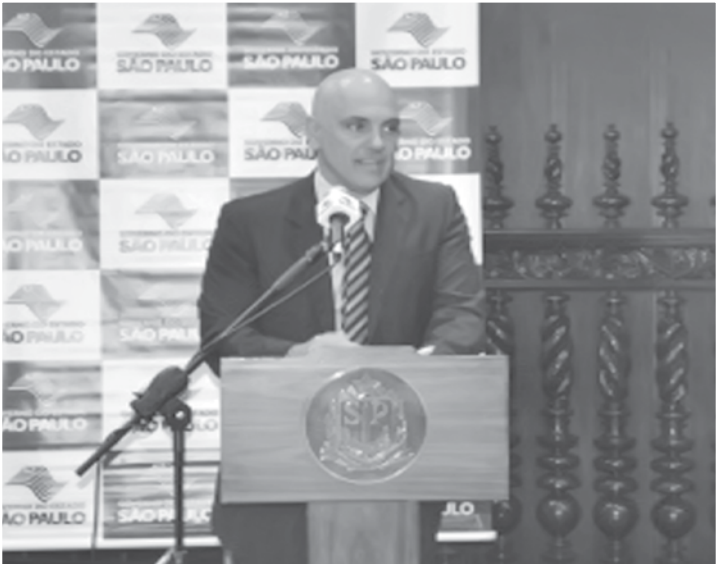
O governador Geraldo Alckmin agradeceu a parceria com as Prefeituras; secretário ressalta a importância dos contratos e convênios

ATIVIDADE DELEGADA A Atividade Delegada chega a mais duas cidades de São Paulo: Ribeirão Bonito e Santa Rita do Passa Quatro. A implantação do programa nos dois municípios terá como objetivo o combate ao funcionamento irregular ou ilegal e das atividades que gerem poluição sonora em regiões críticas. “O policial militar que já está no seu município e já conhece o seu município reforça