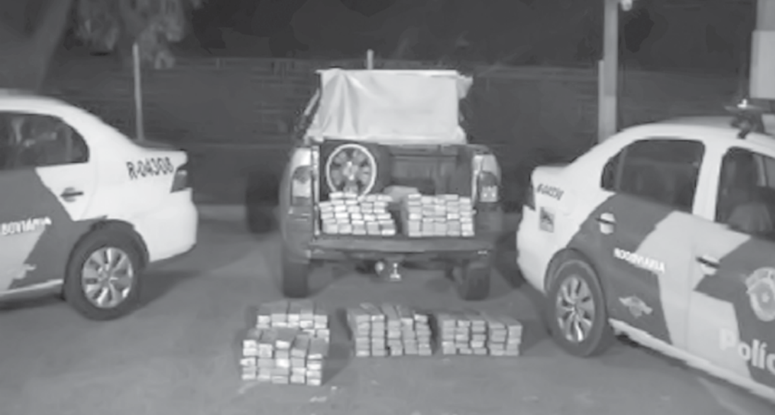
O entorpecente totalizou 149,2 quilos e foi levado para perícia do Instituto de Criminalística

A Polícia Militar apreendeu 168 tijolos de maconha transportados em uma caminhonete, no final da noite desta quarta-feira (02), na altura do km 78 da Rodovia dos Bandeirantes, no município paulista de Itupeva. O motorista do veículo foi preso em flagrante. Durante fiscalização, policiais da 3ª Companhia do 4º Batalhão de Policiamento Rodoviário (BPRv) viram o homem a bordo de um Fiat Strada, de cor prata, parado na cabine de pedágio. O mecânico, de 40 anos, pareceu nervoso assim que notou a presença da equipe. Os PMs deram ordem de parada, momento em que o suspeito fez menção de parar, mas fugiu. A equipe acompanhou o mecânico e conseguiu prendê-lo a cerca de 600 metros do pedágio. Na aborda-