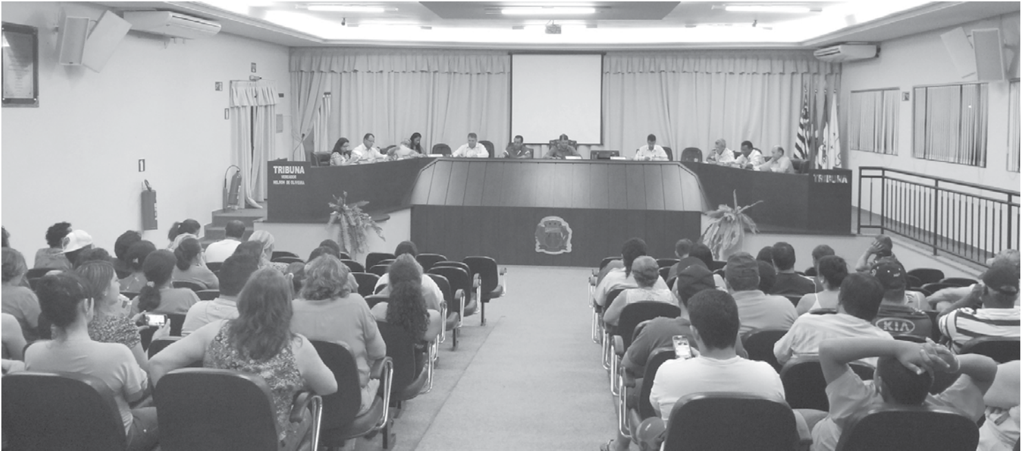
Sessão ordinária realizada nesta semana no Legislativo de Ouroeste