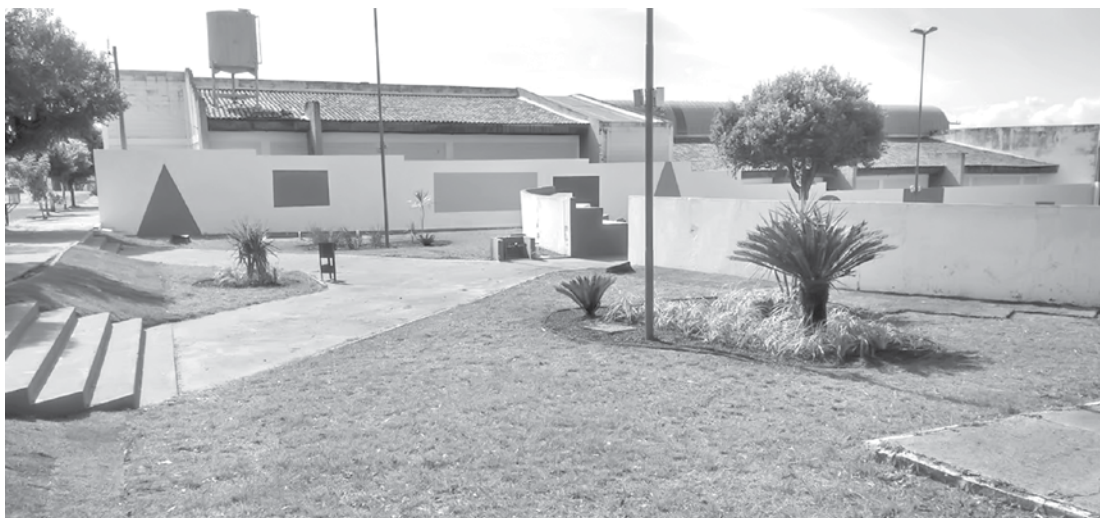
Moradores terão nova opção de lazer e Academia ao Ar Livre