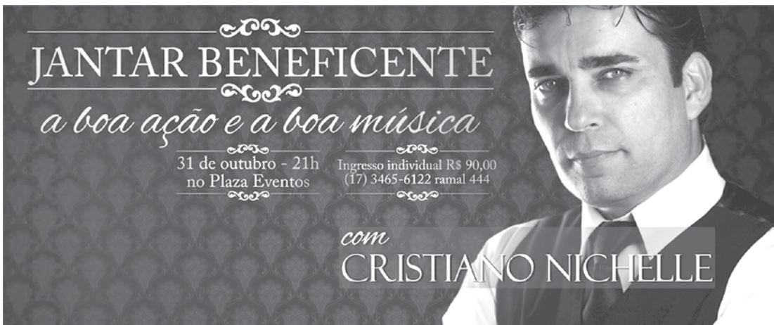
Cantor romântico Cristiano Nichelle será atração da noite