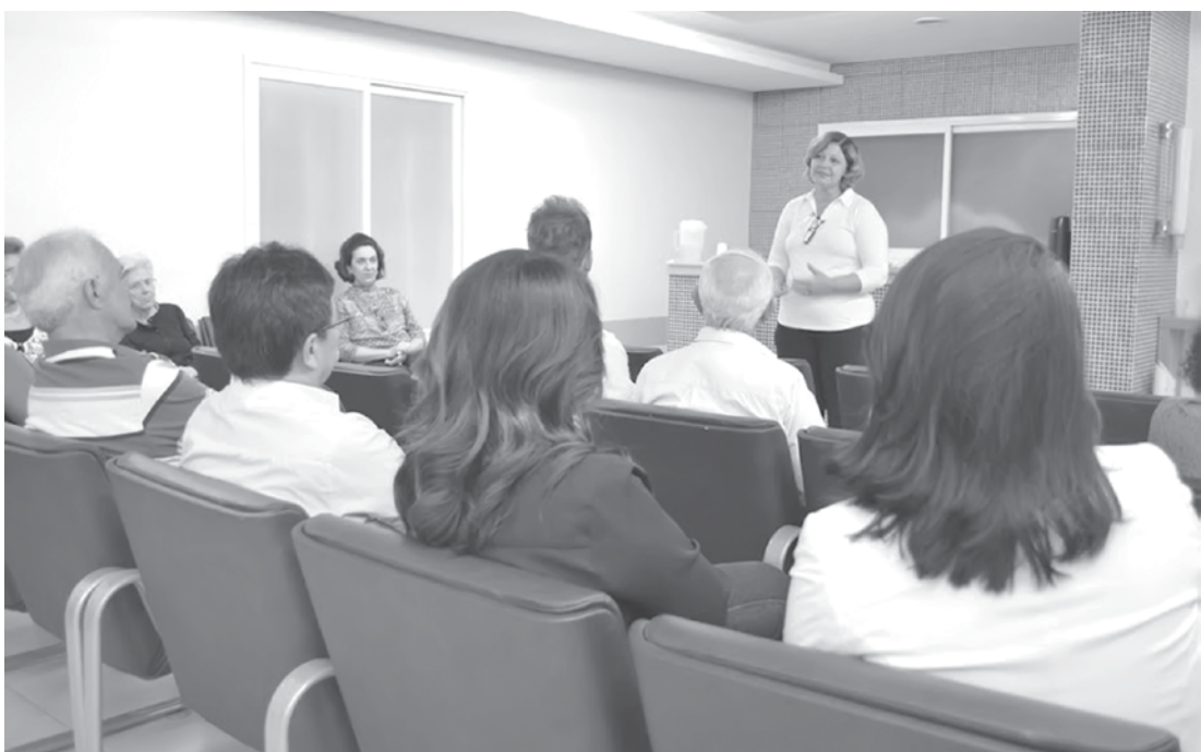
Reunião formalizou lançamento oficial do Jantar

SOLIDARIEDADE O evento surgiu do sentimento de solidariedade de voluntários, que, compreendendo as necessidades da Santa Casa, se comprometeram em participar da organização do evento em conjunto com a equipe de promoção de eventos, formada por colaboradores e membros da irmandade.