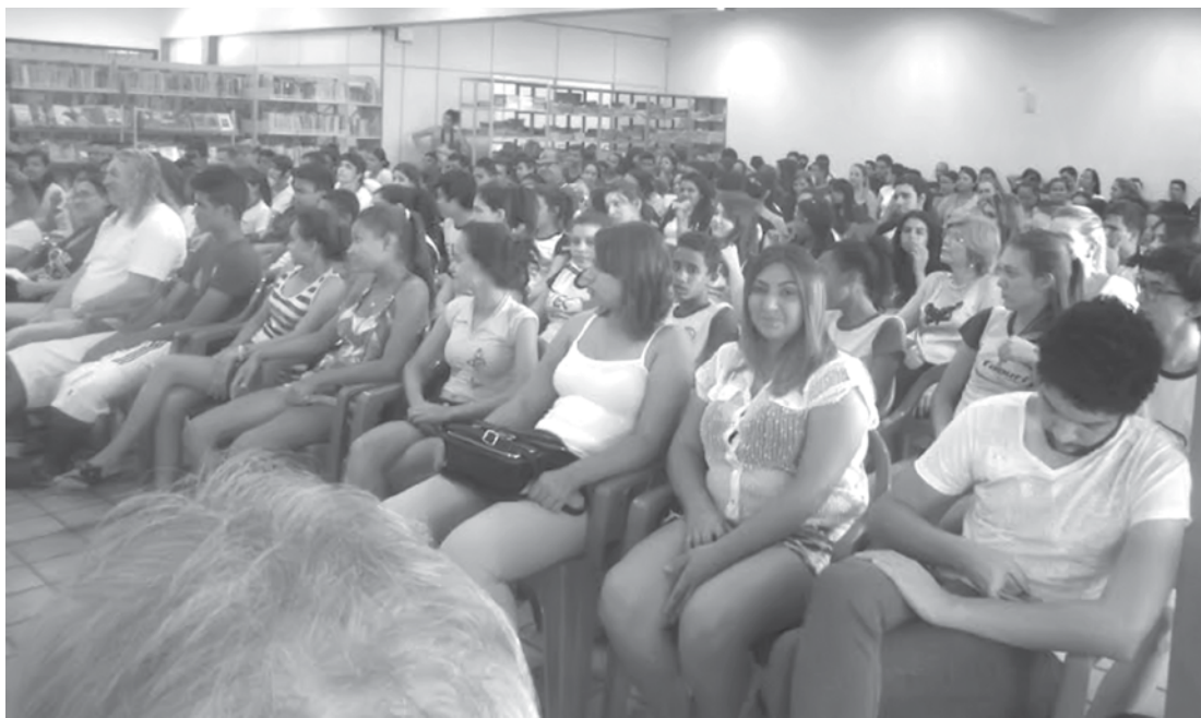
Equipe do Ação Jovem em visita à Biblioteca

É um programa de transferência de renda do Governo do Estado de São Paulo que tem por objetivo promover a inclusão social de jovens de