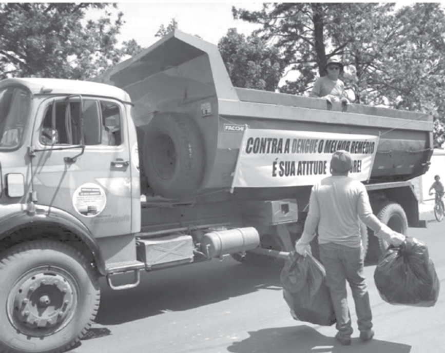
Todos os materiais inservíveis estão sendo recolhidos pelos caminhões

Mais informações na Secretaria Municipal da Saúde no (17) 3465 0566.