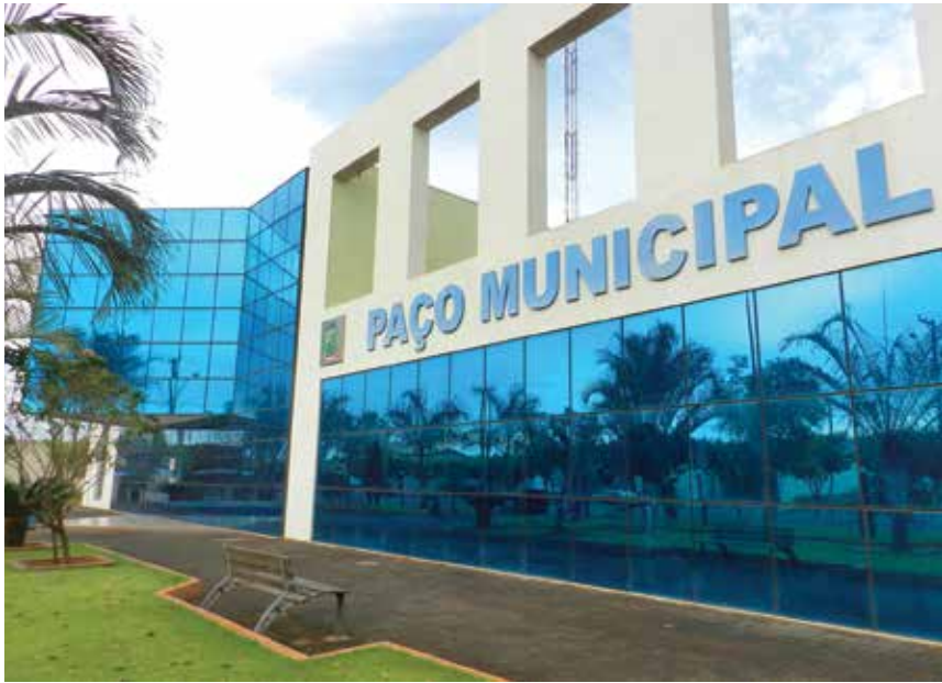
Interessados deverão comparecer ao setor de Tributação do Paço Municipal até o próximo dia 30

→ Da REDAÇÃO contato@oextra.net A Prefeitura de Ouroeste lançou um programa que visa oportunizar aos contribuintes a possibilidade de quitar suas dívidas com o município, concedendo o cancelamento de multas dos débitos tributários e não tributários, inscritos em dívida ativa até o exercício de 2014 ajuizados ou não. A lei concede um desconto de 100% para pagamento a vista e 80% para o pagamento parcelado em até 03 vezes, aderindo ao parcelamento até o dia 30 de setembro. Para obtenção dos benefícios, os interessados deverão comparecer ao setor de Tributação do Paço Municipal. Vale lembrar que o não pagamento de qualquer das parcelas, na data estipulada para o seu vencimento, acarretará a rescisão do Termo de Confissão e Parcelamento de Dívida Concedido. Os contribuintes que não regularizarem seus débitos tributários em atraso com a Prefeitura até essa data, estarão sujeitos a execução fiscal.