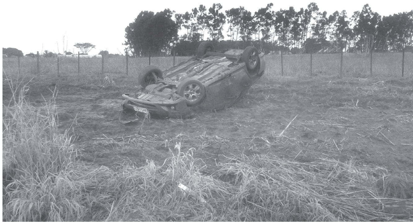
Veículo capotou após aquaplanagem na Percy Waldir Semeghini