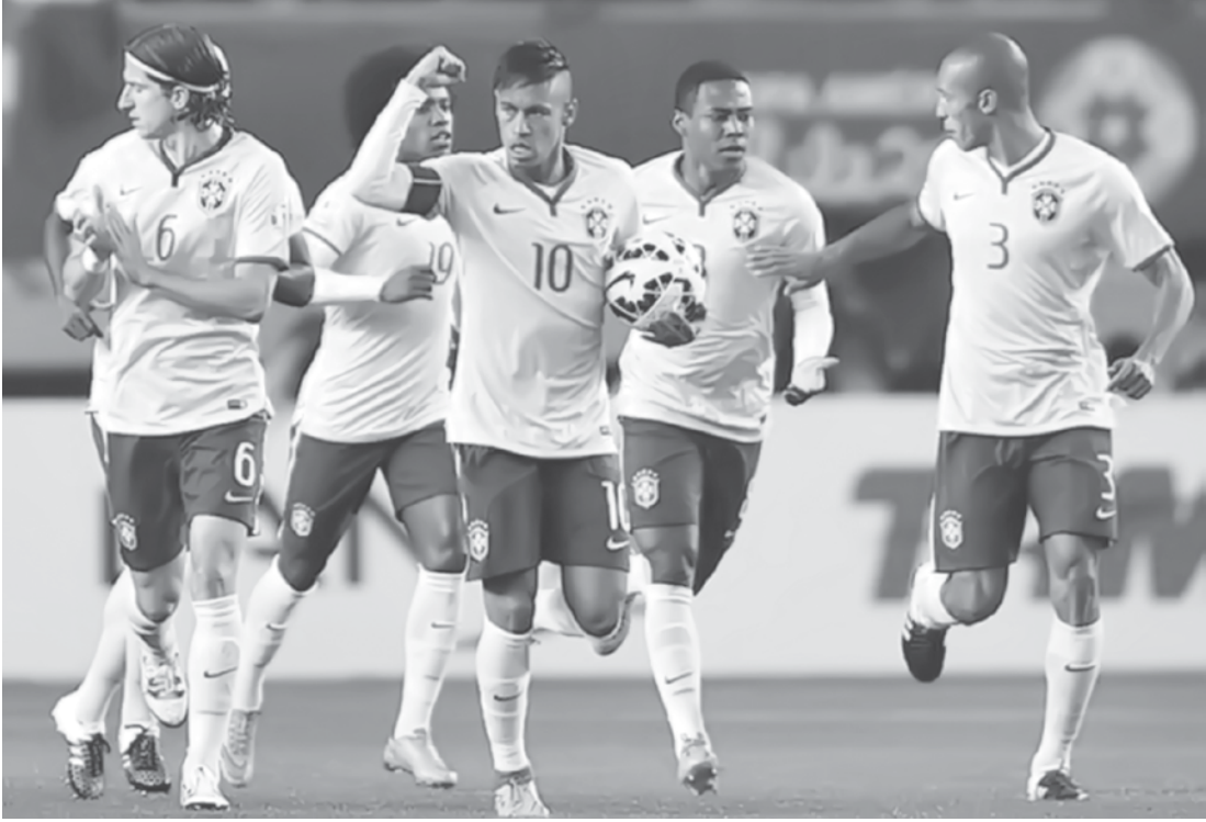
Seleção Brasileira fecha o ano em Salvador, contra o Peru, no dia 17 de novembro

A confederação sul-americana decidiu ainda que todos os jogos da rodada serão disputados sempre nos mesmos dias.