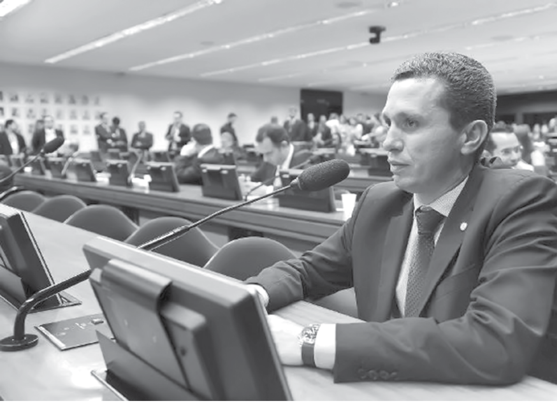
Pinato destaca que o cadastro e acompanhamento se fazem imprescindíveis, pois, no Brasil, apenas um em cada 1000 superdotados tem acesso a esses benefícios

zem imprescindíveis, pois, no Brasil, apenas um em cada 1000 superdotados tem acesso a esses benefícios. Segundo estimativa da Organização Mundial de Saúde (OMS), no país, de 3,5% até 5% das pessoas têm algum tipo de habilidade desenvolvida além da média.