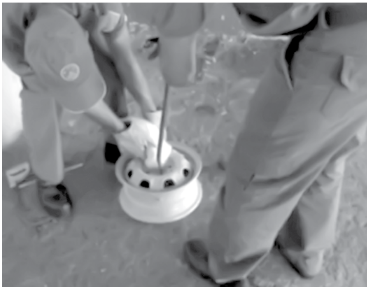
Bombeiros tentam retirar cabeça do gato da roda

do banco trocava os cartões e cortava um cartão falso em frente à vítima. Depois disso, o comparsa de R.R. ligava para a vítima, dizendo que o novo cartão chegaria em 3 dias e que precisava da senha para enviá-lo desbloqueado. Já com a senha e o cartão da vítima, os estelionatários faziam saques e compras. Com a prisão de R.R. foram esclarecidos oito casos de estelionato na cidade de Jales, dois em Fernandópolis, um em Araçatuba, um em Birigui, dois em Itapira, um em Rio Preto, um em Penápolis, três em Votuporanga, dois em Lins e um caso em Ribeirão Preto. Segundo informações da delegacia Seccional de Jales, há indícios de que os crimes eram praticados há pelo menos 2 anos. Foram encontrados cartões com o investigado relacionados com boletins de ocorrência elaborados no ano de 2013. A Justiça decretou a prisão preventiva de R.R. e, agora, a Polícia Civil procura identificar outras pessoas que tenham sido vítimas do criminoso.