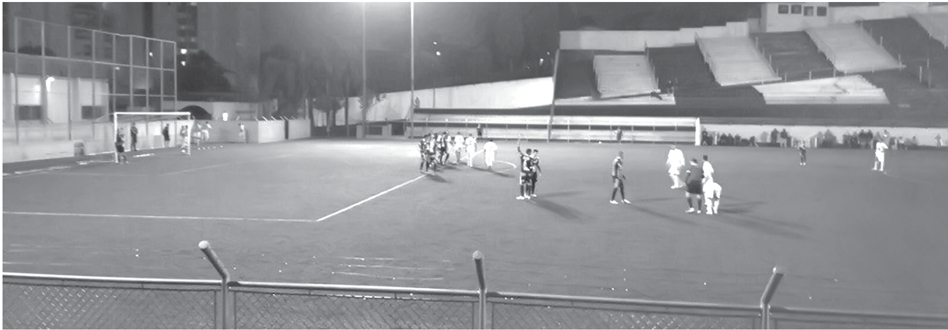
A partida entre São Bernardo e Fefecê foi marcada pelo equilíbrio e somente ganhou emoção em sua reta final

→ BRENO GUARNIERI contato@oextra.net Jogando fora de casa, o Fernandópolis Futebol Clube (Fefecê), na noite da última sexta-feira (11), arrancou um empate por 1 a 1 com o EC São Bernardo pela quarta rodada da segunda e decisiva fase do Campeonato Paulista da Quarta Divisão. O embate foi realizado no estádio Baetão, em São Bernardo do Campo, região metropolitana de São Paulo. Com o resultado, o time do ABC assumiu a liderança isolada do Grupo 4, com oito pontos, um a mais que o próprio Fefecê, vice-líder com sete pontos. A Inter de Bebedouro, que nesta rodada perdeu, em casa, para o Manthiqueira, por 1 a 0, também tem sete pontos, mas está em terceiro por ter saldo de gols inferior ao da Águia (2 a 1). Nesta fase, de acordo com o regulamento, as equipes jogam entre si em turno e retorno e os dois primeiros de cada grupo se classificam para a Série A3 de 2016. Os primeiros de cada grupo fazem a final da divisão.