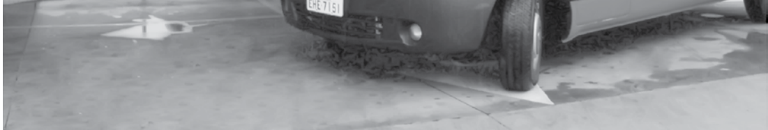
Pronto Socorro da Santa Casa de Votuporanga: novo modelo já está em vigor

Consultórios Municipais, de acordo com os horários de funcionamento, de segunda a sexta-feira. Já o Pronto Atendimento deve acontecer na UPA – Unidade de Pronto Atendimento, e no Mini Hospital do Pozzobon, que funcionam 24 horas por dia. Estas duas unidades - UPA e Mini Hospitla (Pozzobon) - estão sendo reestruturados com novos materiais, equipamentos e profissionais, inclusive médicos, para atender a