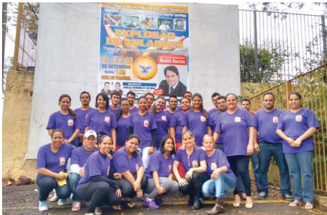
Membros da Igreja reunidos para divulgar o evento pela cidade