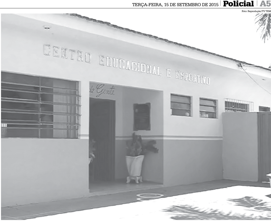
Escola, que foi alvo dos ladrões durante o final de semana, não conta com vigia

Ainda de acordo com o boletim de ocorrência, os assaltantes levaram cerca de R$ 20 mil em eletroeletrônicos, entre eles três notebooks, dois micro-ondas, três TV's de led, dois datashows e quatro home theater, que estavam armazenados no local. Não havia vigia na escola no momento da ação criminosa.