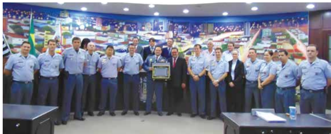
Autoridades policiais participaram da solenidade