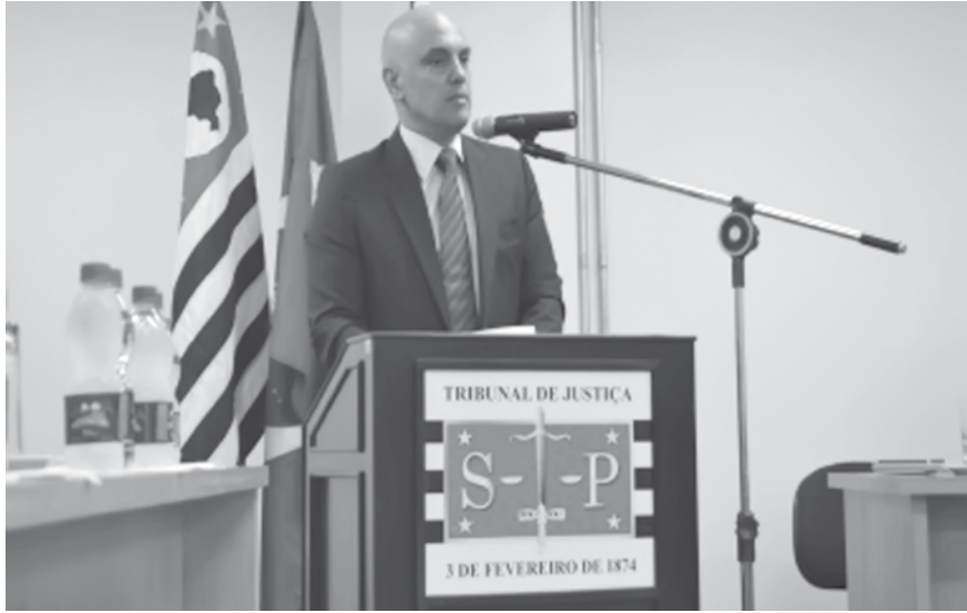
Secretário Alexandre de Moraes foi um dos responsáveis pela implantação do programa em São Paulo

→ Da REDAÇÃO contato@oextra.net A economia de recursos públicos proporcionada pela realização de audiências custódia em 17 estados brasileiros foi ressaltada pelo presidente do Conselho Nacional de Justiça (CNJ) e do Supremo Tribunal Federal (STF), ministro Ricardo Lewandowski, na última segunda-feira (14), durante o lançamento do projeto em Rondônia. Desde que a iniciativa foi lançada, em fevereiro deste ano, as audiências de custódia – ou audiências de apresentação – já economizaram cerca de meio bilhão de reais aos cofres públicos ao evitar a manutenção no sistema carcerário de quase 6 mil presos em flagrante por crimes de menor potencial ofensivo. A estimativa é de que, em um ano, a economia alcance R$ 4,3 bilhões, segundo levantamento do Departamento de Monitoramento e Fiscalização do Sistema Carcerário e do Sistema de Execução de Medidas Socioeducativas (DMF) do CNJ, apresentado pelo ministro em Porto Velho (RO). A média de soltura nas audiências de custódia é de 50% dos casos. A liberdade concedida em nada afeta o prosseguimen-