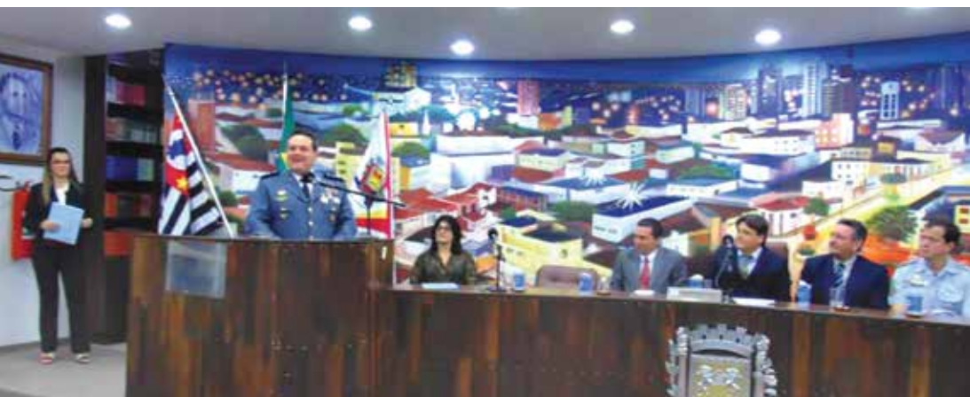
Homenageado falou sobre sua trajetória na PM e em Fernandópolis