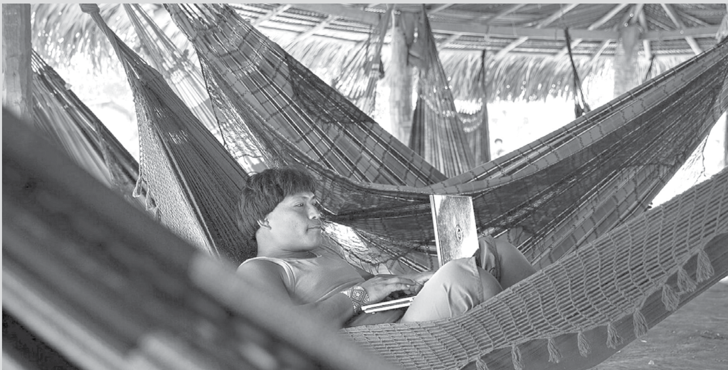
Índio do Xingu usa computador durante pausa para almoço em encontro com suruí no Estado de Rondônia, na cidade de Cacoal.