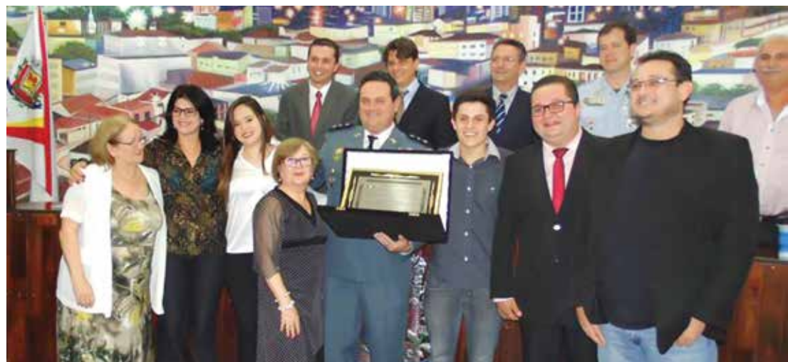
Família do homenageado prestigia a noite solene