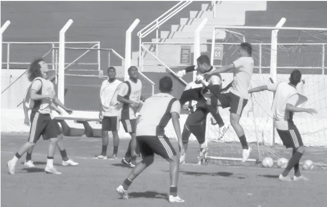
Jogadores do Fefecê participam de treino coletivo no municipal Claudio Rodante

Logo mais à noite, a equipe fernandopolense terá pe-