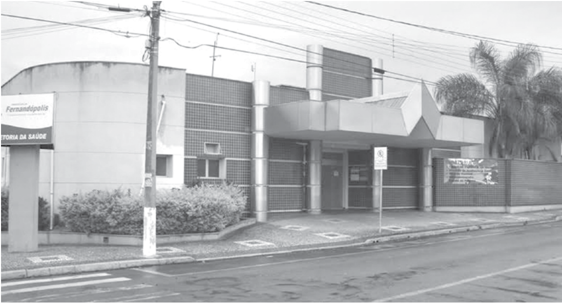
Verba deverá ser utilizada na aquisição de equipamentos e material permanente

→ ASSESSORIA DE IMPRENSA Prefeitura de Fernandópolis O Fundo Municipal da Saúde de Fernandópolis recebeu esta semana um aporte de R$ 550 mil, originário de três emendas parlamentares. A verba, do tipo “Fundo a Fundo”, deverá ser utilizada na aquisição de equipamentos e