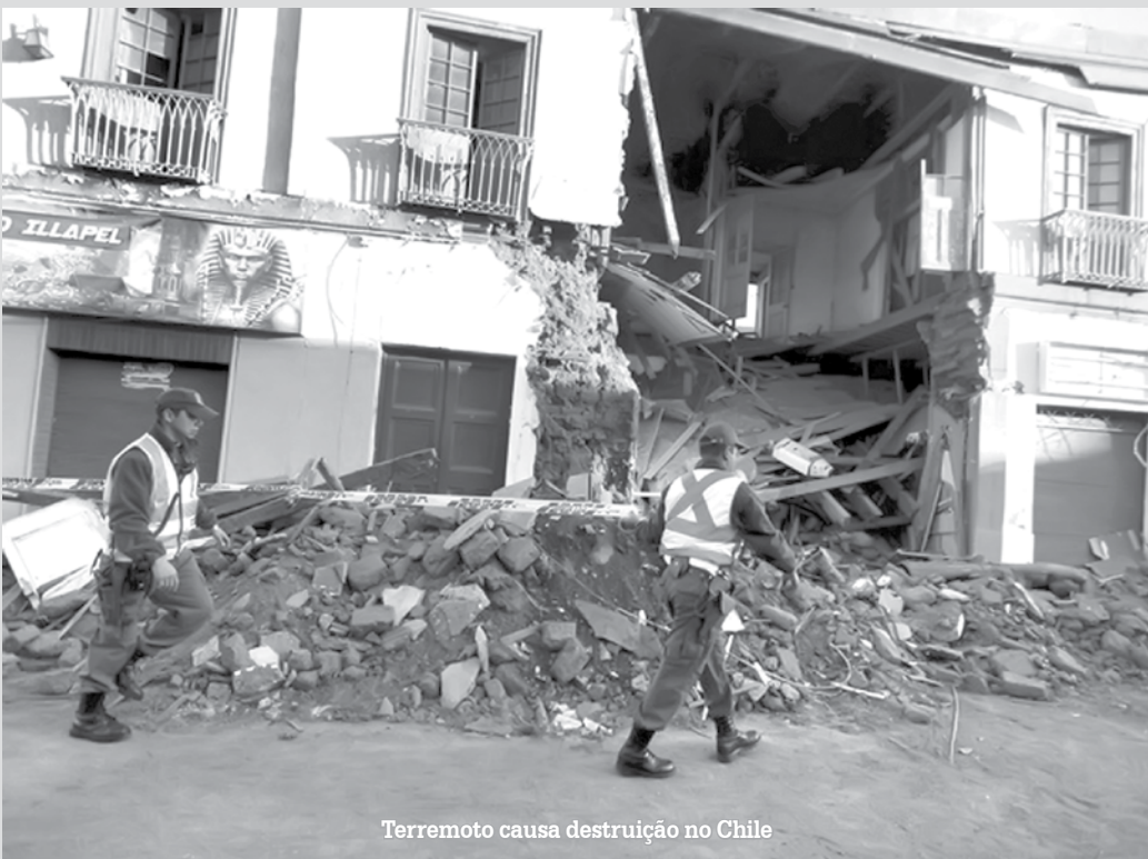
Terremoto causa destruição no Chile

Um forte terremoto ocorreu na quarta-feira ao norte de Santiago, no Chile. Segundo o jornal 'El Mercurio', a magnitude preliminar do tremor é 8.3. Um alerta de tsunami foi emitido pelas autoridades para toda a região costeira. As autoridades locais determinaram a evacuação das áreas litorâneas, enquanto imagens de televisão mostravam sirenes de alerta ativas. O tremor causou a morte de pelo menos 11 pessoas e tirou 1 milhão de casa. O tremor também foi sentido em algumas cidades do Brasil, segundo o relato de moradores e do Corpo de Bombeiros. Em Santa Maria (RS), pelo menos dois prédios foram desocupados por moradores. Os Bombeiros de São Paulo também receberam cerca de 50 telefonemas com informações sobre tremores na região da Avenida Paulista, Vila Mariana e Tatapé. Ainda houve relatos de tremores no litoral de São Paulo e no Vale do Paraíba.