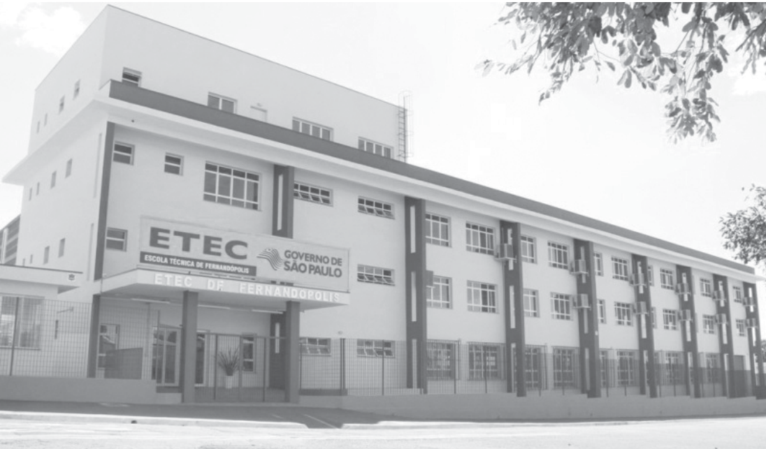
Etec de Fernandópolis tem diversas atividades programadas até o final do ano