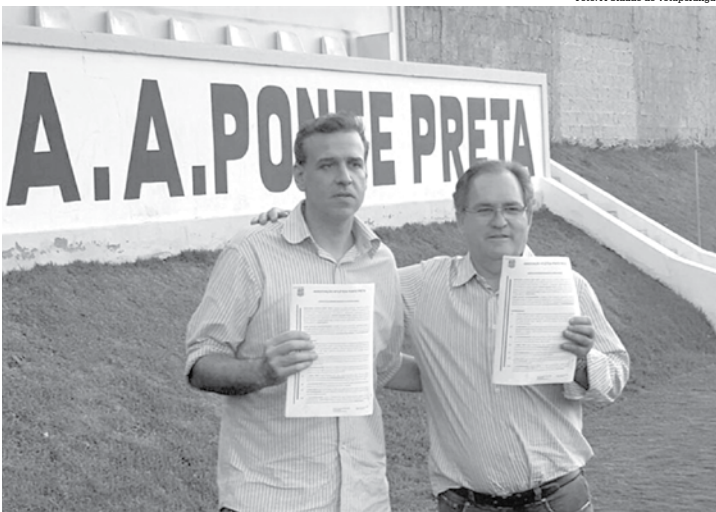
Parceria foi firmada em Campinas, na sede da Ponte Preta

O elenco do Votuporanguense deve se apresentar para a pré-temporada no dia 1º de dezembro. Fundada em 11 de agosto de 1900, a Ponte Preta é o segundo clube mais antigo do Brasil e disputa a Série A do Brasileiro e também o Paulistão.