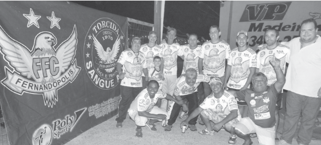
Alguns integrantes da Sangue Azul durante reunião realizada na “VP Madeiras” na noite desta quarta-feira