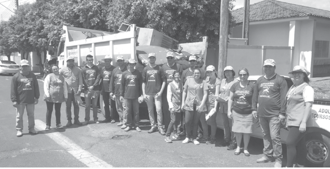
A Secretaria Municipal da Saúde realiza em setembro arrastões para retirada de criadouros do mosquito Aedes aegypti