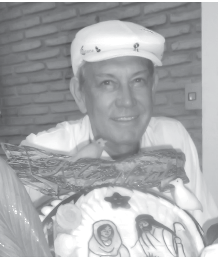
A arte, segundo Zezão, é extremamente detalhista