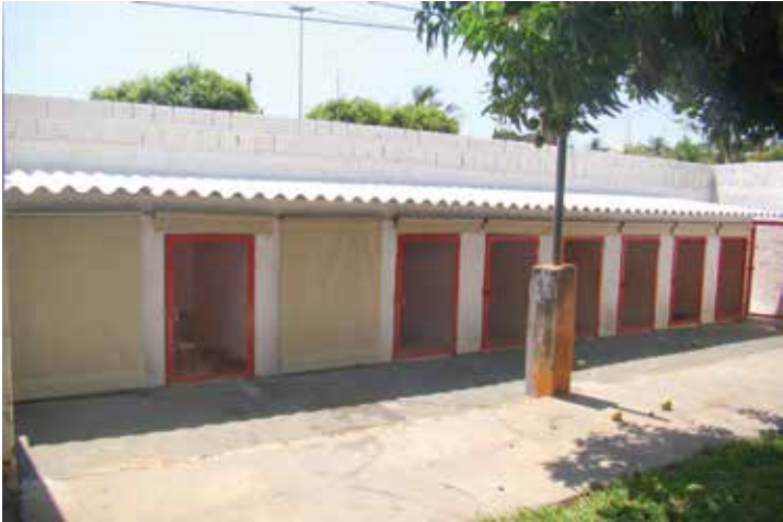
Hotelzinho proporciona maior conforto aos animais atendidos