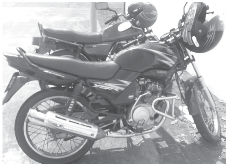
As duas motocicletas, uma Honda 125 e uma YBR 125, foram recuperadas e devolvidas às vítimas de Ouroeste

foram encaminhados para a Delegacia de Polícia Civil de Ouroeste, onde foram indiciados por Ato Infracional de furto e posteriormente foram liberados. Para a surpresa dos policiais, um dos menores, em seu histórico criminal, tem a participação em 14 furtos de veículos.