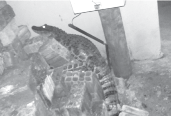
O filhote de jacaré foi visto por moradores do Jardim das Flores

minhado a um córrego, situado próximo ao distrito de Arabá, sendo solto em seu habitat natural.