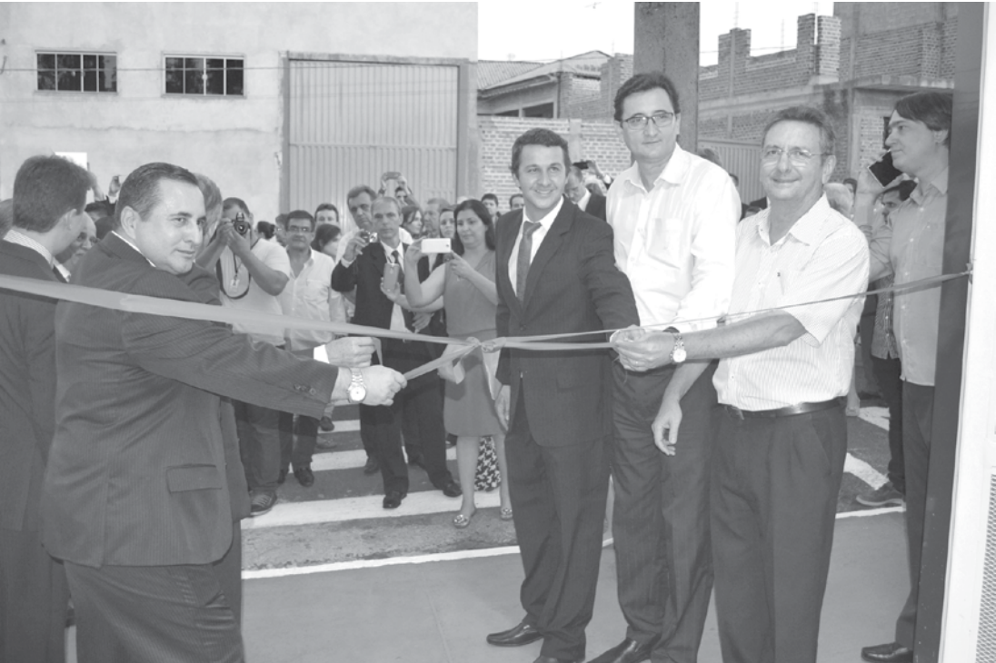
Registro do descerramento da faixa inaugural