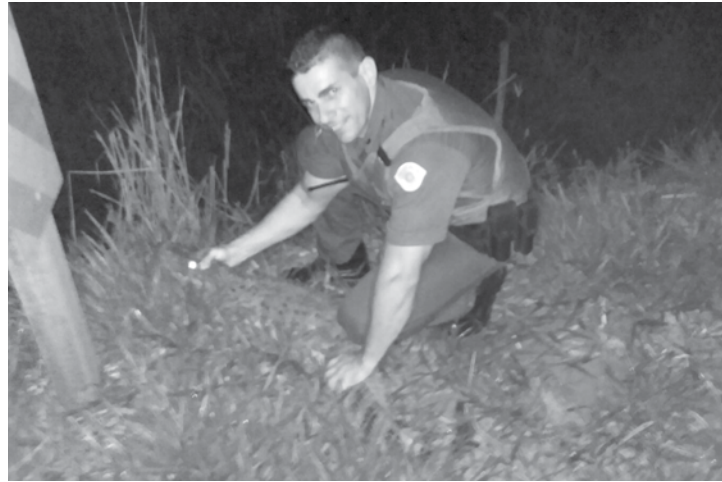
O animal foi encaminhado a um córrego próximo ao distrito de Arabá