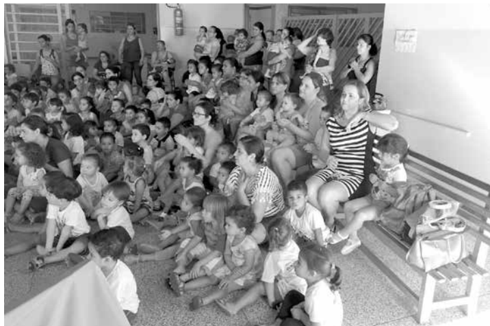
Centenas de pais foram convidados para participar de um dia da família na escola