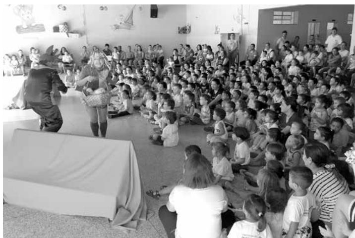
Espetáculo “Emília na terra do contrário” relatado a importância da valorização da família, da escola e dos amigos