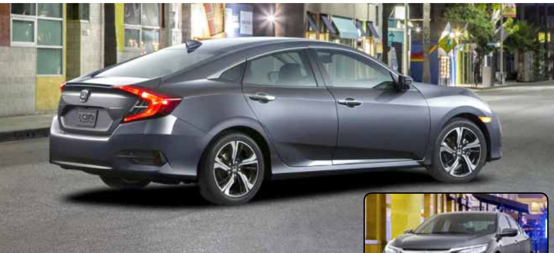
Atualização na motorização é a principal novidade introduzindo o motor turbo num 1.5, visando economia de combustível; por fora, linhas são mais próximas a um fastback, sem a traseira pronunciada

Novidade chega em no segundo semestre de 2016 com linhas fastback, similarmente ao que a Ford fez com o novo Focus