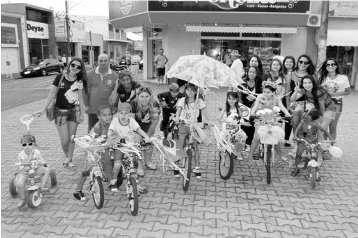
Companheiros do Leo e Lions Club de Ouroeste junto aos participantes mirins

ceria com os LEOs Clube de Ouroeste, Palmeira d'Oeste e Votuporanga, em comemoração ao Dia da Independência do país. Durante o evento, compa-