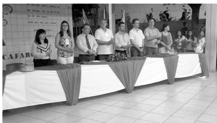
Mostra de Ciência começou com cerimônia solene; em seguida público visitou as salas para acompanhar de perto os quase 70 projetos elaborados pelos alunos