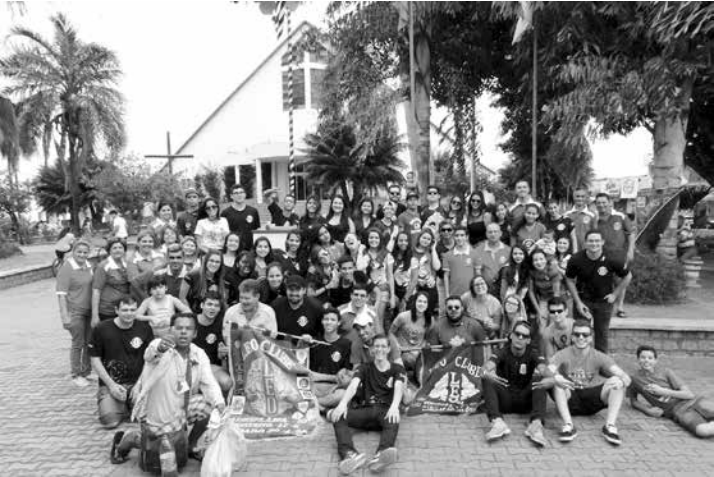
Passeio ciclístico foi organizado pelo Leo Clube de Auriflama, em parceria com os LEOs Clube de Ouroeste, Palmeira d'Oeste e Votuporanga

Mais de 500 pessoas se reuniram na manhã do último dia 7 de setembro em um passeio ciclístico na cidade de Auriflama, organizado pelo Leo Clube da cidade, em par-