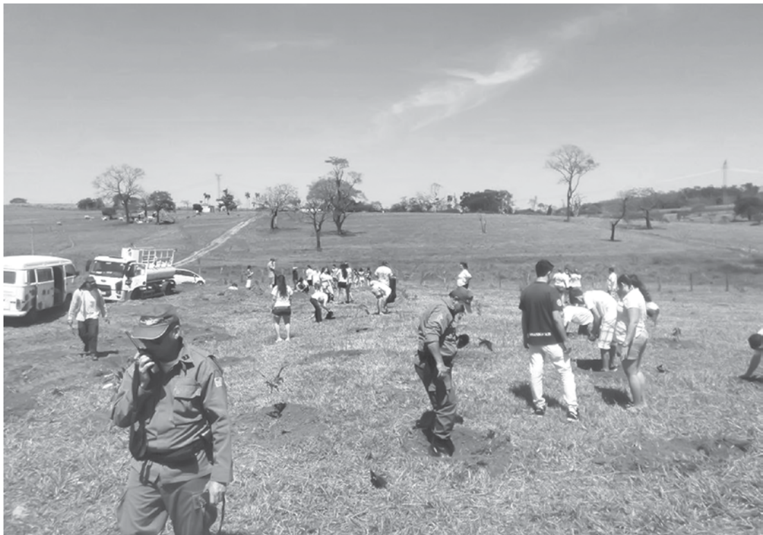
Profissionais envolvidos nas atividades do projeto ambientalista “Hora Verde”

→ ASSESSORIA DE IMPRENSA Prefeitura de Fernandópolis A Prefeitura de Fernandópolis, através da Secretaria Municipal do Meio Ambiente, participou no último domingo (20), do projeto ambientalista “Hora Verde”, uma iniciativa do Sistema Ambiental Paulista – AmbienteSP, com o objetivo de estimular em todo o Estado a reflexão sobre a necessidade da conservação e do aumento da cobertura vegetal. Fernandópolis foi um dos 94 municípios paulistas que participaram da ação simultaneamente. Durante a manhã, foram plantadas 150 mudas de árvores nativas no Distrito Industrial V “Ângelo Simonato”, em parceria com a Polícia Ambiental, escola “José Belúcio”, Arco Iris - Assembleia Luz do Amanhã, Demolay - Capítulo Fernandópolis nº. 02/41, Rotaract Clube Fernandópolis, Interact Fernandópolis, 4º semestre de Biologia da FEF e Sabesp. O projeto propõe que a ação seja um momento em que Prefeituras, entidades não governamentais, setor privado, órgãos do Estado e indivíduos realizem plantios, no mesmo horário, em suas cidades. “Foi uma ação muito bonita e que contribuiu com os demais projetos realizados no município pela conservação do Meio Ambiente, frisando principalmente, a importância do envolvimento de toda sociedade”, disse a secretária municipal Tais Moita.