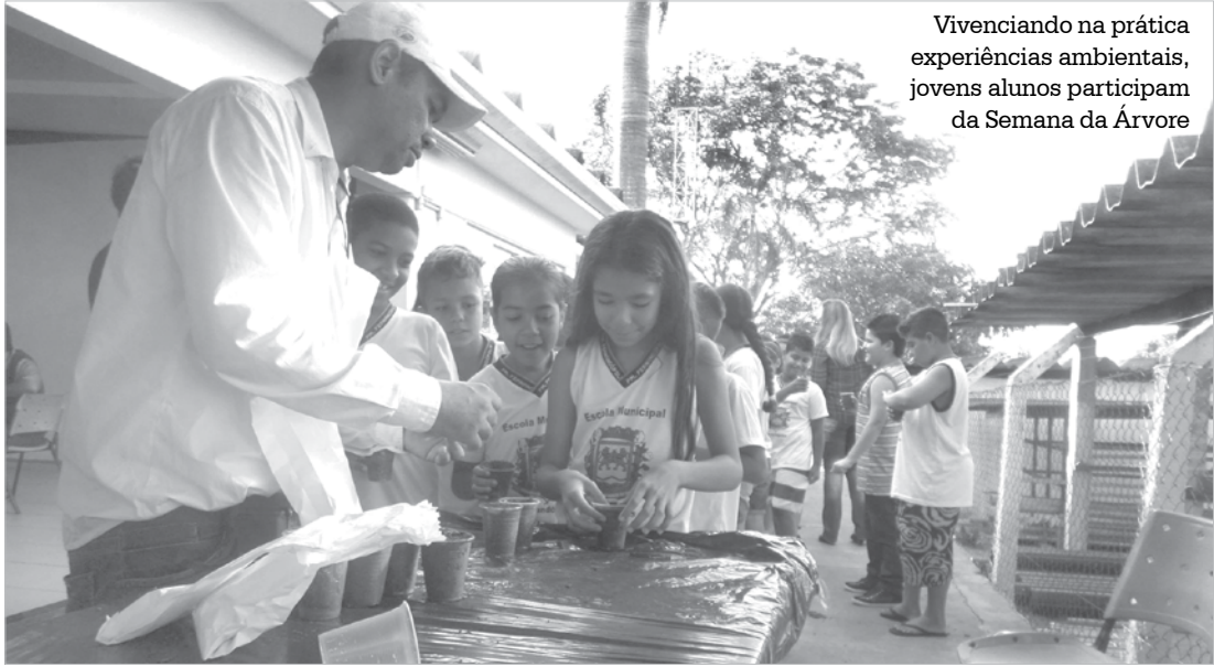
Vivenciando na prática experiências ambientais, jovens alunos participam da Semana da Árvore

→ ASSESSORIA DE IMPRENSA Prefeitura de Fernandópolis A Secretaria Municipal do Meio Ambiente está realizando diversas ações em comemoração ao “Dia da Árvore”, celebrado ontem (21). A programação teve início no dia 16 e segue até amanhã. Alunos de escolas municipais e es-