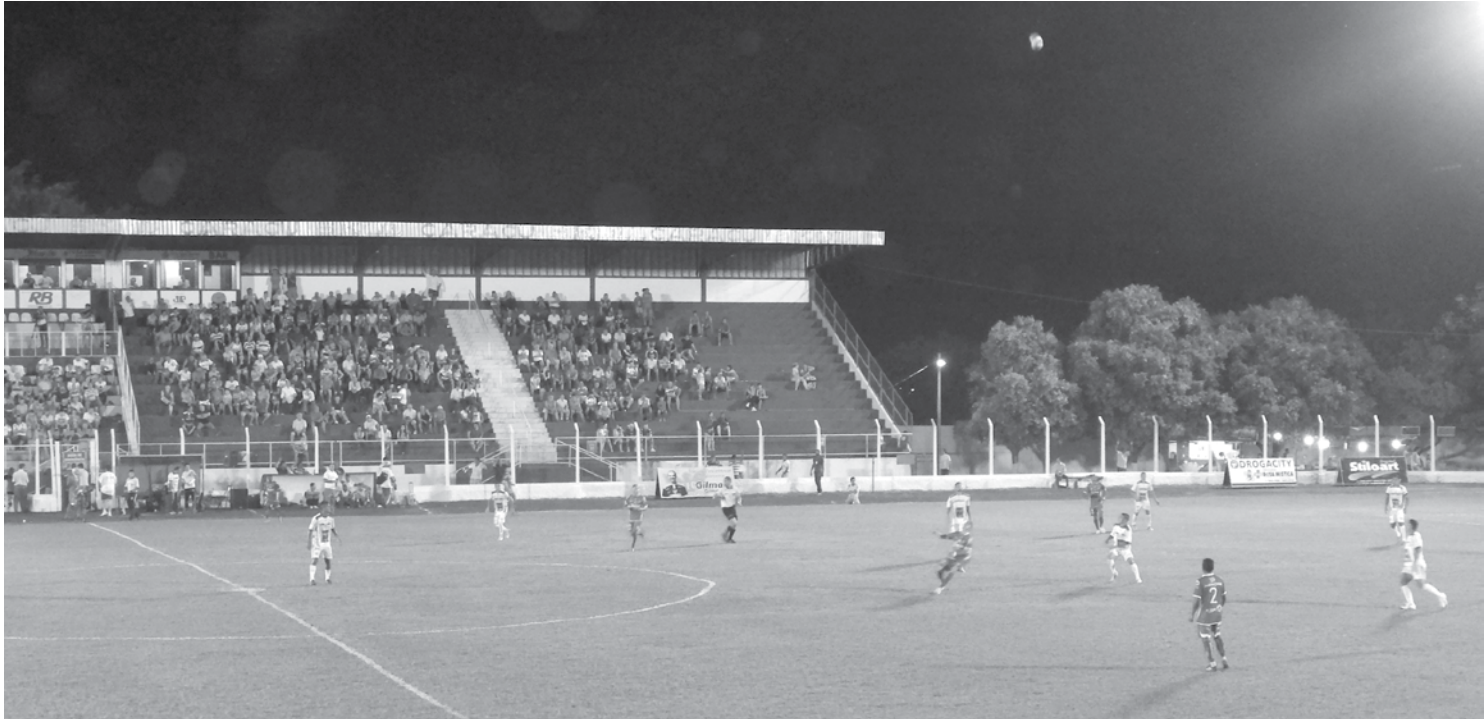
Vitória deixou a Águia como líder do Grupo 4 do Paulista