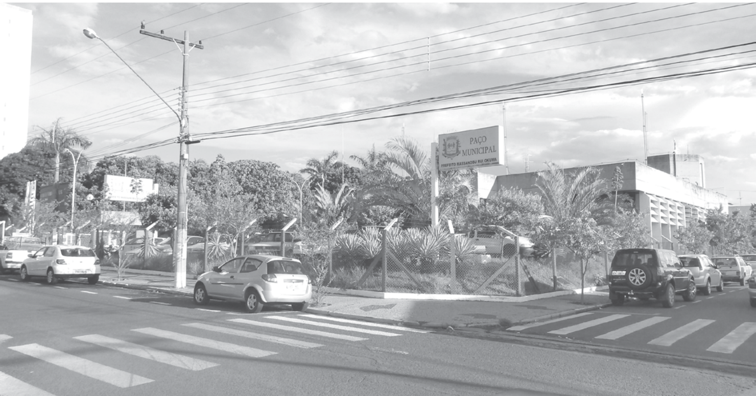
O aguardado concurso público da Prefeitura de Fernandópolis tem seus editais publicados nesta terça-feira (22)

→ Da REDAÇÃO contato@oextra.net Os três editais referentes ao concurso público da Prefeitura de Fernandópolis - com carga horária, salário e número de vagas - estão publicados na edição desta terça-feira, 22 de setembro, de “O Extra.net”, o jornal responsável