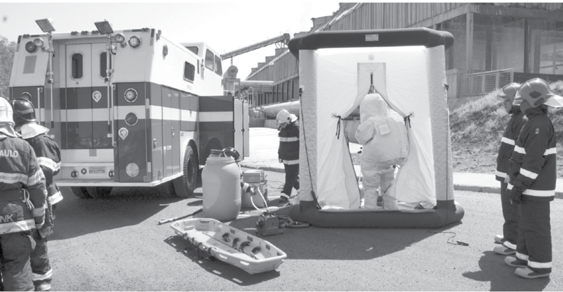
Com 11 viaturas e mais de 50 profissionais, Simulado de Incêndio mobilizou a Usina Noble, em Meridiano