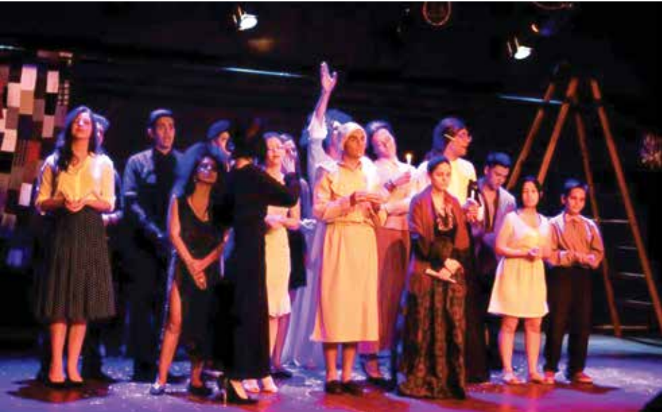
Interpretação dos atores "contagiu" o público que lotou o Teatro Municipal "Merciol Viscardi", em Fernandópolis