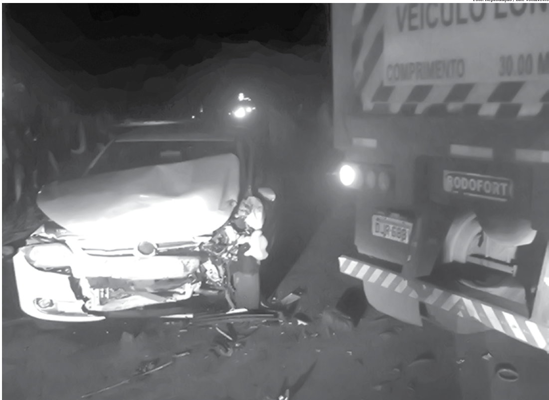
Jovem bateu veículo na traseira do caminhão reboque

Ele era de General Salgado. O motorista do caminhão não ficou ferido. Segundo informações da perícia que esteve no local, o caminhão de cana estava carregado e transitava em lugar proibido porque a rodovia não tem a terceira faixa. O corpo do jovem foi velado e sepultado em General Salgado.