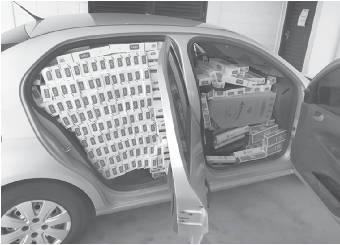
Carga de cigarros contrabandeados vinha do Paraguai

dicou quem teria oferecido o serviço. O veículo utilizado foi alugado em Jundiá. O rapaz foi preso em flagrante e irá responder por contrabando internacional. A mercadoria e o jovem serão encaminhados para a Polícia Federal em São José do Rio Preto. A contagem final do número de cigarros será feita na base da Polícia Federal.