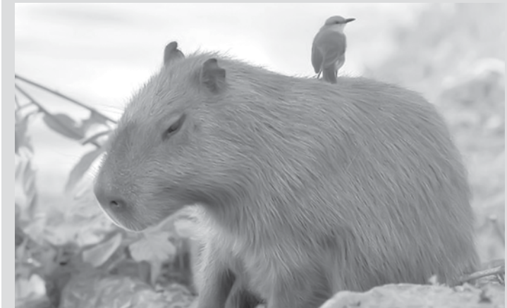
Geralmente, os animais capturados são mortos e limpos no próprio local

Nesses casos, os caçadores são liberados para responder ao processo em liberdade. A condenação, na maioria dos casos, é convertida em prestação de serviço à comunidade ou pagamento de cestas básicas. A exceção que leva à prisão é a caça com arma de fogo, crime infiançável cuja pena varia de dois a quatro anos de reclusão. A maior dificuldade, segundo o capitão, é pegar os caçadores em flagrante. Para auxiliar nas ocorrências, a polícia conta com serviço de inteligência que identifica autores, modos de agir e locais de caça e armazenamento de utensílios para a prática. Com os dados em mãos, são expedidos os mandados de busca e apreensão.