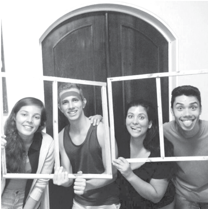
Jovens voluntários do Grupo Toró: “muita história pra contar”

O projeto busca atrair novos leitores para a Biblioteca Municipal de Fernandópolis através do trabalho de contação de histórias envolvendo música, daí nasceu o Grupo Toró. A ideia é formar esse público de leitores, desde ce-