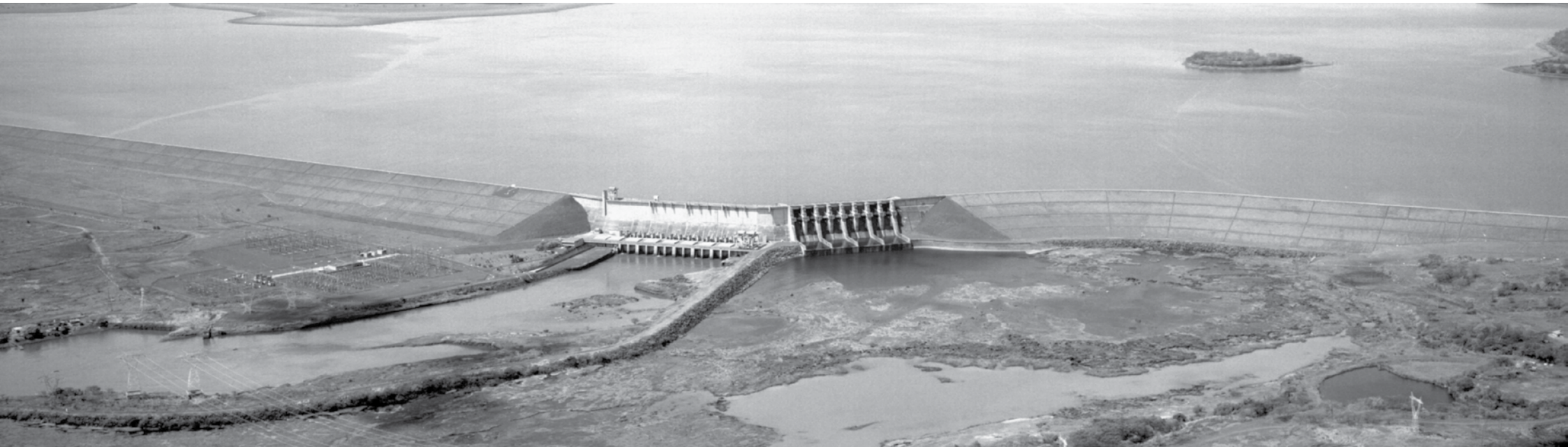
2015 vem registrando níveis positivos do volume útil do reservatório da Usina Hidrelétrica de Água Vermelha

→ JOÃO LEONEL joaoleonel@oextra.net Os índices do “volume útil” do reservatório da Usina Hidrelétrica de Água Vermelha, no município de Ouroeste, vêm registrando altas consecutivas em 2015, principalmente nos últimos 6 meses já contabilizados - de março a agosto. O ano começou ainda com os baixos índices registrados em 2014, quando chegaram a 14% em abril. Com uma pequena alta de janeiro para fevereiro - saltando de 20,38% para 21,07% - o nível, desde então, apresentou alta constante, até o mês de julho, quando praticamente chegou a 70% - ficou