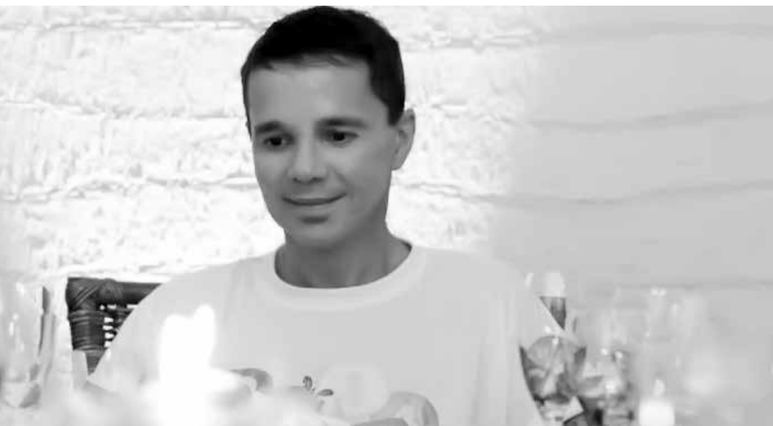
Netinho apresenta melhoras a cada dia

Netinho foi internado novamente no Hospital Sírio-Libanês, em São Paulo, após sentir fortes dores no pescoço, tontura e diplopia (visão dupla), na última quarta-feira (23).