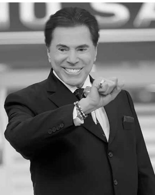
Teleton não deverá contar com estrelas da Record

A emissora de Edir Macedo, aliás, decidiu não liberar nenhum artista de seu elenco para participação no projeto. O motivo seriam as piadas de Danilo Gentili sobre seus programas e contratados. Insatisfeita com a ‘perseguição’, a empresa está disposta a não participar do encontro.