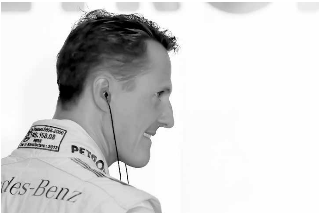
A Superação de Schumacher

No início de setembro de 2014, Schumacher deixou a clínica suíça e foi levado para a casa. Na nota enviada à imprensa pela assessoria de Michael na época, a transferência não indicava uma melhora significativa em seu quadro. Segundo a imprensa alemã, o maior vencedor da F1 vem sendo tratado por uma equipe especializada de 15 pessoas.