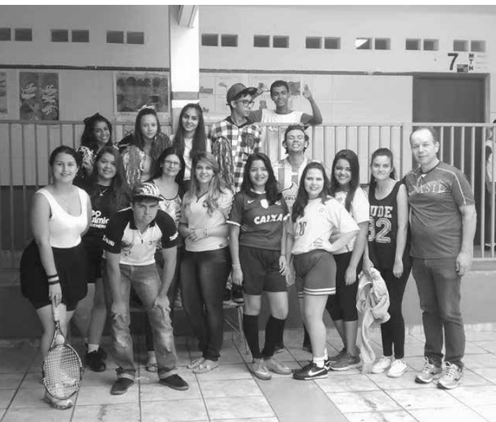
Destaque para a galerinha do 3º ano da escola Tanuri , se preparando para a formatura e a despedida da turma.