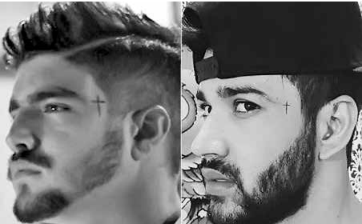
Sertanejo desenhou uma cruz no rosto, igual ao personagem Grego da novela 'I Love Paraisópolis'.

"Que eu reze não para ser preservado dos meus medos, mas para olhá-los de frente", escreveu Gustavo Lima mais cedo na legenda da foto. Rapidamente os comentários da foto foram tomados por comparações com o personagem de Caio Castro e com MC Guimê, que também têm desenhos em formato de cruz no rosto. "Olha o Grego", "Lindo, tipo Grego", "Fechou com MC Guimê" e "Quer virar o Guimê" foram alguns deles.