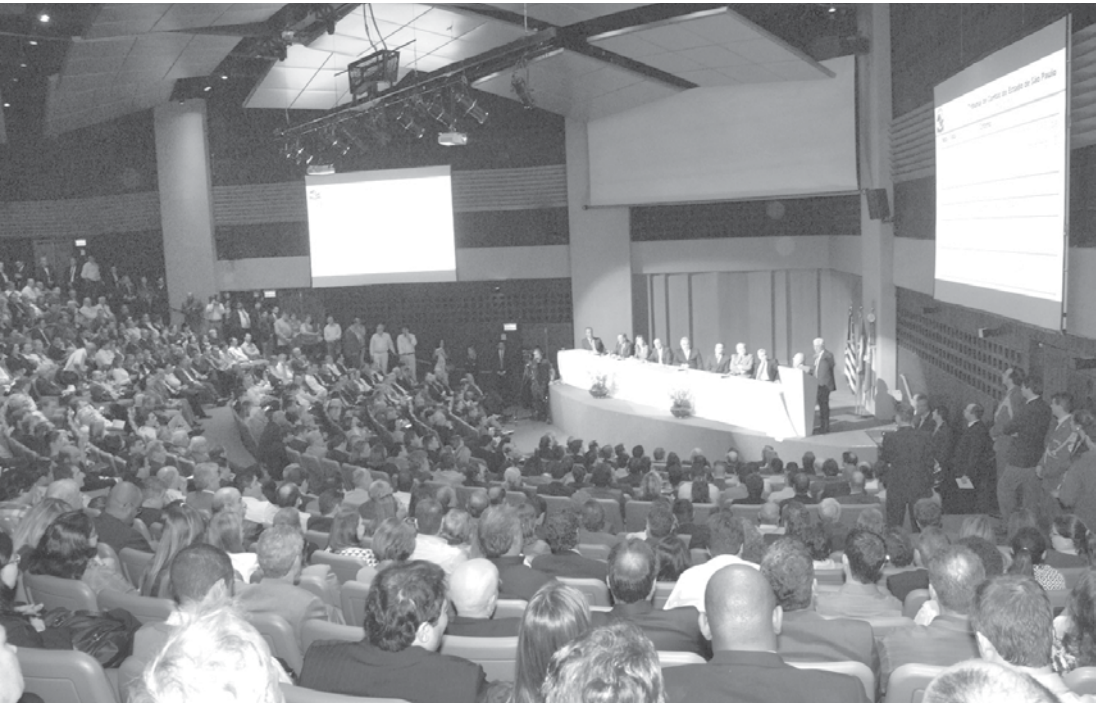
Cerimônia do TCE-SP para apresentação do IEGM, no Centro de Convenções Rebouças, em SP

São 125 vagas para o cargo de Auxiliar da Fiscalização Financeira II, com remuneração inicial de R$ 5.760; inscrições serão realizadas até dia 23