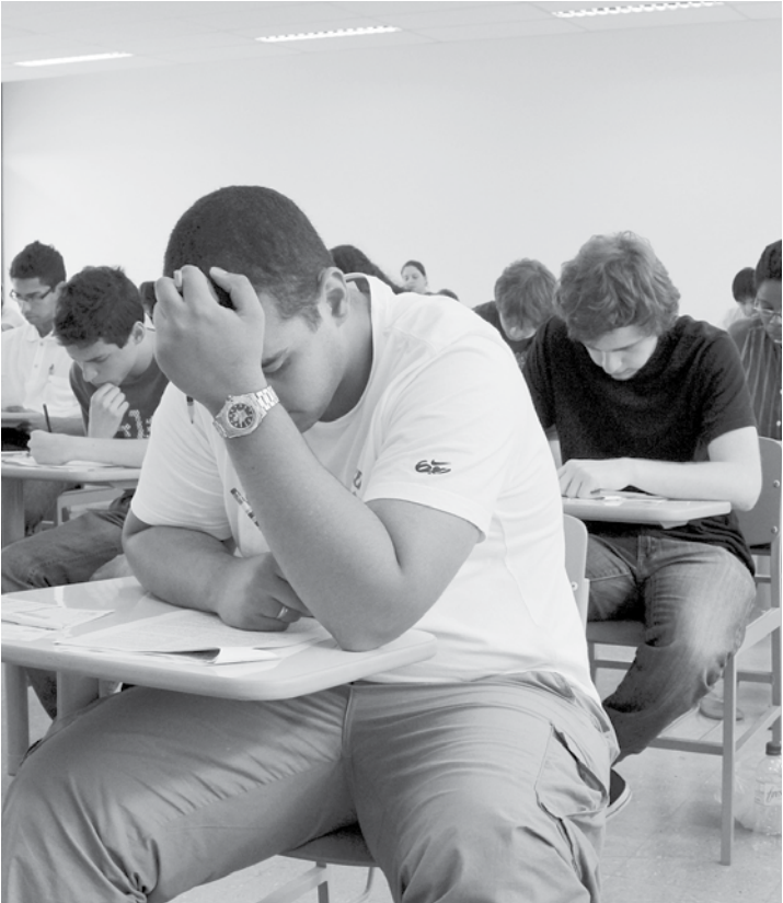
Interessados devem solicitar benefício na secretaria das próprias escolas até o dia 13; primeira fase está marcada para novembro

rar para as provas com ajuda da plataforma Geekie+. Até o dia 23 de outubro, a Secretaria mantém no Portal da Educação ( www.educacao.sp.gov.br ) um simulado com todas as áreas e disciplinas exigidas no vestibular. O conteúdo pode ser acessado via computador ou qualquer dispositivo móvel (celular e tablet) 24 horas por dia.