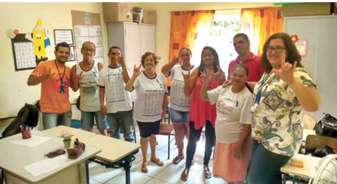
Assistidos pela APADAF durante palestra realizada no Dia Internacional do Surdo