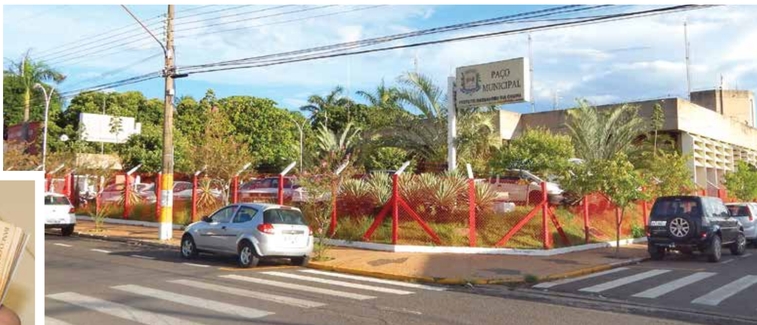
Enfrentando a crise que se abate nas Prefeituras de toda a região, Executivo municipal pagará hoje parte dos salários do funcionalismo