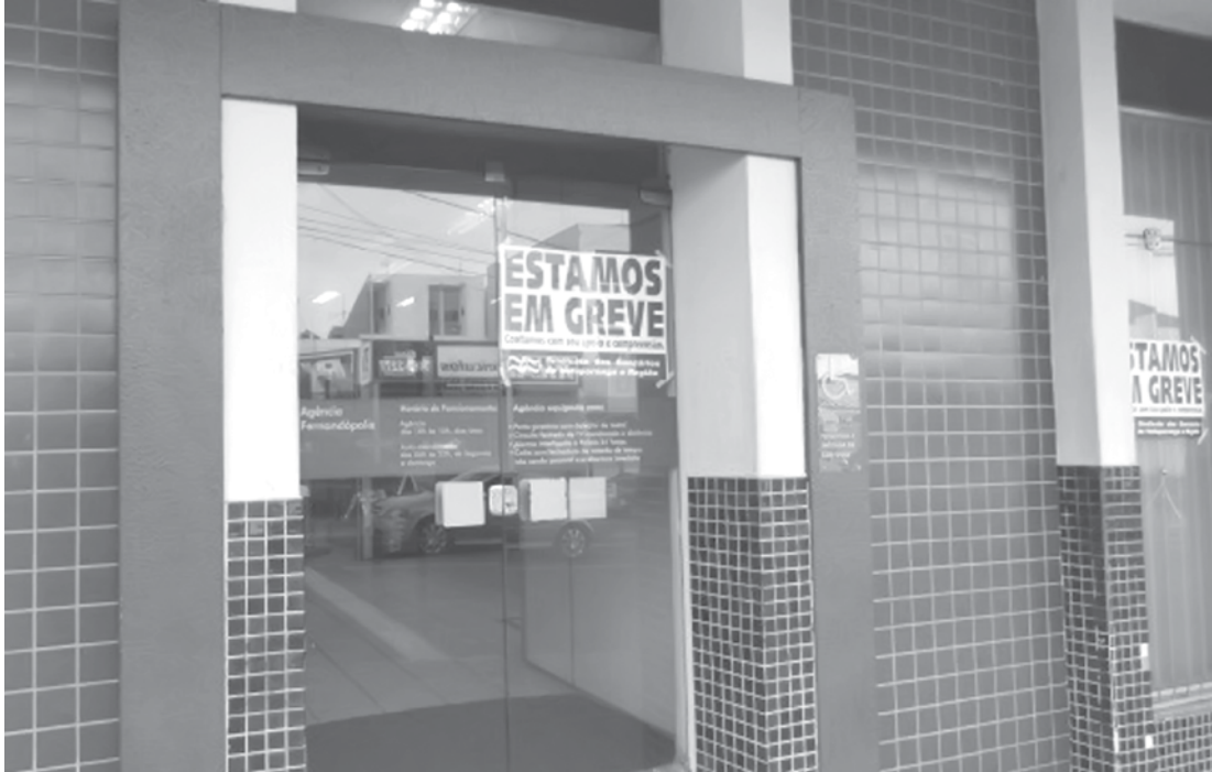
Na manhã de ontem, agências amanheceram novamente com adesivos colados nos vidros, indicando a paralisação

3.299,66 participação nos Lucros e Resultado (PLR). A categoria também reivindica vales de alimentação e refeição, além de 13ª cesta e outros benefícios, além de melhorias nas condições de trabalho e segurança. ALTERNATIVAS Mesmo com o fechamento das agências, os consumidores, no entanto, não podem deixar de pagar as contas e devem procurar alternativas para fazer saques, transferências e as