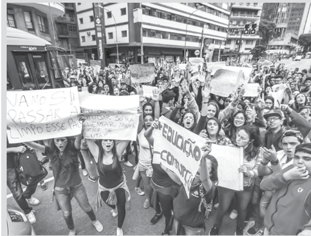
imagem do dia

Pais, alunos e professores da rede estadual realizavam uma manifestação protestando contra as mudanças que o governo pretende promover para reestruturar o ensino das escolas estaduais paulistas. A medida visa reorganizar a distribuição dos alunos nas escolas. As unidades passarão a atender exclusivamente um dos três ciclos de ensino: o primeiro, que abrange os alunos do 1º ao 5º ano do ensino fundamental; o segundo, com alunos do 6º ao 9º ano do fundamental; e o terceiro, que reúne os três anos do ensino médio. Atualmente, algumas escolas da rede estadual atendem alunos de mais de um dos ciclos. Para a Secretaria Estadual da Educação, o ideal é que as escolas recebam apenas estudantes de um dos ciclos e, desta forma, estejam mais focadas no aprendizado da faixa etária que atende. A expectativa do governo é de que até mil escolas sejam apenas atingidas com a mudança. Segundo a assessoria de imprensa da pasta de educação, os alunos que vão precisar ser transferidos serão matriculados em escolas que ficam até no máximo 1,5 quilômetro de suas casas. Eles serão informados sobre o endereço da nova unidade até o mês de novembro.