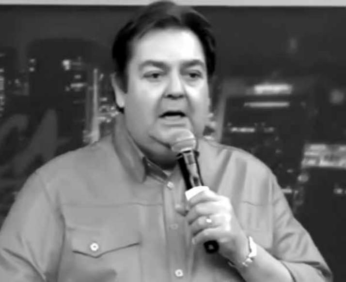
Gafe de Faustão vira comentários na net

Fausto Silva cometeu uma gafe durante o “Domingão do Faustão”, da TV Globo, do último fim de semana, ao mandar um recado para Ariano Suassuna, morto em julho de 2014.