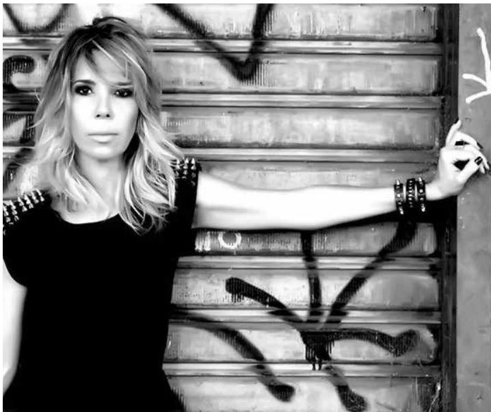
Close da competentíssima fotógrafa Laura Lima , que hoje celebra a chegada de mais um ano de vida. Felicidades!