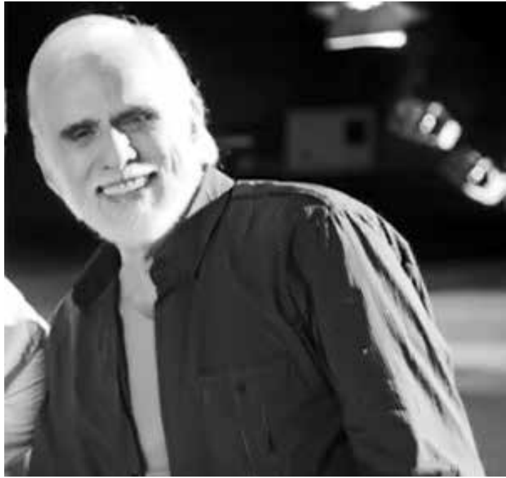
Cuoco será atração na novela das sete

A atriz trabalhou ainda em outras novelas da mesma autora, como O Sheik de Agadir (1966), A Sombra de Rebecca (1967), O Homem Proibido (1968), A Gata de Vison (1968/1969), quando contracenou com Tarcísio Meira, e A Ponte dos Suspiros (1969).