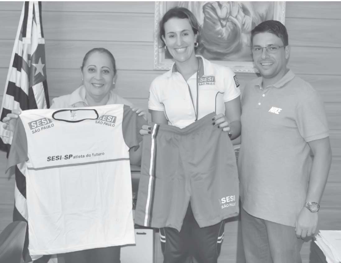
Em Fernandópolis, programa Atletas do Futuro atende 110 jovens