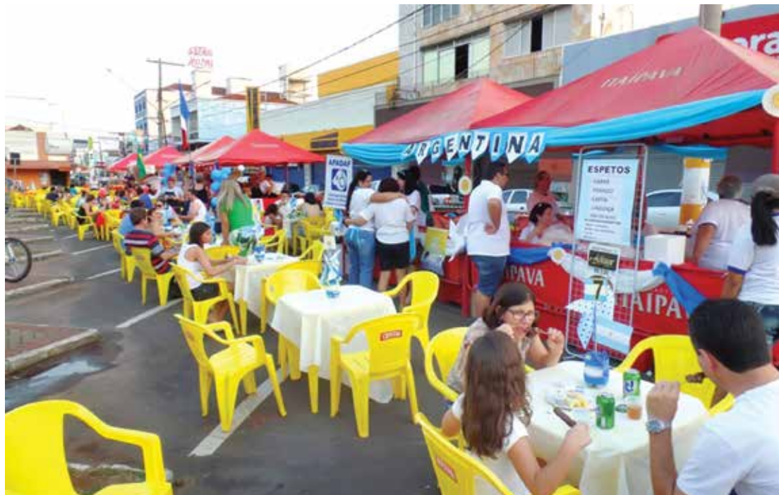
A visita do público e as arrecadações nas barracas superaram as expectativas das entidades assistenciais de Fernandópolis

“Foi uma linda festa, a população compareceu em peso. Teve entidade que vendeu tudo o que levou. Resgatar uma festa tradicional como esta é uma forma de oferecer diversão às famílias e contribuir com o trabalho das entidades. Somos gratos ao apoio de todos na realização e também da Polícia Militar, SAMU e Corpo de Bombeiros, que nos auxiliaram durante o evento”, disse a prefeita, que acompanhou a “Festa das Nações”.