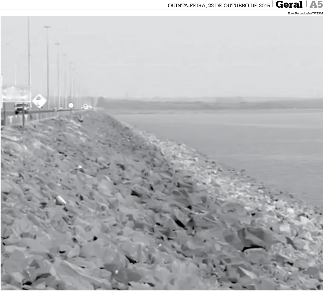
Hidrelétrica de Ilha Solteira opera com nível mínimo de volume útil de água

está bastante diferente. Por conta da cheia do rio, a usina Itaipu teve que abrir as comportas e escoar o excedente de água. Desde de julho o rio Paraná na parte mais baixa registra uma das maiores cheias da história. Outros reservatórios de Hidrelétricas da região estão com o nível mais confortável. Na usina do Marimbondo, o nível está em 38%. Já em Água Vermelha o nível está em 54,21%.