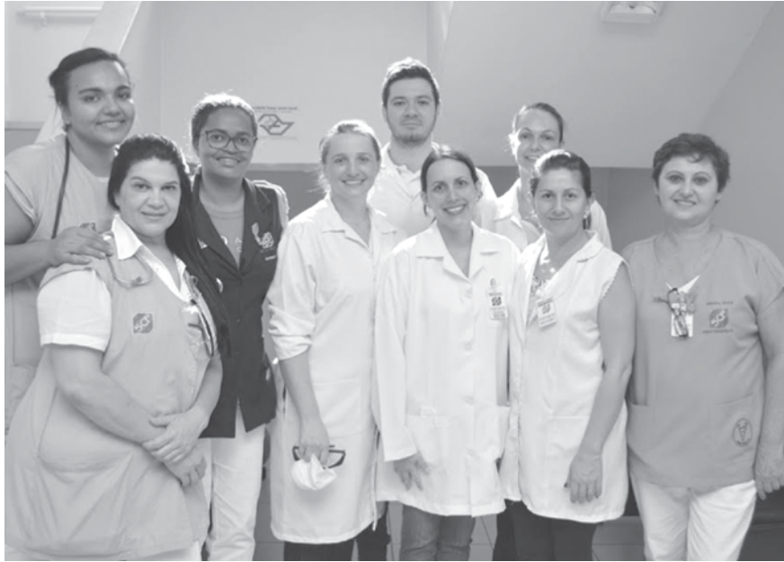
Fisioterapeutas da rede básica de saúde de Meridiano com a equipe do hospital

O Hospital de Ensino Santa Casa de Fernandópolis é um hospital de grande porte, atendendo diretamente aos 13 municípios da microrregião e considerado referência em atendimentos do SUS para aproximadamente 445 mil habitantes de