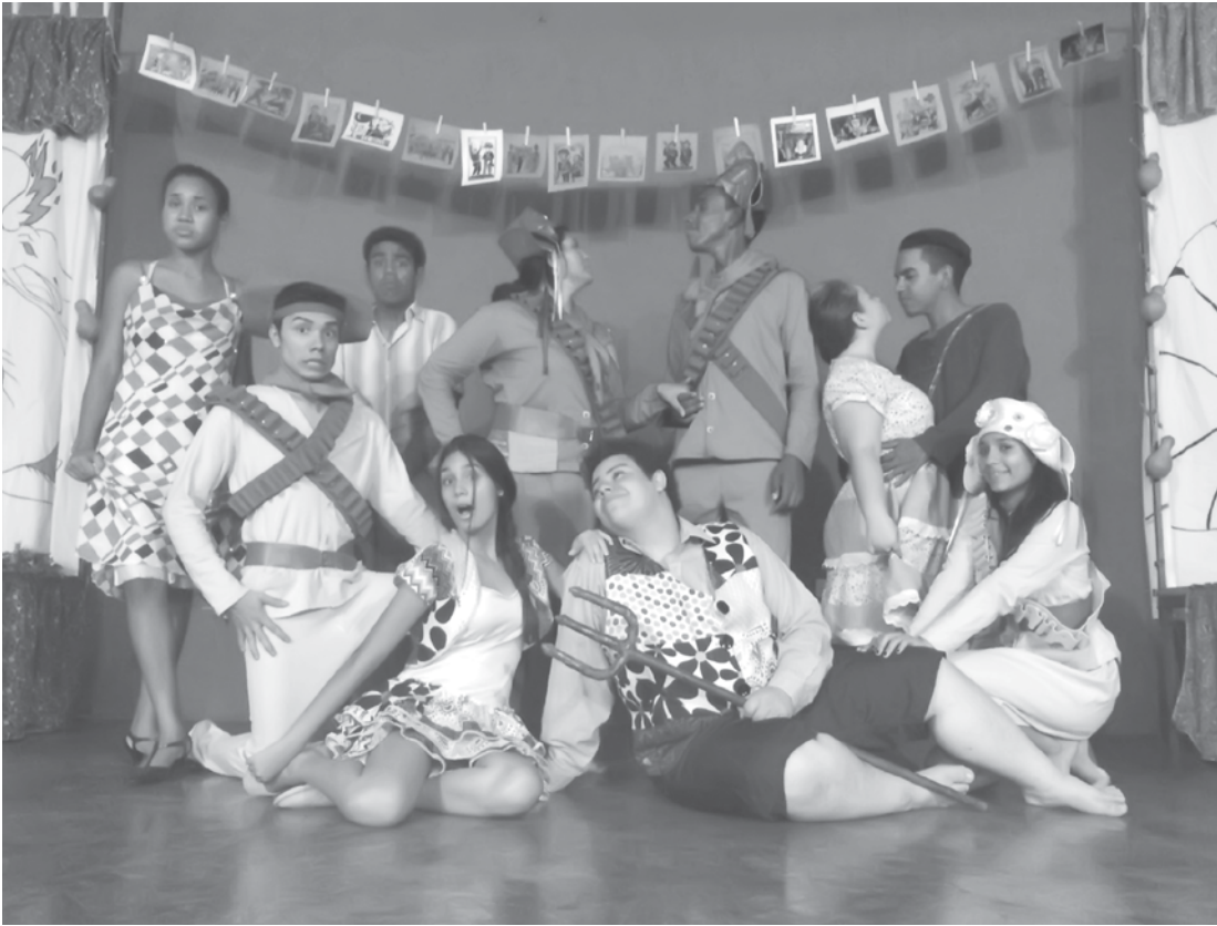
Um “ensaio aberto” foi realizado no último sábado, na escola Joaquim Antonio Pereira

bro, com sessões às 15h e às 20h, e valor único de ingresso a R$ 5,00. PROJETO ADEMAR GUERRA O Projeto Ademar Guerra foi criado em 1997 com o objetivo de propiciar orientação artística a grupos de teatro em atividade no interior do Estado de São Paulo. Esta ação se dá por meio da contratação de artistas-orientadores para atuarem junto aos grupos selecionados, acompanhando seus projetos de pesquisa e/ou montagem de espetáculos, possibilitando o intercâmbio