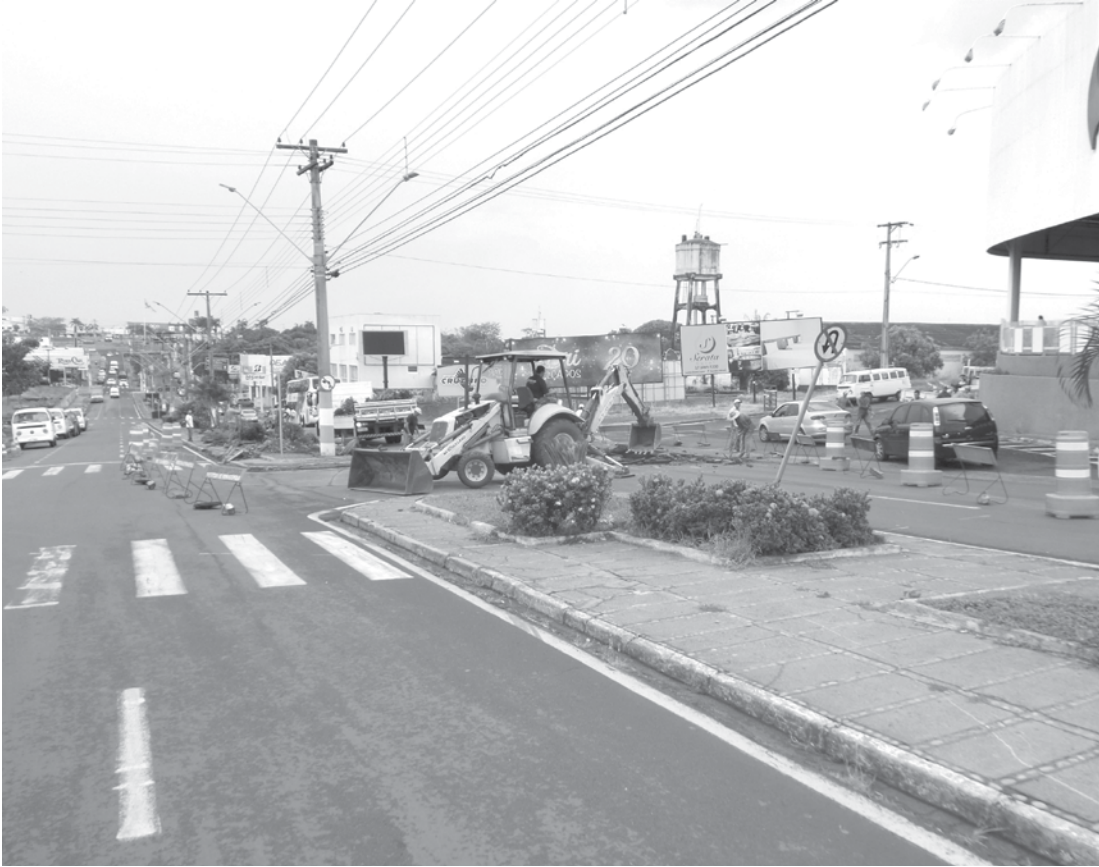
Serviços foram iniciados ontem pela Prefeitura

→ ASSESSORIA DE IMPRENSA Prefeitura de Fernandópolis A equipe da Secretaria de Infraestrutura deu início nesta quinta-feira (22), à construção de uma nova rotatória na Avenida Expedicionários, no cruzamento com a Rua Santa Catarina, no Bairro Santa Helena. A rotatória facilitará o trânsito na avenida, uma das principais da cidade. Segundo a prefeita Ana Bim, foram feitos estudos sobre a implantação. “Por ser uma das principais avenidas da cidade, o trânsito naturalmente é intenso, com o aumento de comércios naquela região, o fluxo será ainda maior e a rotatória trará mais segurança e agilidade”. A benfeitoria facilitará o acesso às empresas nas imediações, que em breve contará também com uma unidade de rede de drogarias e outra do McDonald’s.