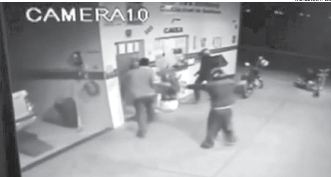
Câmeras flagram assalto a posto de combustíveis em Valentim Gentil