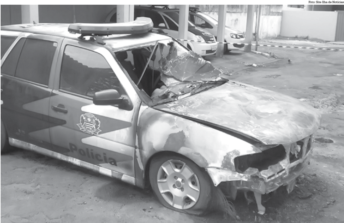
Viatura da Polícia ficou com a parte da frente destruída pelo fogo

acionados e isolaram a área para controlar as chamas. O local onde as viaturas ficam estacionadas é aberto, o que facilita o acesso de qualquer pessoa ao local. Ninguém se feriu. Até o fechamento desta edição, nenhum suspeito foi preso.