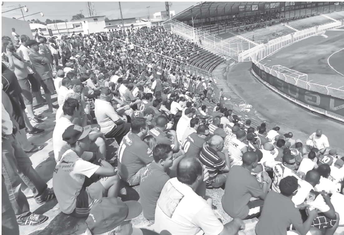
Com mais de 2.500 ingressos vendidos antecipadamente, expectativa de público é de mais de 7 mil pagantes

→ BRENO GUARNIERI contato@oextra.net A diretoria do Noroeste decidiu fazer uma promoção para a “decisão” contra o Fefecê, neste domingo (25), às 10h, no “Alfredão”, pela última rodada da fase final do Campeonato Paulista da Quarta Divisão. O clube de Bauru reduziu o valor dos ingressos para R$ 10. Os ingressos para a partida começaram a ser vendidos antecipadamente na terça-feira (20), em diversos pontos de Bauru. A venda antecipada segue até hoje. O duelo, que pode definir o retorno do Noroeste para Série A3, será disputado no mesmo horário de toda a rodada final da fase decisiva do Paulista. Em razão da importância do embate, as duas ligas de futebol amador da cidade, muito populares e que representariam uma importan-