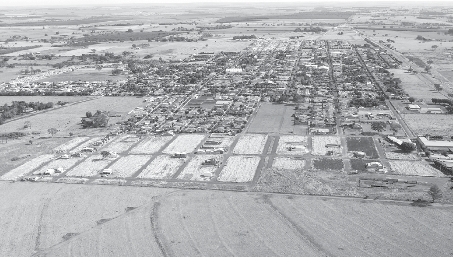
Ouroeste está entre as 10 cidades do interior paulista que foram destaques em loteamentos no primeiro semestre de 2015