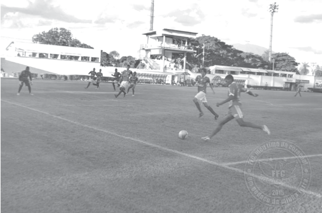
A última vez que esteve em Bauru, Fefecê empatou em 0 a 0 com o Noroeste

consolidar o acesso à Série A3, mas dependerá do resultado da partida entre Inter de Bebedouro e Lemeense, marcada para o mesmo dia e horário. A equipe de Bebedouro precisa vencer o time de Leme por 6 ou mais gols de diferença, caso Noroeste e Fefecê terminem empatados. Durante a semana, o treinador da Águia, Betão Alcântara, aproveitou os