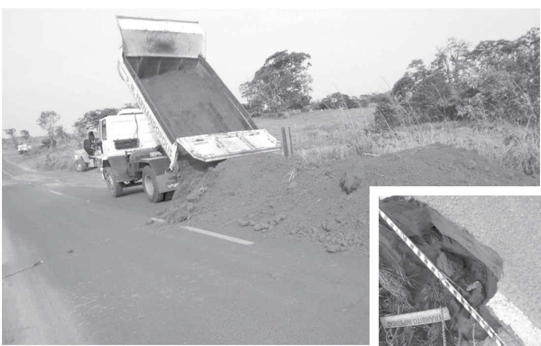
Áreas danificadas recebem serviços da Prefeitura de Fernandópolis