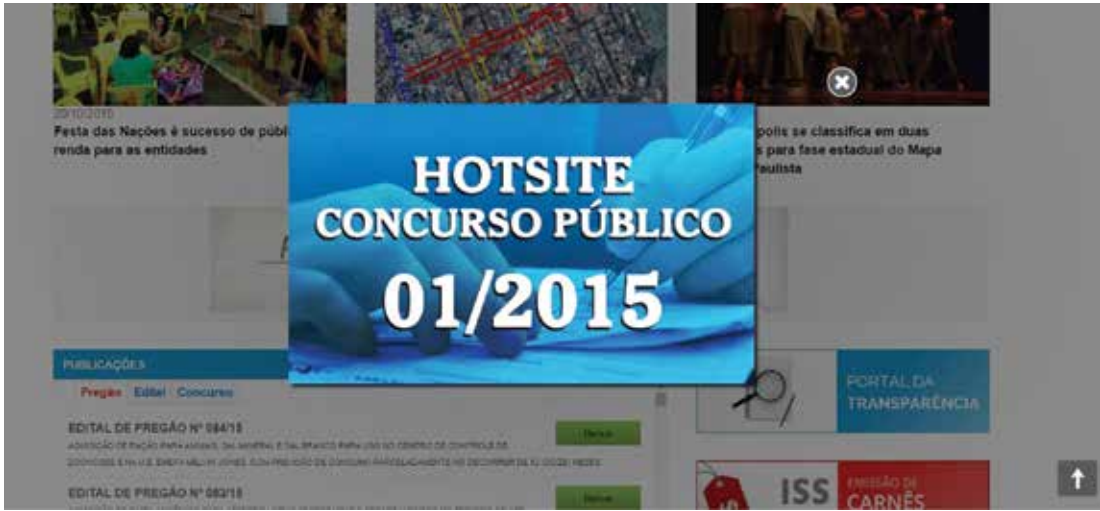
Reprodução do hotsite do concurso público no site oficial da Prefeitura de Fernandópolis

line’. A Prefeitura e o Instituto Brasileiro de Formação e Capacitação – IBFC, definiram a prorrogação do período de inscrições, que vai até as 23h59 deste domingo, dia 25 – os boletos gerados neste domingo poderão ser pagos até segunda-feira. As inscrições são efetuadas no site do IBFC – www.ibfc.org.br , sendo possível ter acesso a todas as informações sobre o certame através do hotsite da Prefeitura de Fernandópolis – www.fernandopolis.sp.gov.br/hotsite/concurso2015 . Os valores das inscrições são: R$ 36,08 para os cargos de Nível Fundamental; R$ 51,08 para os cargos de Nível Médio/Técnico; R$