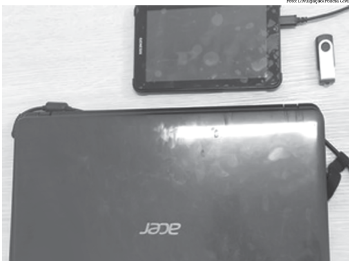
Polícia apreendeu um notebook e um tablet na casa da mulher

A investigação começou justamente com a prisão do suposto pedófilo de Campo Grande (MS). Nos celulares e computador apreendidos na casa dele, foram descobertas fotografias de meninas, enviadas pela mulher de 41