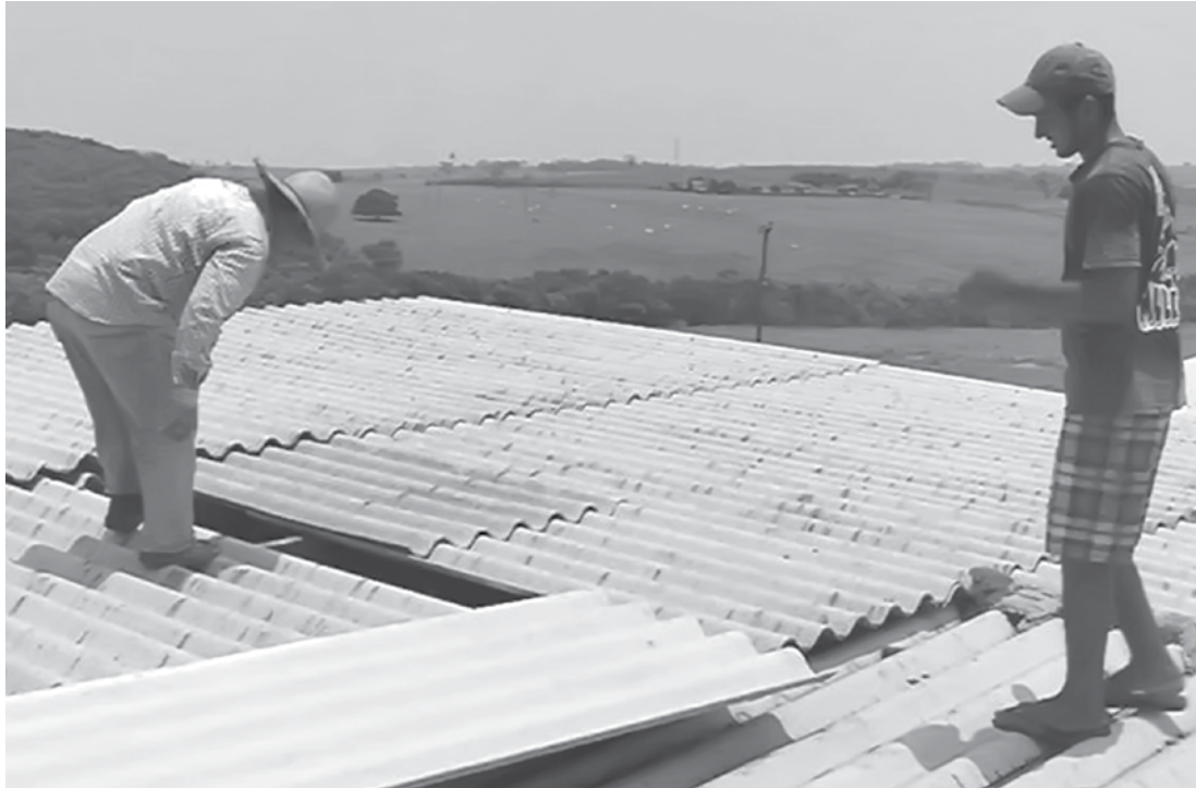
Moradores trocam telhas de casas atingidas durante temporal

Não existe estação meteorológica em Meridiano e não foi registrado oficialmente a velocidade dos ventos na cidade, mas os fortes ventos são comuns antes de fortes precipitações e conforme o instituto de meteorologia na região podem chegar aos 60 Km/h.