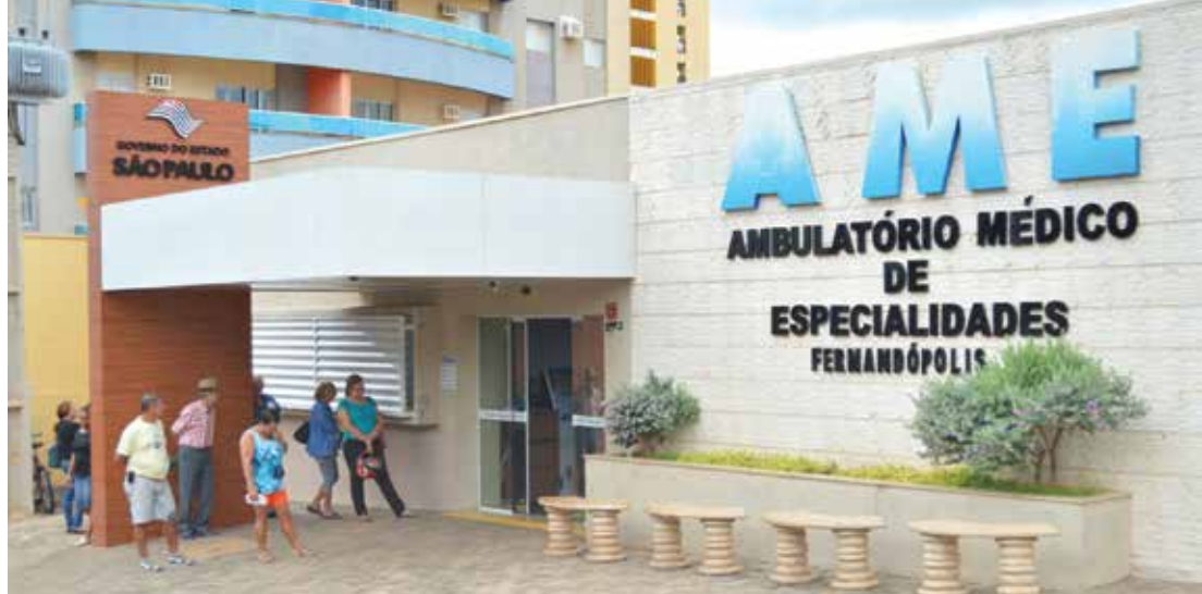
A Santa Casa permanecerá administrando o AME local, assim como o Centro de Reabilitação Lucy Montoro

O CONTRATO Para a renovação do contrato, a Secretaria da Saúde publicou uma convocação pública no Diário Oficial do Estado (DOE) para a apresentação de propostas pelas instituições que tivessem interesse em administrar o AME e o Lucy Montoro. Apenas duas entidades, dentre elas a Santa Casa de Fernandópolis, apresentaram propostas, constituídas de um plano operacional e financeiro, que foram analisadas pela equipe técnica do governo.