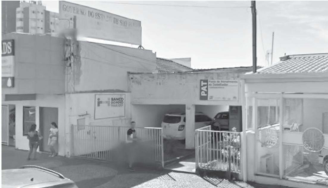
PAT, localizado na Expedicionários, nº 983, Centro de Fernandópolis

O Posto de Atendimento ao Trabalhador (PAT) de Fernandópolis, coordenado pela Secretaria Estadual do Emprego e Relações do Trabalho (SERT), está oferecendo uma vaga de emprego. O cargo é de auxiliar de limpeza. Os interessados devem levar o currículo e a carteira de trabalho na sede do PAT, amanhã, dia 29, às 10h. O PAT está localizado à Avenida Expedicionários Brasileiros, nº 983, no Centro da cidade. Mais informações pelo telefone (17) 3463-3019.