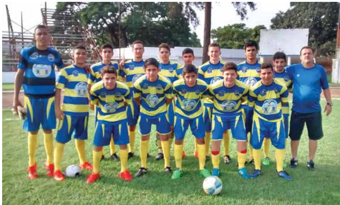
Equipe de São João das Duas Pontes na final da competição estadual

De acordo com a organização, a final regional ainda não foi marcada pelas Inspeções de Esportes de Fernandópolis e São José do Rio Preto, todavia a prefeita de São João das Duas Pon-