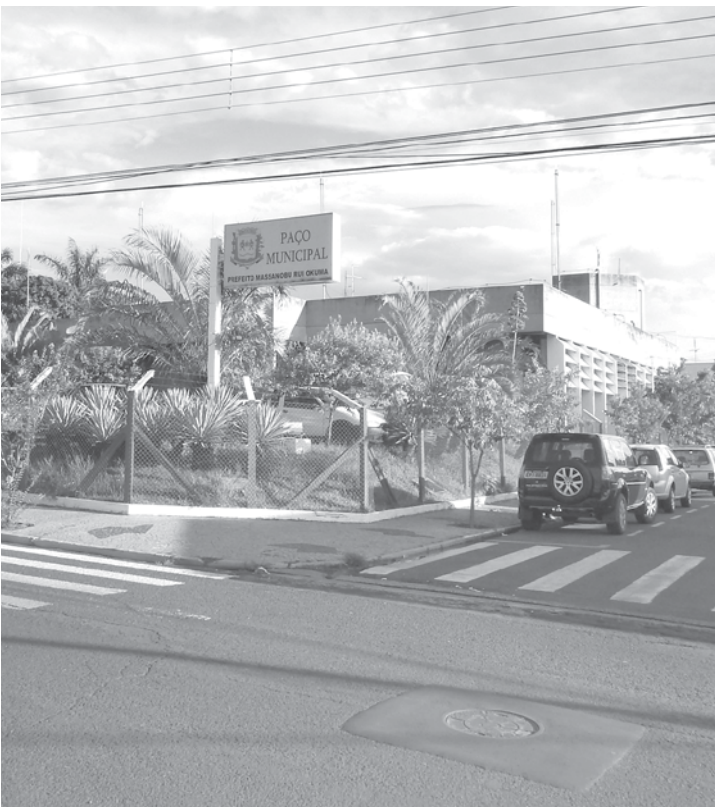
Paço Municipal, sede do Poder Executivo de Fernandópolis

inscrições, o número de candidatos aptos a realizar a prova, agendada para ser aplicada no dia 8 de novembro em Fernandópolis, saltou de 6.328 para 11.370. O número de cadastros preenchidos 'on line', uma vez que as inscrições foram efetuadas exclusivamente pela internet, chegou a 16.192.