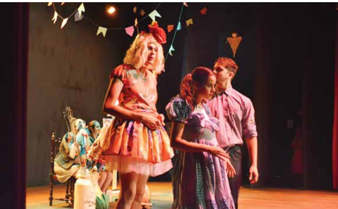
Cenas em registros especiais da Mostra Estudantil de Teatro