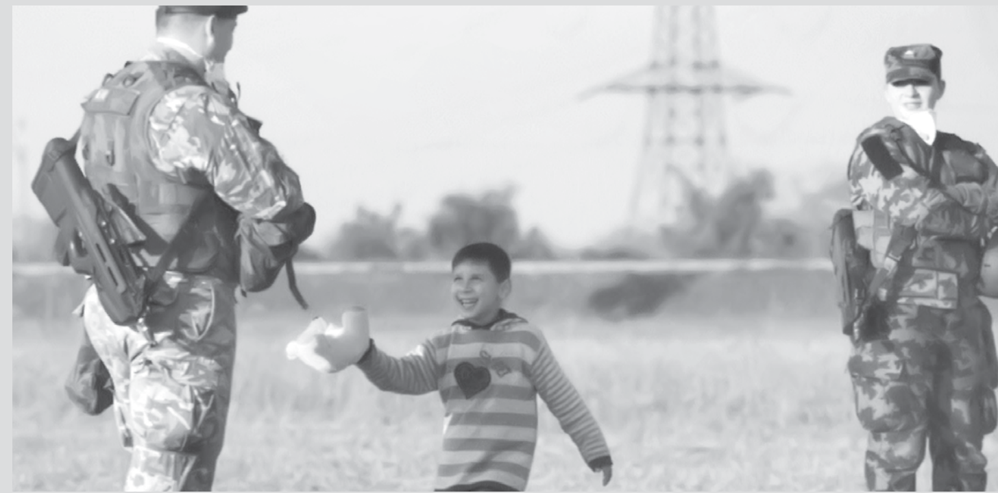
Menino refugiado oferece seu urso de pelúcia para um soldado que faz escolta em campo de refugiados na fronteira croato-eslovena perto de Rigonce, na Eslovênia.

mo quem fala e como quem ouve. É preciso estar aberto e preparado para falar, mas também para ouvir. Para dizer a verdade não é preciso ser agressivo. Por mais que algumas verdades possam machucar, uma verdade vale mais que mil mentiras. Diante de tudo isto, quem mente demonstra que valores como amizade, cumplicidade, integridade, ética, caráter e confiança, que são os verdadeiros alicerces das relações humanas, não são importantes e valiosos como deveriam ou poderiam ser. Vale pensar e refletir nas consequências antes de fazer algo que o levará a mentir. O ser humano precisa se livrar de vez da mentira, que nada sustenta e se firmar na verdade, que liberta. Em qualquer situação, a verdade, tanto de quem fala, quanto de quem ouve, só é adequada para quem está preparado para crescer. Espero e desejo que você esteja!