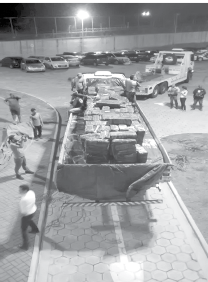
Após ser devidamente pesada e periciada, total da apreensão chegou a 9.016,200 quilos

abordaram o motorista, de 33 anos, que dirigia o automóvel, e o outro, de 49 anos, que conduzia o caminhão. Durante vistoria, os policiais rodoviários encontraram 2.981 tijolos do entorpecente no compartimento de cargas do caminhão. A equipe do TOR esclareceu que o suspeito que dirigia o VW receberia dinheiro para transportar a maconha de Guaíra (PR) a São Paulo. O motorista do carro seguia à frente para indicar o caminho, além de fazer o papel de “batedor”, ou