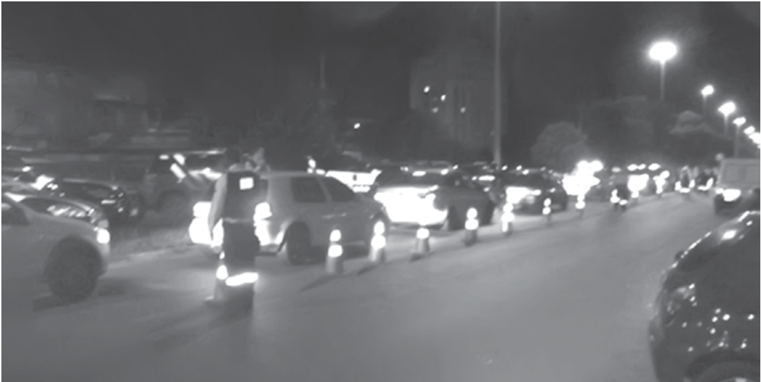
Blitze de fiscalização da Lei Seca foram realizadas entre a noite de quinta-feira e a madrugada desta sexta-feira (30); ao todo, 230 condutores foram submetidos ao teste do etilômetro

sé Amadeu, foram aplicados, ao todo, 230 testes do etilômetro (conhecidos por bafômetro). Do total, 10 condutores foram autuados por embriaguez ao volante e terão de pagar multa no valor de R$ 1.915,40 e responder a processo administra-