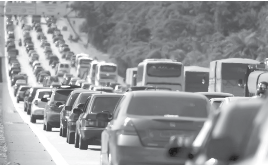
Na operação, serão empregados 944 viaturas, 108 motocicletas, 15 helicópteros Águia e uma média de 2.771 policiais militares