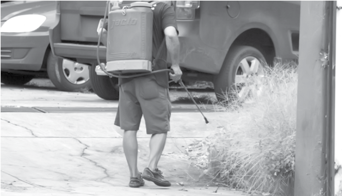
Membros da Vigilância Sanitária desenvolvendo ações de orientação na campanha

fica exposta, sendo os mais vulneráveis como as crianças, idosos, mulheres grávidas, e os doentes de vários tipos inclusive aqueles que podem ter seus problemas de saúde agravados, como os que já tem problemas respiratórios, como asmáticos, alérgicos e outros. Danos ao meio ambiente: Contaminação dos animais domésticos e outros, tais como: cães, gatos, cavalos, pássaros, e outros que podem se intoxicados, tanto pela ingestão de água con-