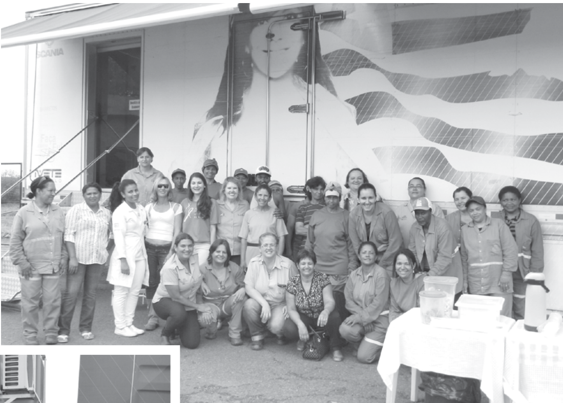
“Outubro Rosa” na Fazenda Santa Alice e Destilaria Alcoeste