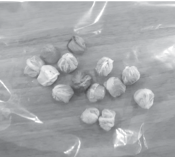
Na oportunidade, 14 porções de maconha foram apreendidas pela PM