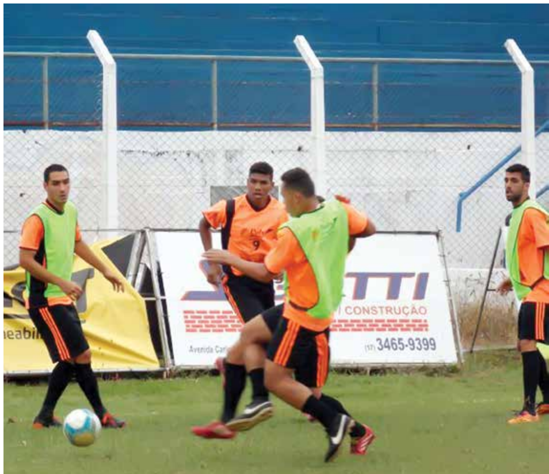
Jogadores do Fefecê durante treinamento no municipal, visando a preparação para a primeira partida da final