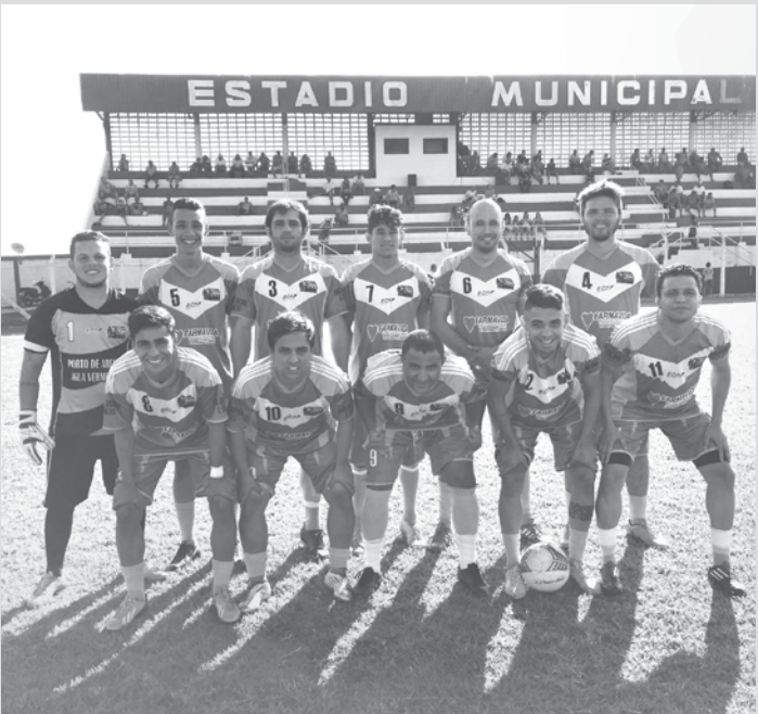
Na última rodada, a equipe de Arabá venceu Urânia nos pênaltis e se classificou para a próxima fase da competição

Neste domingo (1º), será realizada a segunda rodada. A partir das 15h enfrentam-se a equipe do “Bom Sucesso”, de Iturama/MG, e Palmeirinha, de Estrela D’Oeste. A partir das 17h, Limeira D’Oeste joga contra Santa Albertina.