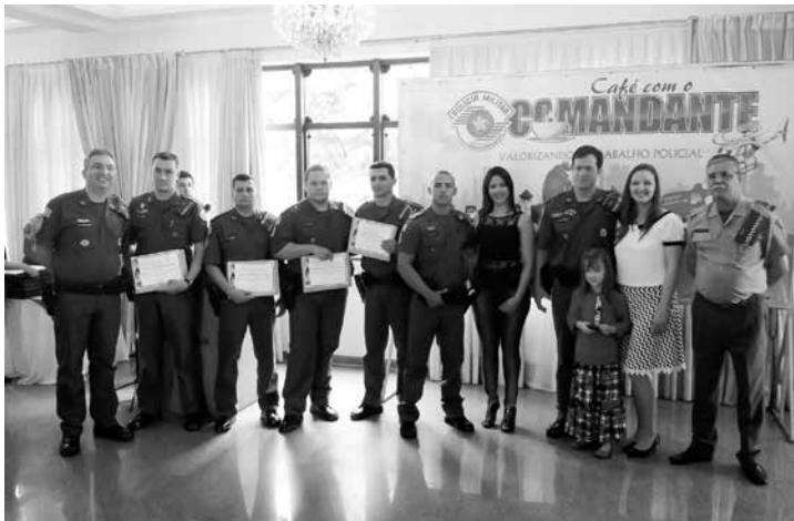
“O café com o comandante” prestigia policiais militares que se destacam nos serviços prestados a comunidade