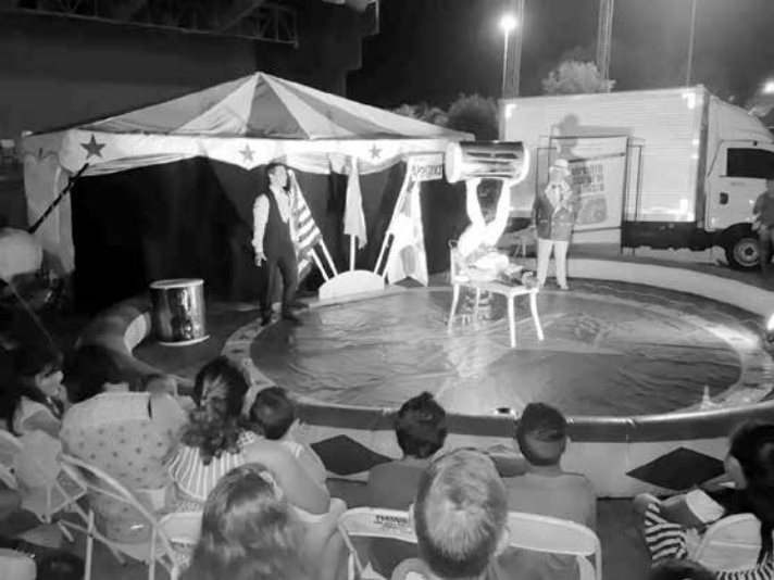
O espetáculo circense “Brasilidades no Picadeiro”, agradeu a todos

A execução é da Associação Paulista dos Amigos da Arte (APPA).