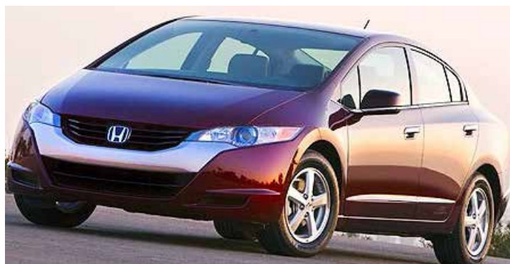
Honda Clarity: 700 km/litro e vendas a partir de março, inicialmente somente para grandes corporações e governos

ga a fazer 700 km/l e demora apenas três minutos para ser completamente abastecido. E não pensem que são modelos conceitos para serem produzidos daqui a vários anos. O Mirai inclusive já está à venda no Japão e chega a Europa em 2016. Seu preço, apesar da tecnologia embarcada, é de cerca de R$ 150 mil. O da Honda é mais caro e sai por R$ 246 mil. O Brasil nesta semana zerou o IPI para os híbridos (movidos a eletricidade ou hidrogênio) que tinham alíquota de 35%.