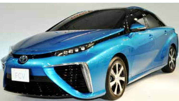
Toyota Mirai já está à venda no Japão e, no próximo ano, chega na Europa. Produção atual é de somente 300 unidade

Montadoras apresentam suas versões para veículos movidos por hidrogênio, o Clarity e o Mirai. Honda roda até 700 km sem reabastecer