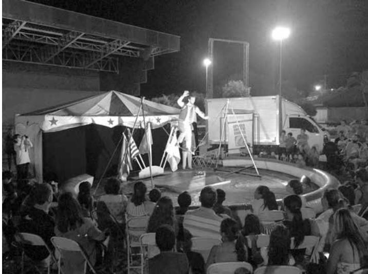
A atração do Circuito Cultural Paulista atrai um grande público à Praça de Eventos