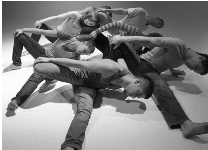
O espetáculo de dança contemporânea “CIDADE” com a Cia de Dança Omstrab, será apresentada na E.E. Professor Sansara Singh