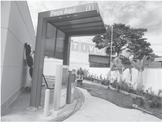
Reportagem de "O Extra.net" registrou na manhã de ontem os serviços de acabamento no McDonald's e a inspeção dos Bombeiros no local