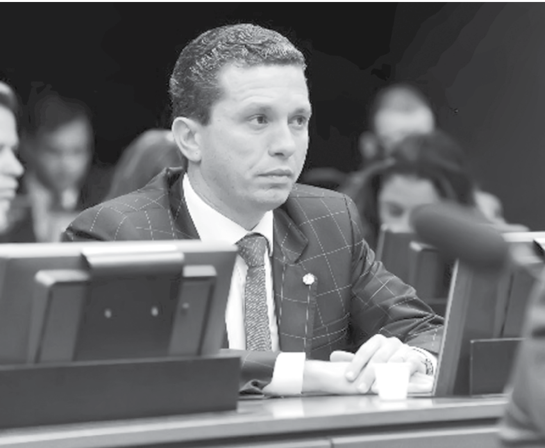
Político fernandopolense, Fausto Pinato adiantou que deve aceitar denúncia que pode cassar Eduardo Cunha