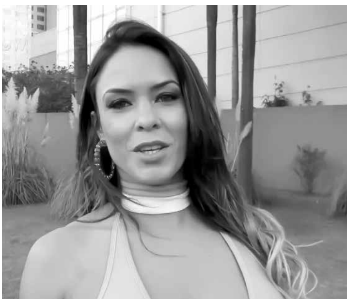
Dançarina morta buscava maior reconhecimento e causou ciúmes no namorado