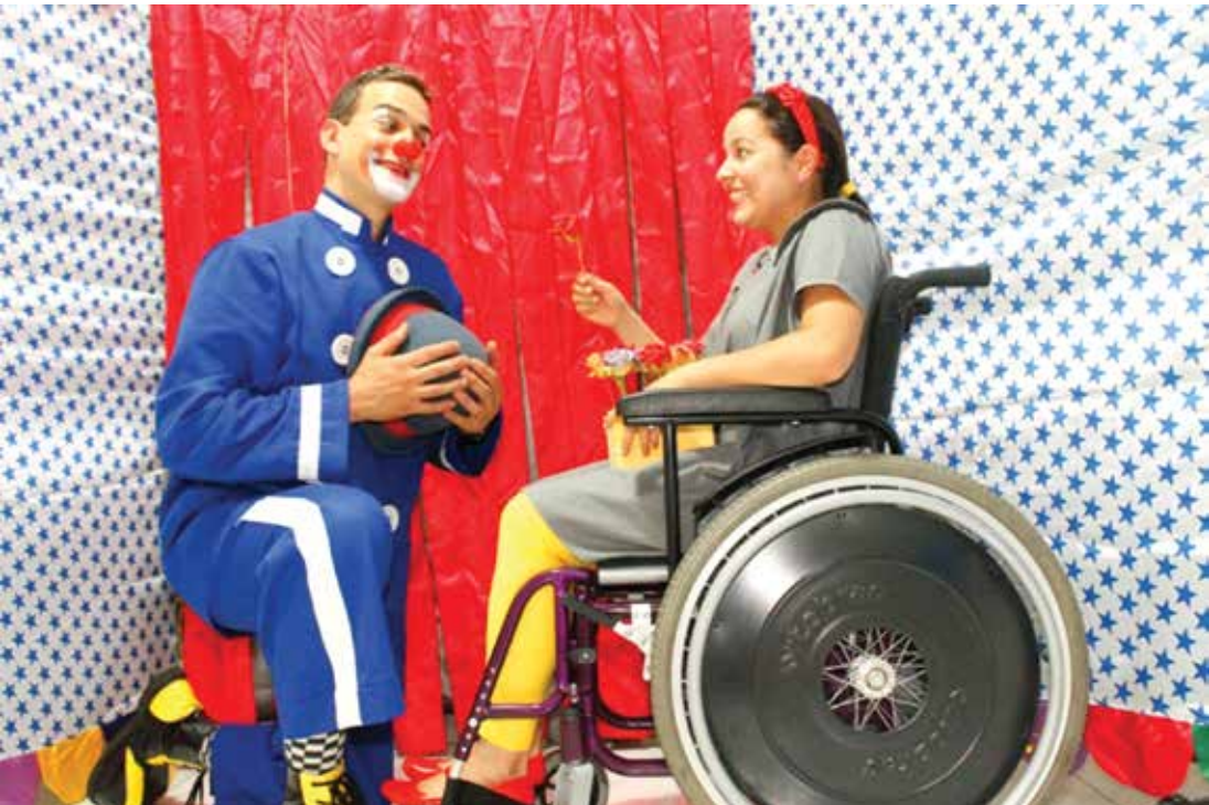
Na peça, menina cadeirante descobre inúmeras possibilidades de interagir com as pessoas

→ ASSESSORIA DE IMPRENSA Prefeitura de Fernandópolis O Merciol Viscardi recebe neste sábado, dia 14, a Cia Adaptada de Teatro, de São Paulo, com a peça “O Palhaço e a Menina de Rodas”. Os ingressos estão sendo vendidos ao preço popular de R$5,00. Serão três apresentações: 11h, 15h e 18h. A peça conta a história de uma menina cadeirante que vende flores pra ajudar em casa, e traz a grande tristeza de não se sentir incluída nas brincadeiras das crianças de sua idade. Ao encontrar um palhaço na entrada do circo descobre as inúmeras possibilidades de inte-