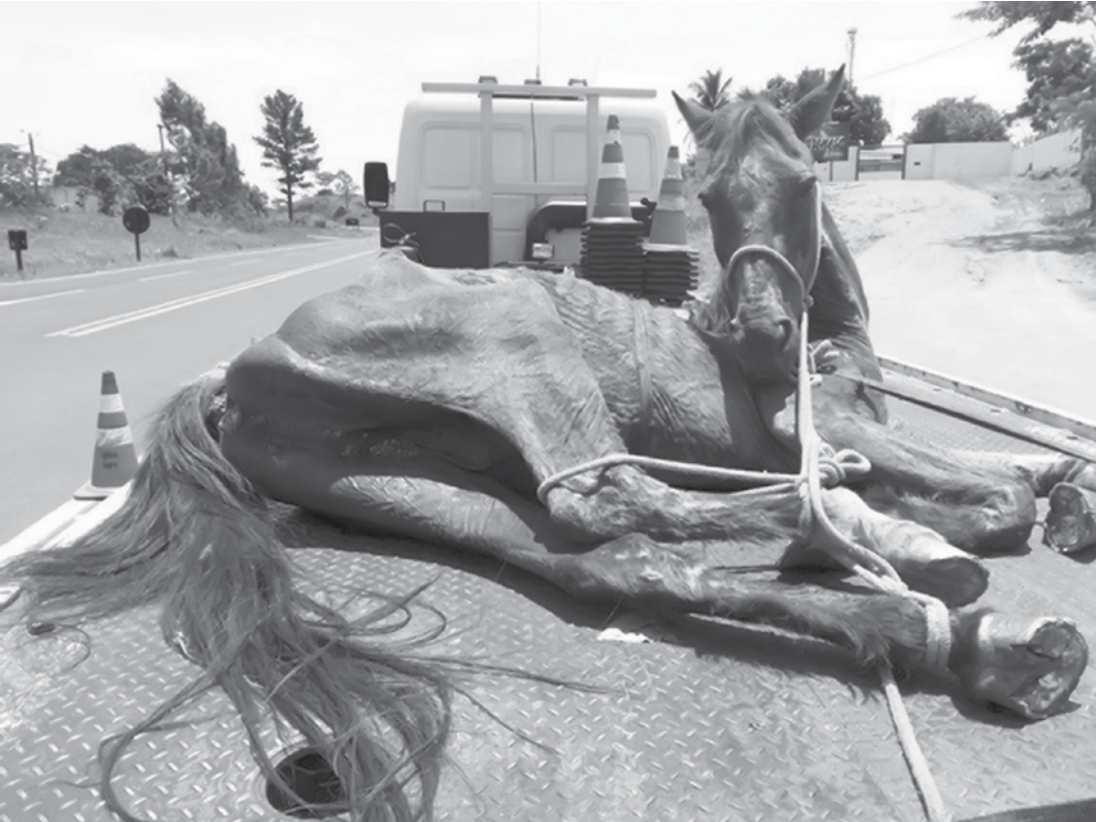
Cavalo precisou ser retirado do acostamento com a ajuda de um guincho