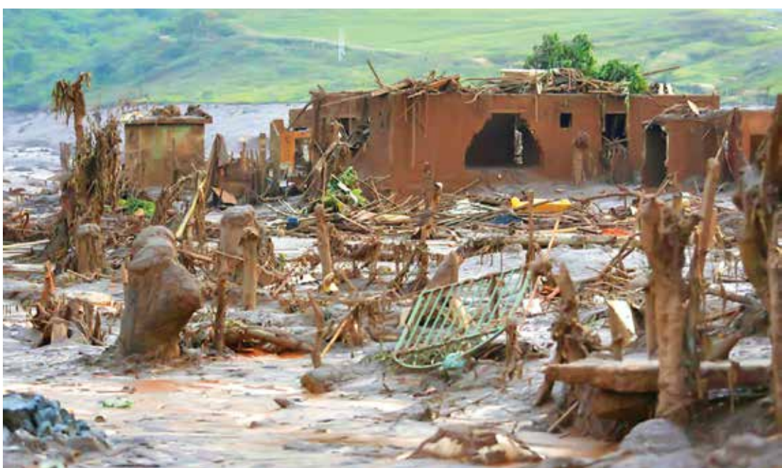
Imagem chocante do mar de lama que invadiu cidades após rompimento de barragem

O rompimento de duas barragens de rejeitos da mineradora Samarco causou uma