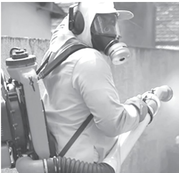
Secretaria da Saúde, intensificando as ações de Combate à Dengue nas residências