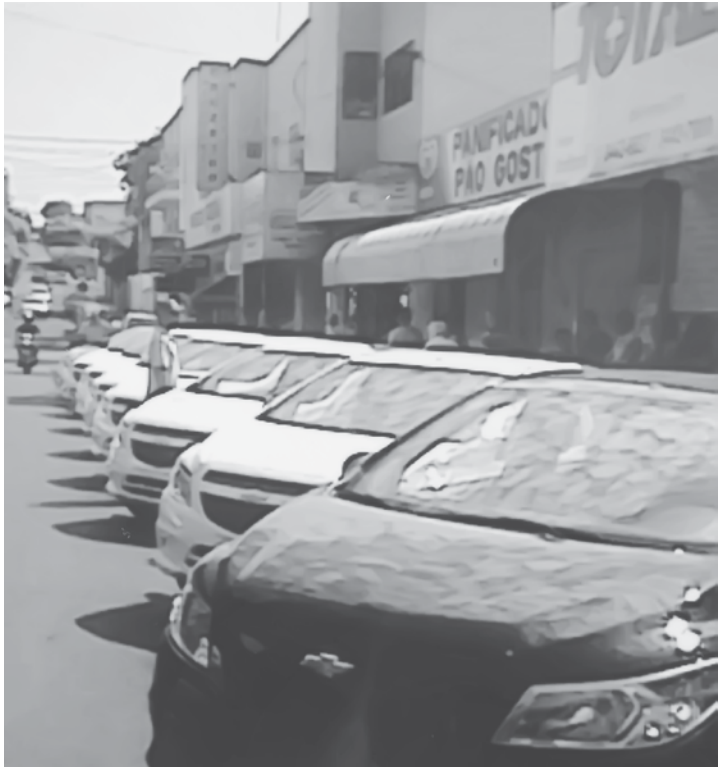
Carros estacionados perfilados na AV. 02, em Fernandópolis