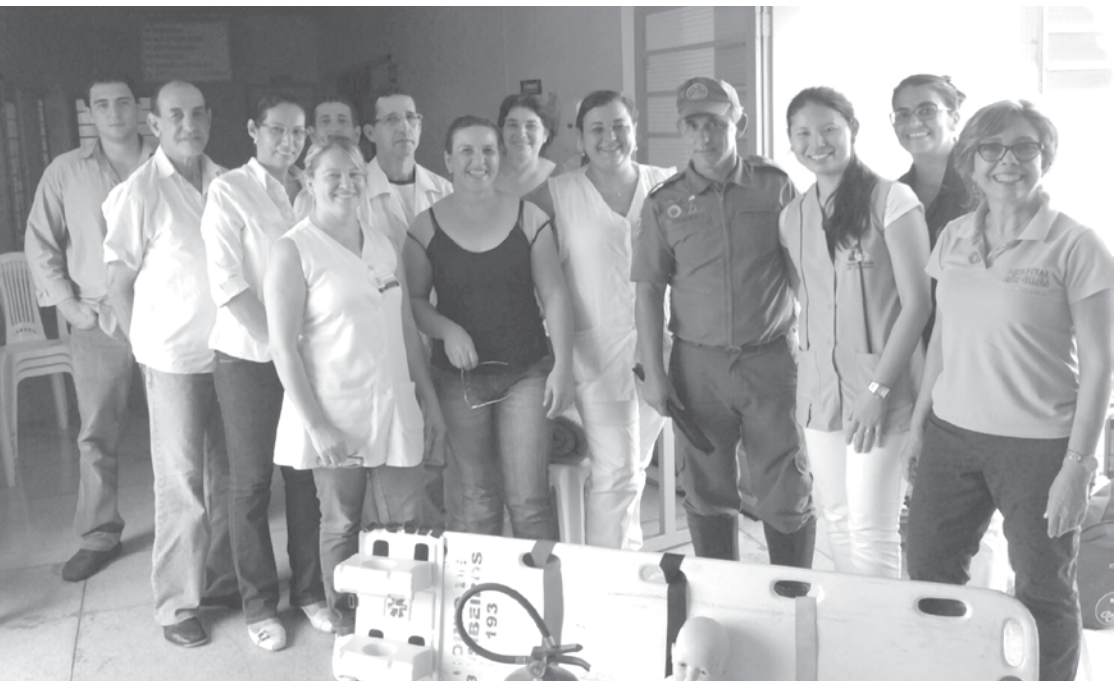
Cerca de 23 profissionais que atuam no Hospital João Veloso em Ouroeste, receberam um treinamento sobre urgência e emergência