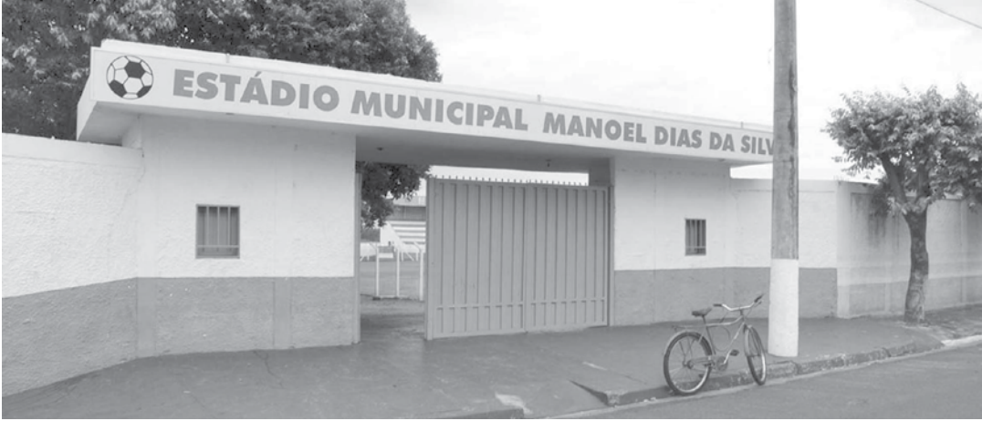
Estádio “Manoel Dias da Silva”, em Ouroeste, onde acontecem as partidas do campeonato aos finais de semana