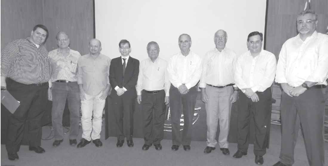
Interventores da FEF, colaboradores, MP e Sindicato, coordenador pedagógico e novo administrador juntos