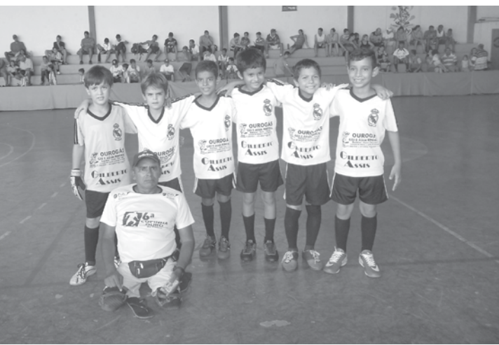
Das cinco categorias, Ouroeste empatou em uma, perdeu duas e ganhou em outras duas

nador “Bagi” contou com o apoio e incentivo da Prefeitura de Ouroeste, mediante à Secretaria de Esporte, Lazer e Turismo.