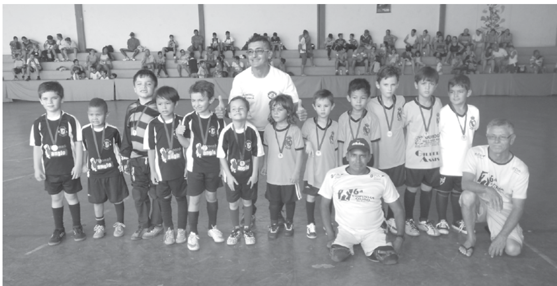
Atletas da escolinha de futebol na categoria de 5 a 6 anos de idade, que estreou com empate jogando contra Votuporanga

A referida Copa é organizada pela Prefeitura de Votuporanga, por meio da