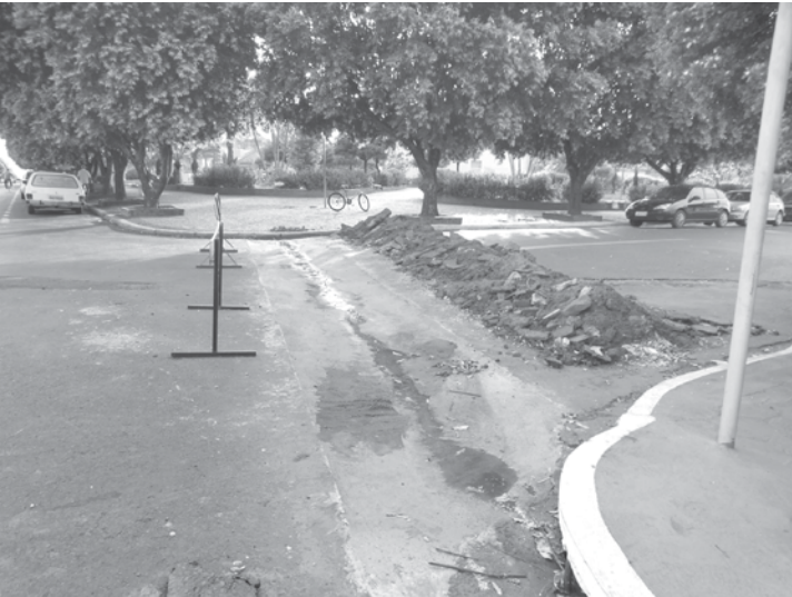
Os sarjetões substituem os locais com “depressão” existentes em esquinas para escoamento de águas pluviais

A cidade de Ouroeste vem ganhando cada vez mais obras e melhorias e já é possível notar a revitalização da cidade. A administração concluiu essa semana uma nova etapa de obras que inclui a construção de três sarjetões, sendo dois na Rua Fernão Dias Paes Lemes e um no Conjunto Habitacional Celestino Carnielo . Os sarjetões foram construídos para substituir as valetas, ou seja, locais com “depressão” existentes em esquinas para escoamento de águas