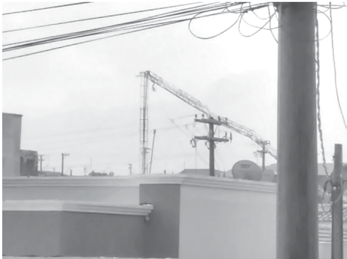
Torre caiu sobre uma residência em Valentim Gentil: ninguém ficou ferido