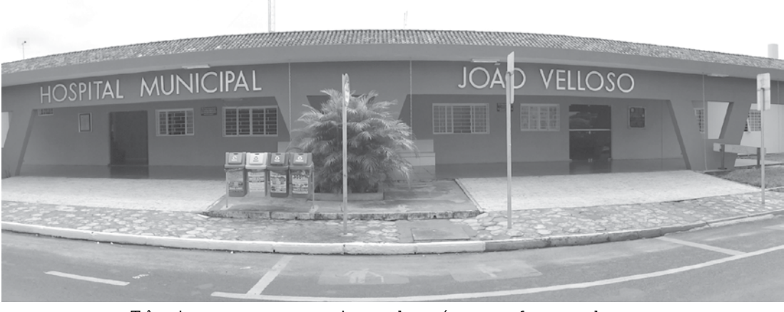
Três crianças permaneceram internadas após uma professora e alunos, com idade entre 2 e 5 anos, passarem mal durante a semana