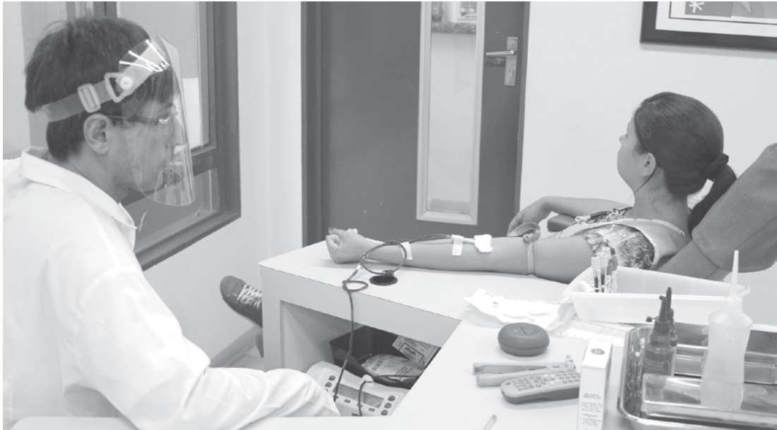
Por mês, o Hemocentro de Fernandópolis tem a demanda de 900 a 1000 bolsas de sangue