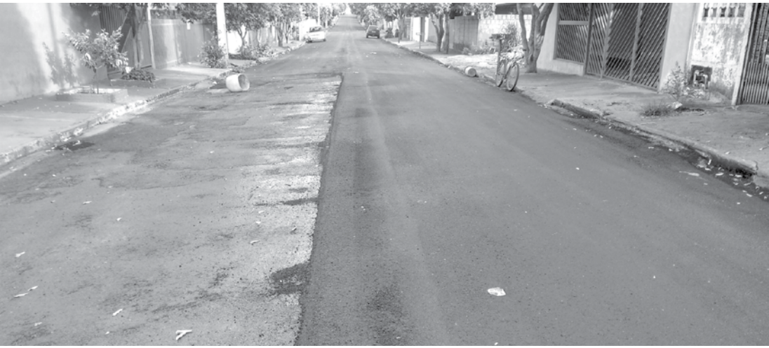
De acordo com o cronograma de repasses, a Prefeitura havia realizado uma etapa dos serviços no local