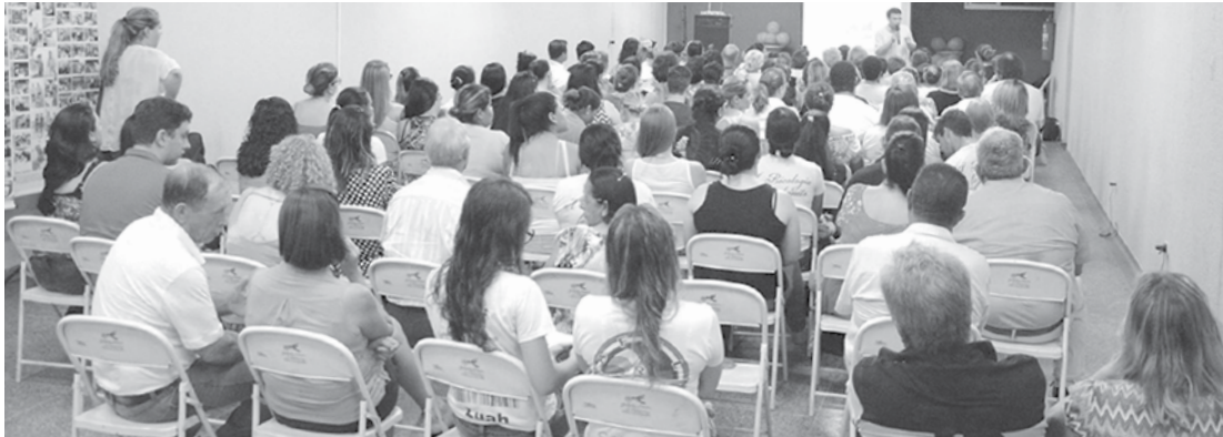
Os cursos de Psicologia e Serviço Social da Fundação estão engajados no projeto