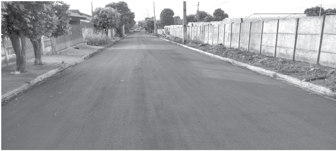
Somente no último dia 13 a Prefeitura recebeu mais 50% dos recursos oriundos do convênio para dar continuidade às obras

→ Da REDAÇÃO contato@oextra.net A Prefeitura de Ouroeste está concluindo mais uma etapa de