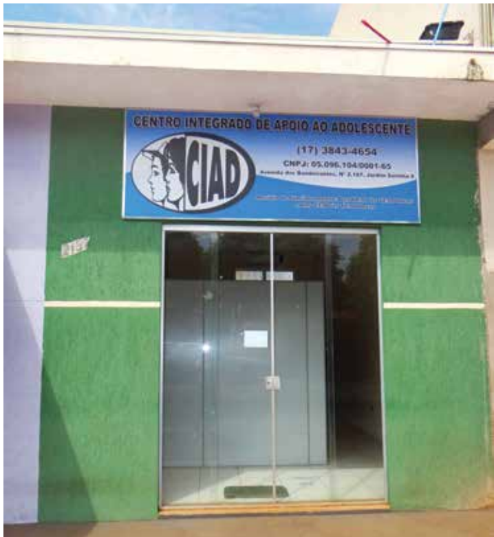
Tanto o Executivo quanto o Legislativo garantem recursos ao CIAD