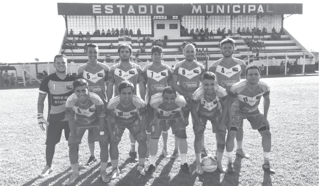
Equipe de Arabá, que venceu nos pênaltis na última rodada e joga o segundo jogo deste domingo

em dois grupos de quatro times cada, que se enfrentarão no formato de quadrangular. As equipes se enfrentarão dentro da própria chave, no sistema de turno e retorno. Ao final da sexta rodada, os líderes de cada grupo serão promovidos e disputarão a final.