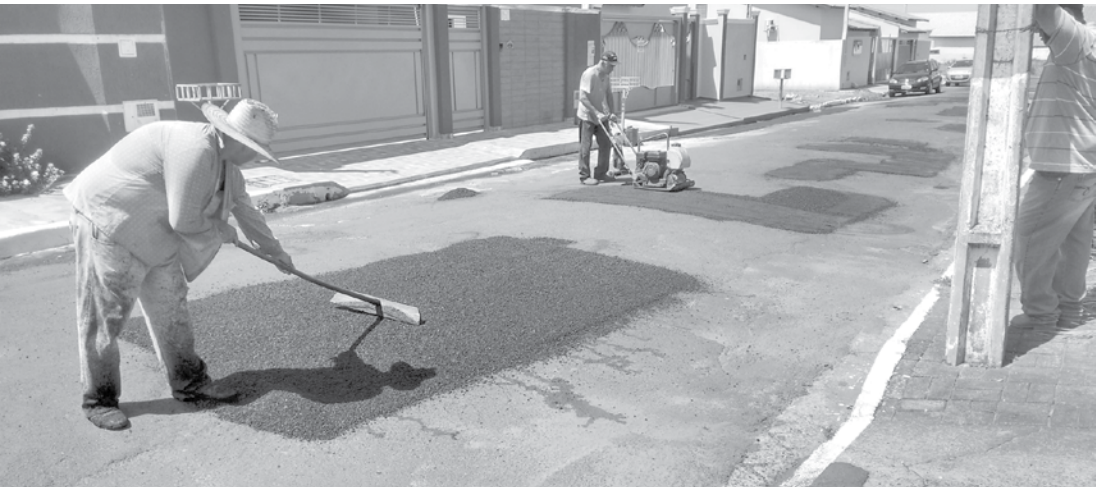
As obras de recuperação asfáltica vêm proporcionando melhorias no Jardim Sarinha I e Jardim Sarinha II