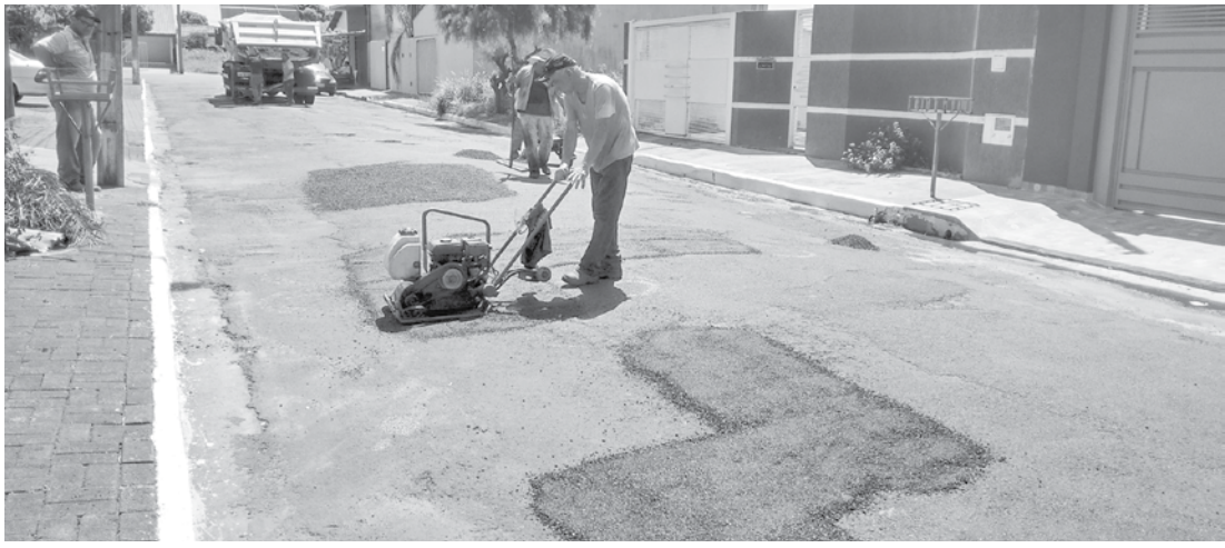
A iniciativa, além de mudar o aspecto visual da cidade, garante aos motoristas e pedestres mais segurança e comodidade

→ Da REDAÇÃO contato@oextra.net A Prefeitura de Ouroeste iniciou na semana passada uma nova etapa da operação