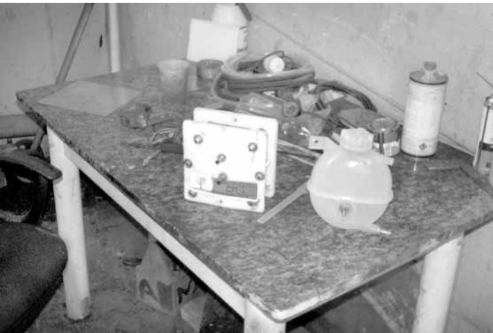
Parte do gerador artesanal desmontado criado pelo mecânico em sua oficina

Extra: Qual a manutenção necessária neste tipo de sistema? Qual o custo do investimento?