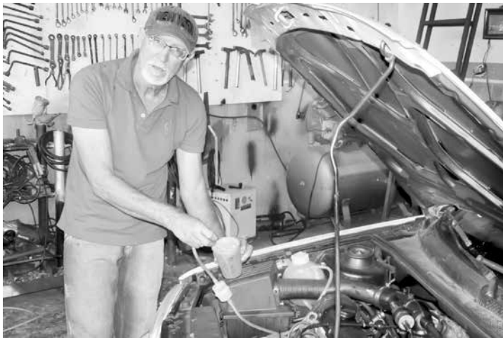
“Carroça” faz exibição do funcionamento retirando hidrogênio do próprio carro e misturando a um copo com água...

ceio no sentido de afrontar alguém com o seu invento?