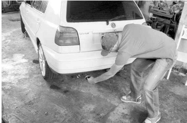
... e por fim, além da economia, o mais importante, o resíduo da queima do hidrogênio é água, o que mantém o escapamento limpo e não polui