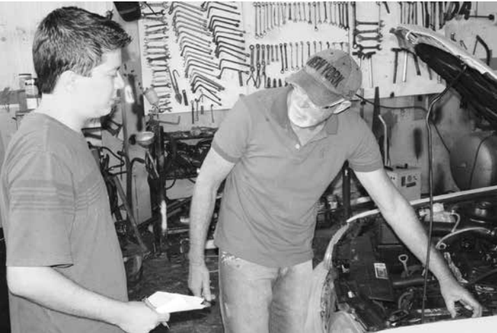
“Carroça” explica que seu carro já rodou 20 mil km com o equipamento instalado e mesmo sendo motor 1.8 é possível fazer economia de 80%

Nota da redação: Para os leitores intusiasmados com essa reportagem vai um recado. Este produto não é produzido em série. Existe uma padronização, mas não há a pronta-entrega, apenas sob encomenda.