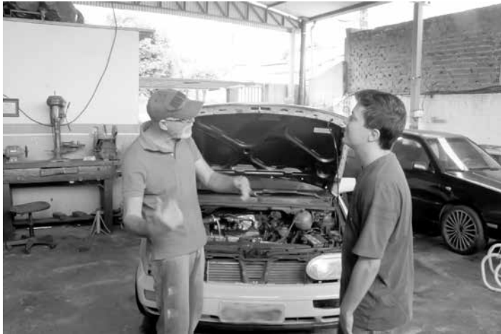
Ele lembra que um cliente de Iturama-MG ficou encantado e como queria levar o invento na hora, ele retirou do carro da esposa para servi-lo...