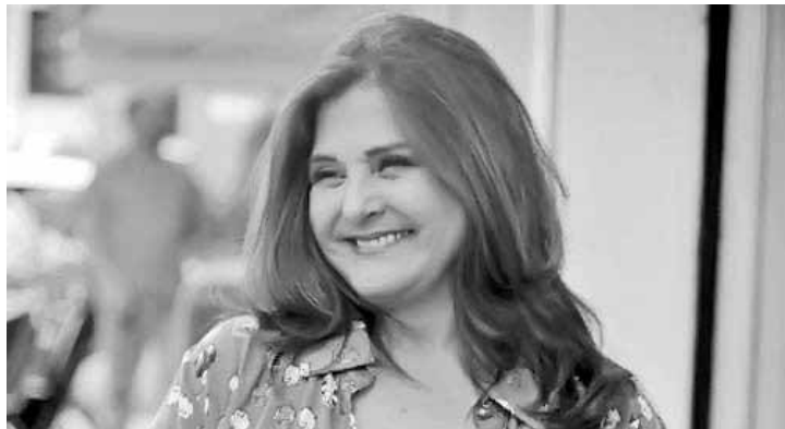
Atriz se prepara para novela da Record

Após quase 30 novelas e cinco décadas na Globo, Elizângela se prepara para mudar para a Record. Dada como certa no elenco de “A Terra Prometida”, da emissora da Barra Funda, a artista optou por deixar o canal carioca por falta de trabalho. “Não dá para ficar esperando um papel cair do céu”, reclamou ao “Notícias da TV”. A ex-global, contudo, fez questão de frisar que ainda não assinou contrato com a empresa de Edir Macedo. “Está bem adiantado. Nunca trabalhei na Record. É tudo novo para mim”, explicou. A trama - continuação “Os Dez Mandamentos” tem estreia prevista para meados de 2016. Nela, Elizângela da-