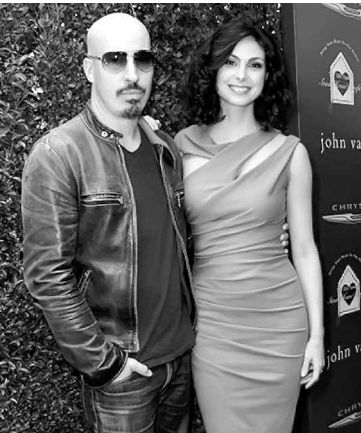
Atriz e o ex, beneficiado com a pensão