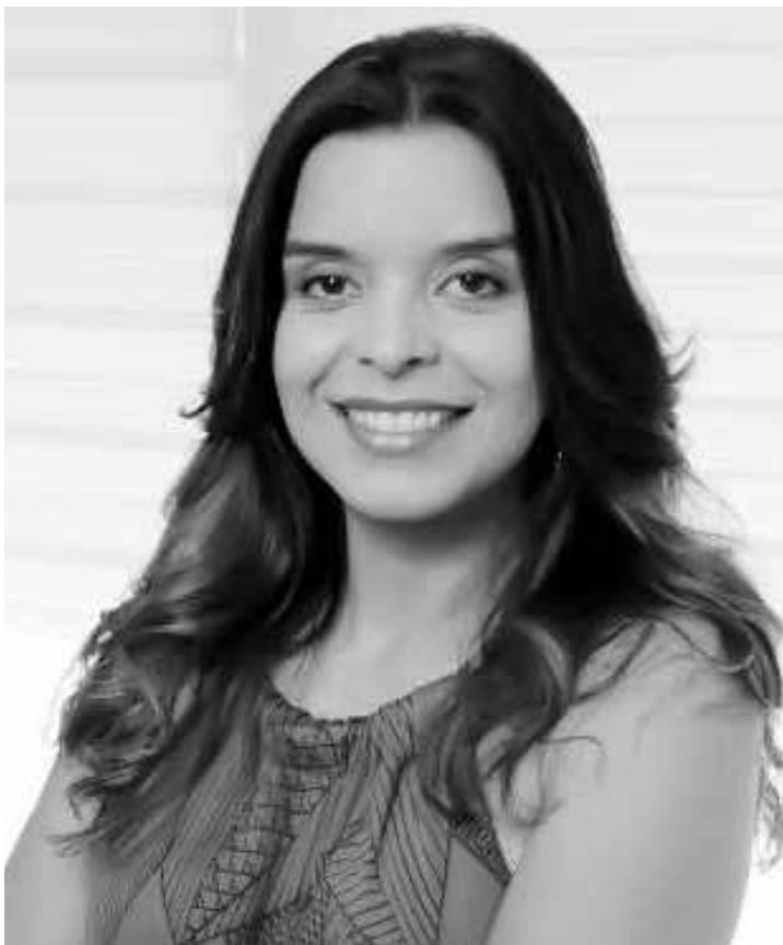
Projeto bíblico da Record terá uma segunda temporada em 2016

as ideias são suadas, também, você precisa trabalhar em cima delas. Elas não surgem do nada”, declarou. A escritora, inclusive, disse que não tem receio que o público se sature com as histórias da Bíblia: “Acho que há uma expectativa. As pessoas gostam muito da história, de visualizar como as situações [da Bíblia] aconteceram”.