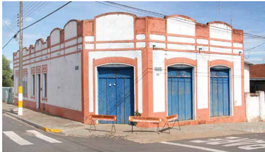
As inscrições podem ser feitas até o dia 30 de novembro, pelo site www.sisemsp.org.br

lificação e o fortalecimento institucional em favor da preservação, pesquisa e difusão do acervo museológico paulista. Em mapeamento realizado em 2010, foram listadas 415 instituições museológicas, públicas e privadas, em 190 municípios paulistas. O SISEM-SP se estrutura em torno das premissas de parceria e responsabilidade compartilhada, em que as ações previstas para cada região são concebidas levando-se em conta o contexto, as demandas e as potencialidades locais. É coordenado pela Unidade de Preservação do Patrimônio Museológico da Secretaria da Cultura do Estado de São Paulo (UPPM/SEC), tendo como instância organizacional o Grupo Técnico de Coordenação do Sistema Estadual de Museus (GTC SISEM-SP). Para saber mais acesse: www.sisemsp.org.br