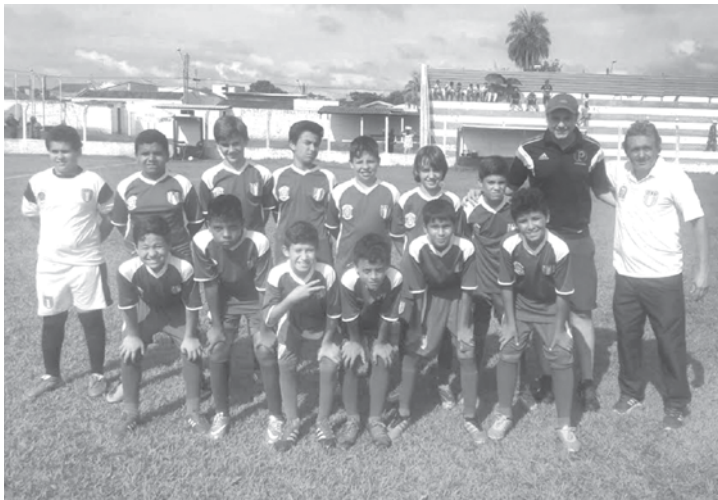
Equipe Sub-12 da Escolinha Municipal de Futebol de Valentim Gentil