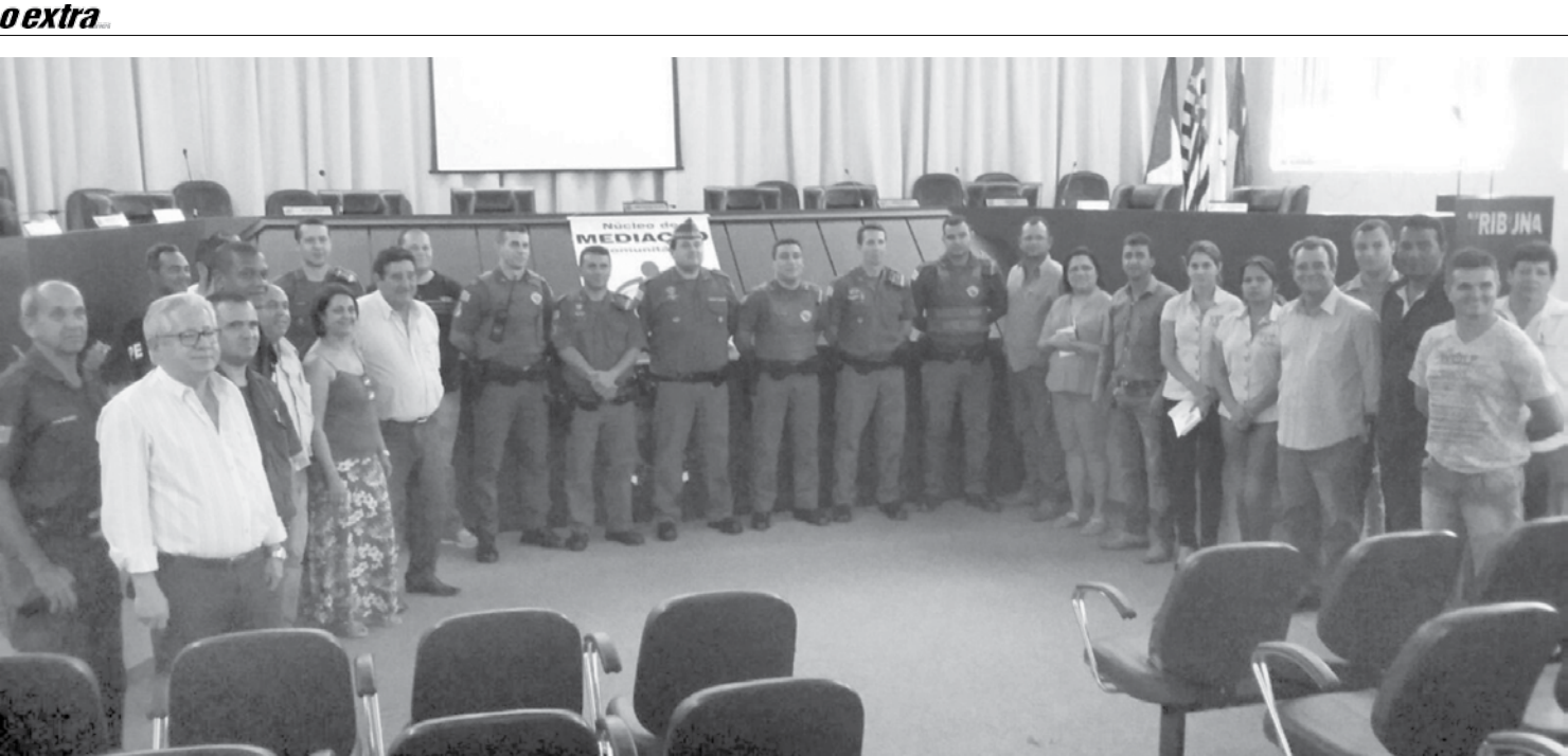
A Audiência Pública da Polícia Militar visa discutir os problemas de segurança da comunidade