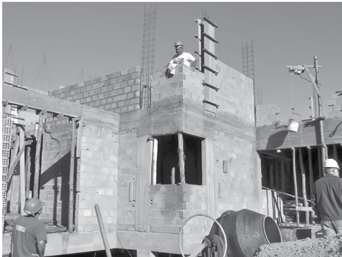
Nível registrado no mês passado é o menor nível da série histórica

O nível registrado no mês passado é o menor nível da