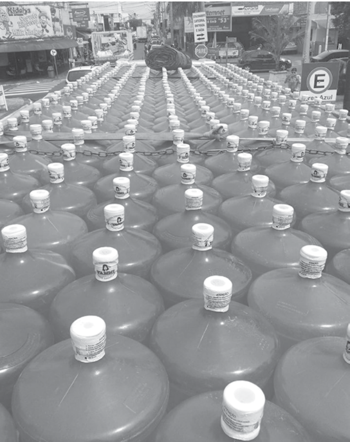
Jales arrecadou 55 litros de água mineral para as vítimas de Mariana

Moradores de Jales organizaram doações; população de cidade mineira sofre por falta de abastecimento após tragédia ambiental