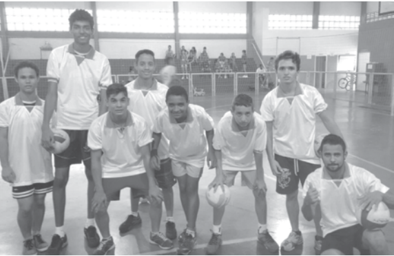
Equipe masculina de Arabá que conquistou o 3º lugar no Fest Vôlei