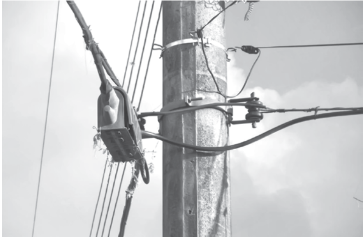
Chuva, que caiu no início da semana, seria responsável pela interrupção dos serviços

região do município procu-raram “O Extra.net” para re-latar prejuízos. A operadora responsá-vel por administrar a linha, a Vivo Telefônica informou que não há previsão para o serviço ser restabelecido. A empresa ainda informou que ontem uma equipe de cabis-tas foi até o bairro iniciar a segunda fase de reparação e que o número de cabos da-nificados interfere na velo-cidade do restabelecimento do serviço.