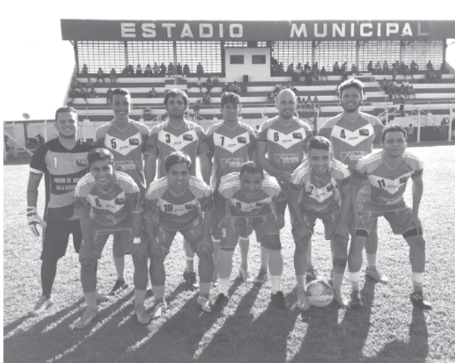
Equipe de Arabá já soma duas vitórias no campeonato