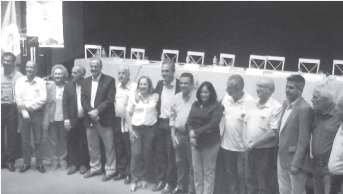
Ao todo, trinta e oito prefeitos compareceram ao evento realizado pela Associação Paulista dos Municípios (APM), em São Carlos, nesta semana