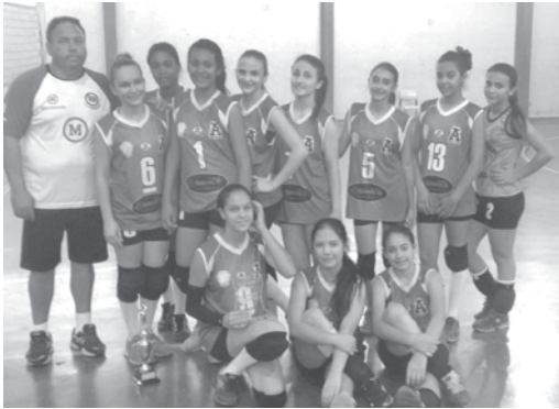
Equipe feminina de Urânia ficou também em segundo lugar no Fest Vôlei