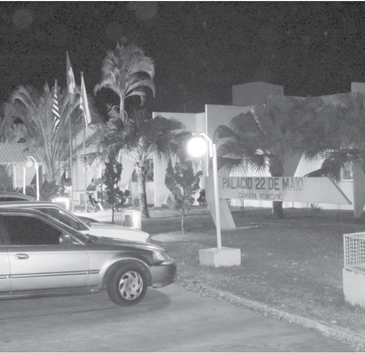
Câmara Municipal vive momentos de “indefinições”