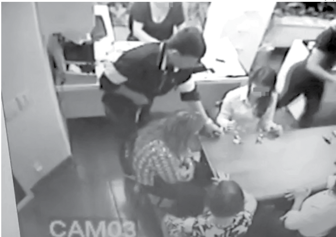
No momento da ação, ladrão não se preocupou em esconder o rosto

Toda a ação foi gravada pelo sistema de segurança do local e entregue para a Polícia, que já investiga o caso e tenta agora localizar o suspeito, que não se preocupou em esconder o rosto.