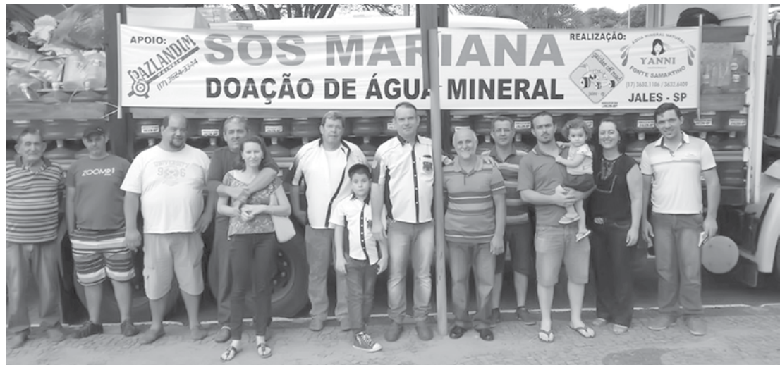
Momento da partida dos veículos para a cidade mineira

A Prefeitura de Mariana chegou a suspender o recebimento de doativos no domingo (15), em razão da grande demanda, mas ainda há necessidade de água potável.