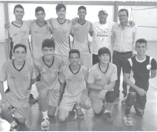
Equipe masculina de Populina sagrou-se campeã do 1º Fest Vôlei de Arabá