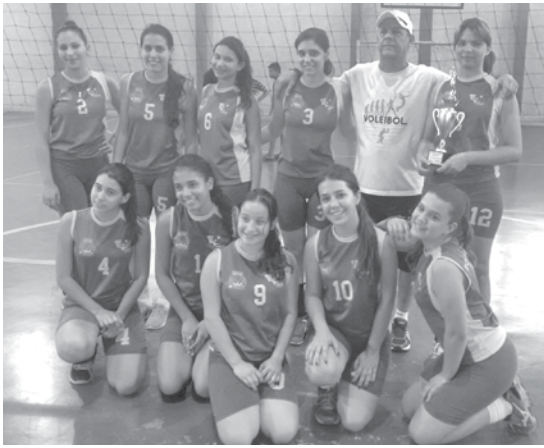
Equipe feminina de Populina também conquistou o 1º lugar na competição