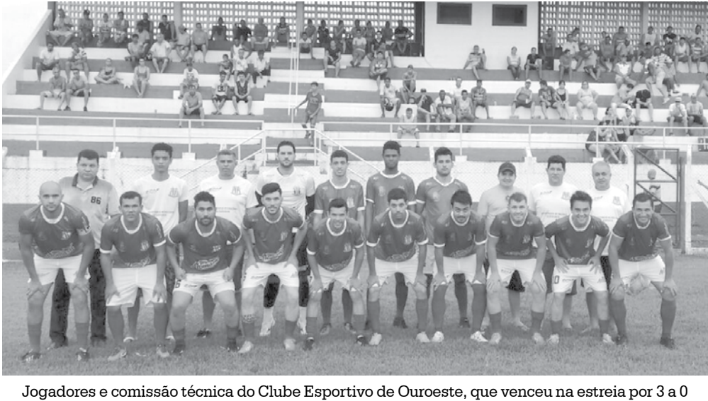
Jogadores e comissão técnica do Clube Esportivo de Ouroeste, que venceu na estreia por 3 a 0

→ Da REDAÇÃO contato@oextra.net O Clube Esportivo de Ouroeste estreou com vitória de 3 a 0 sobre a equipe de São Francisco no último domingo (22) no 3º Campeonato Intermunicipal de Futebol Amador que vem sendo realizado no Estádio Municipal “Manoel Dias da Silva” em Ouroeste. Outra equipe do município, Arabá Esporte Clube também venceu o time de Limeira d'Oeste por 3 a 1 e segue invicta no campeonato. A próxima rodada acontece amanhã, dia 29, a partir das 13h30, ocasião em que vão se enfrentar Dolcinópolis x Baratão de Iturama. A partir das 17h horas jogam Clube Esportivo de Ouroeste x Bom Sucesso de Iturama.