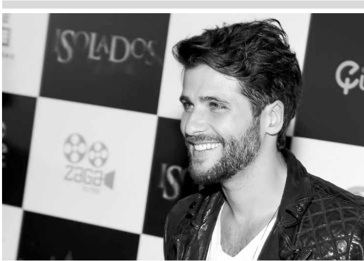
Beijo entre atores vira assunto da internet e Gagliasso defende sua postura

tribuídos em 1,74m de altura. E a disciplina da mulher de Belo vem servindo de inspiração. Em seu perfil no Instagram, a morena já conta com mais de 2,3 milhões de seguidores. No facebook, esse número ultrapassa os quatro milhões com fãs em Portugal, México, Estados Unidos, Canadá, Itália, Espanha, Reino Unido e Alemanha. Em seus perfis ela dá dicas de treino e alimentação, mas afirma que nunca recebeu críticas de nenhum grupo de profissionais da área de saúde, o que frequentemente acontece com outras blogueiras fitness. “Tenho uma equipe qualificada e competente que me acompanham e todos sabem disso. Nutricionista, preparador, médicos, fisioterapeuta... cada um cumprindo seu devido papel com todo critério necessário. Minhas dicas são orientadas por profissionais capacitados em suas áreas”, afirma Gracyanne Barbosa.