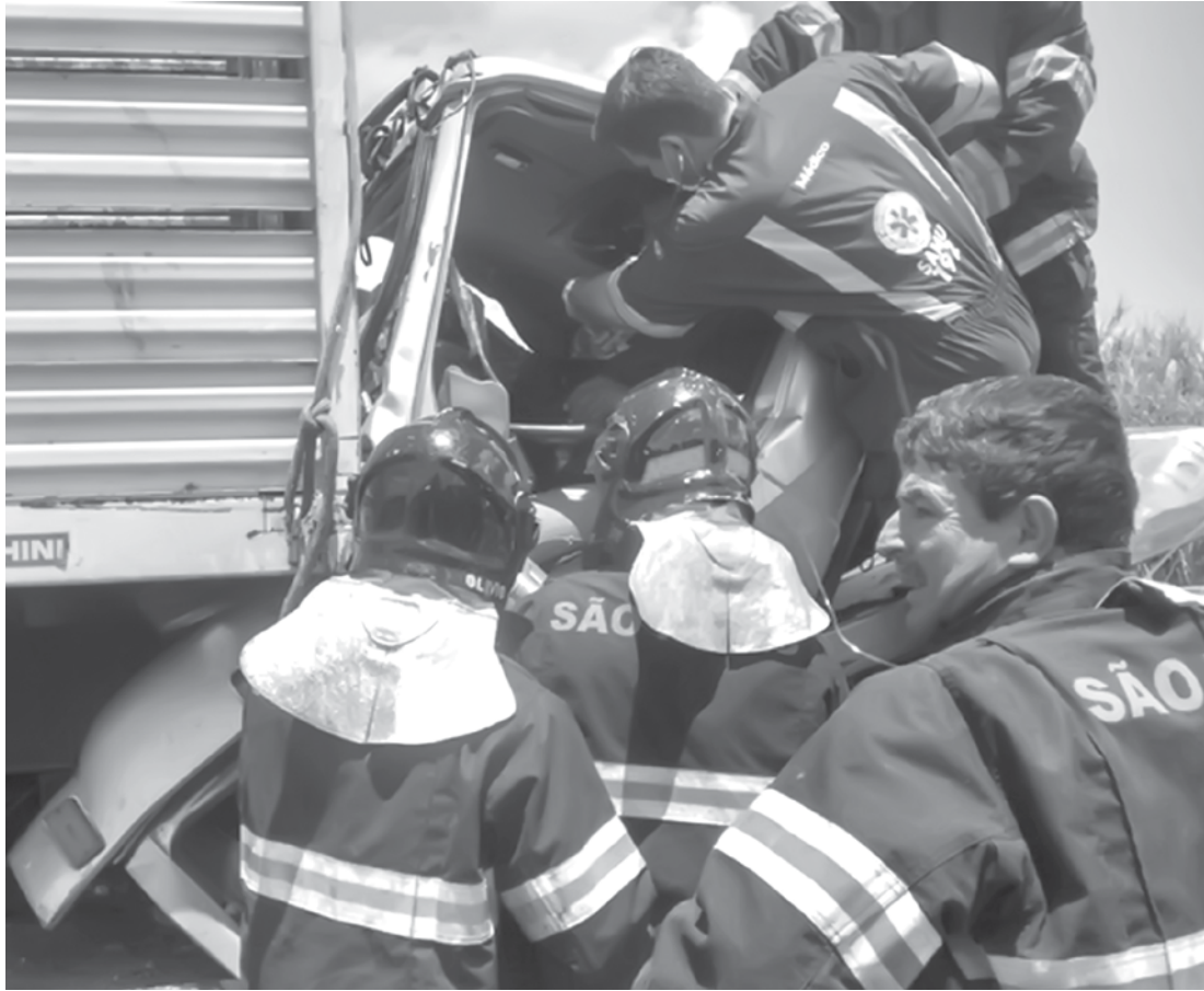
Acidente deixou um ferido na rodovia de Turmalina

→ Da REDAÇÃO contato@oextra.net Um engavetamento na segunda-feira (30) na rodovia Eliezer Montenegro Magalhães (SP-463), em Turmalina, município localizado a 56 quilômetros de Fernandópolis, deixou uma pessoa ferida. O acidente envolveu dois caminhões, um carro e uma caminhonete. Segundo a Polícia Rodoviária Estadual, a pista está em obras e o trânsito estava parado no momento do acidente. O motorista de um caminhão que transportava uma piscina bateu na traseira de um caminhão boiadeiro, que acabou atingindo um carro e uma caminhonete que estavam parados na fila. De acordo com a Polícia, um dos caminhoneiros se feriu, foi socorrido e está na Santa Casa de Jales, onde deverá passar por cirurgias. Segundo a assessoria de imprensa do hospital, o estado de saúde dele é grave.