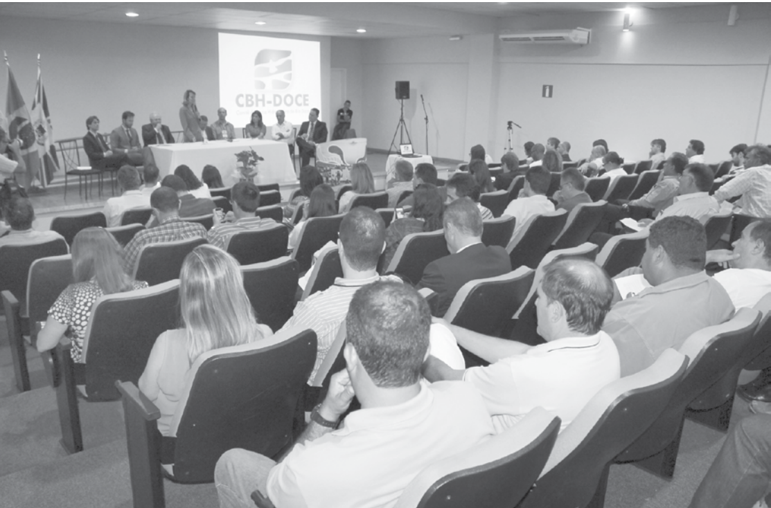
Colegiado se reuniu em Governador Valadares, região do Vale do Rio Doce em Minas Gerais, com a presença de autoridades e especialistas para discutir os reflexos do rompimento da barragem de Fundão

→ Da REDAÇÃO contato@oextra.net Por se tratar de uma instância democrática e participativa e por garantir a presença de segmentos interessados na gestão eficiente dos recursos hídricos, os Comitês que compõem a Bacia Hidrográfica do Rio Doce reuniram-se nesta terça-feira (1º), em Governador Valadares/MG, para colocar em pauta a necessidade de inclusão do colegia-