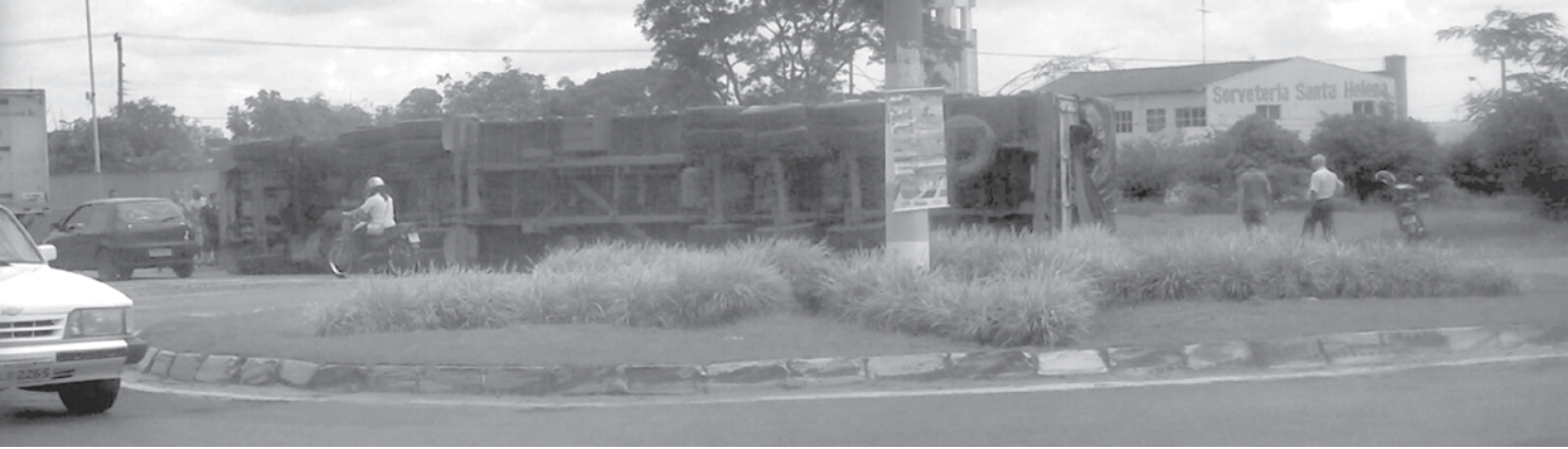
Condutor trafegava pela Marginal e, ao tentar fazer o contorno, acabou tombando a carreta