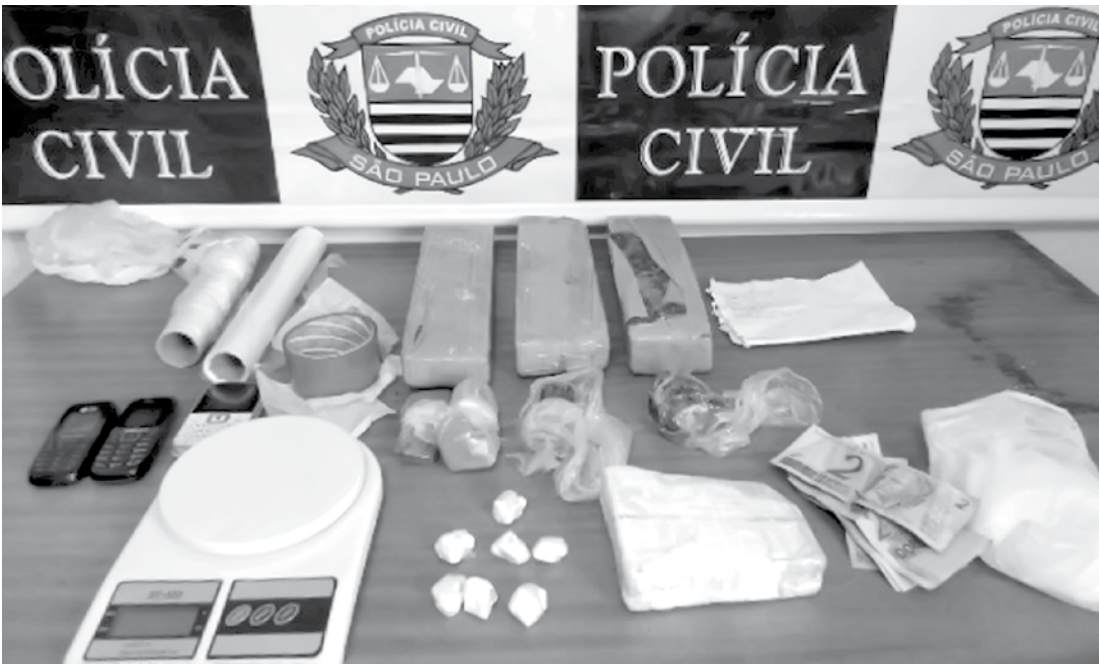
Entorpecentes e material utilizado no tráfico apreendidos pela DISE

ensão”, expedido pela Justiça após investigações realizadas pela Polícia Civil. Após o flagrante, D.H. foi conduzido à cadeia de Guarani d’Oeste, onde, até o fechamento desta edição, permanecia à disposição da Justiça. Segundo informações obtidas junto à DISE, não está descartada a prisão de mais pessoas por envolvimento no caso.