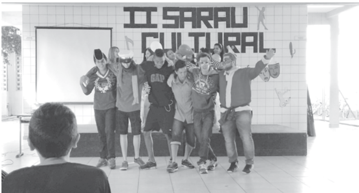
Encenação da música 'Pelados em Santos' feita pelos alunos do Ensino Médio