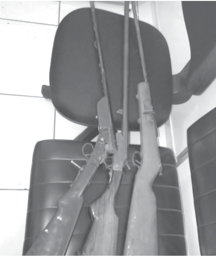
Espingardas foram encontradas em um sítio na região de Nhandeara