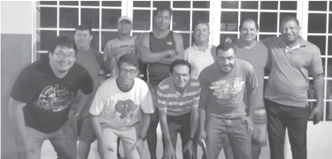
Organizadores e colaboradores da Copa “Dezembrão” de Futebol Amador

A Prefeitura de Fernandópolis, através da Secretaria Municipal de Esporte e Lazer, realizará neste mês a 3ª edição da Copa “Dezembrão” de Futebol Amador. Um congresso realizado na última segunda-feira (30), definiu os confrontos e as datas. As equipes participantes são: Paraíso Futebol Clube; Expressinho Paulistano Futebol Clube; Planalto Futebol Clube/Engerb; Paulistano Futebol Clube/Serv-Bem; Uirapuru Futebol Clube; Brasilândia Esporte Clube; Juventus Futebol Clube e Corinto Futebol Clube. A primeira rodada acontece hoje, dia 04, e o primeiro confronto será às 19h, entre as equipes do Paraíso F.C. e Expressinho F.C.. O segundo confronto da noite, às 20h30, é entre a equipe do Planalto F.C. e a do Paulistano F.C./Serv-Bem. Os jogos das semifinais estão defini-