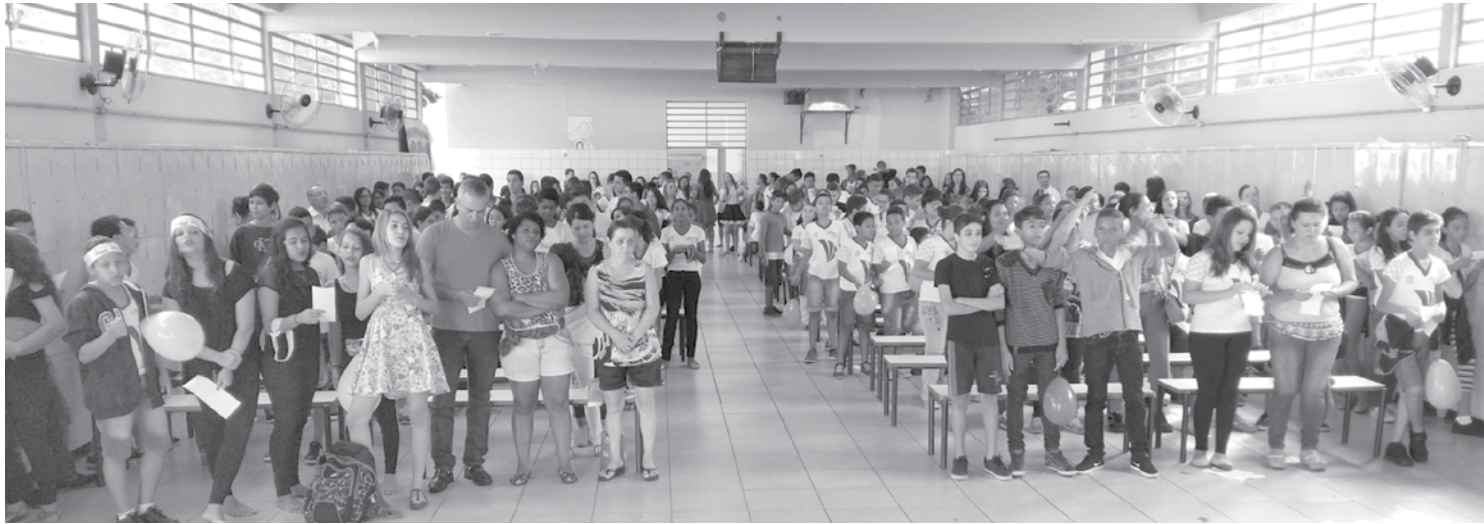
Participação da comunidade e equipe escolar

Estudantes de todas as séries se apresentaram através de músicas, dramatizações, leituras, danças, intervenção poética, conto, causo, encena-