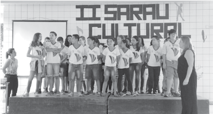
Apresentação musical do 6º ano A: Alfabeth Song