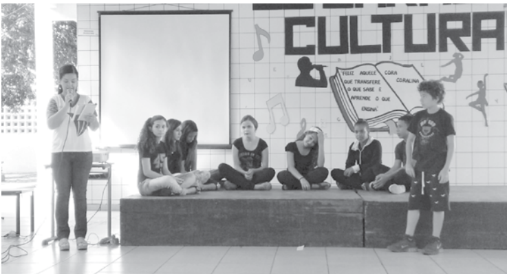
Encenação do conto "As mãos dos pretos" (Alunos dos 7ºs e 8º ano)