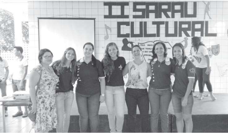
Equipe do subprojeto de Letras