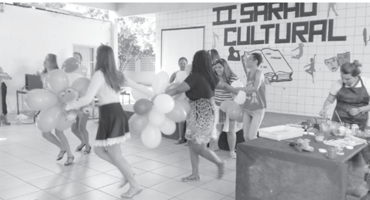
Brincadeira de criança com os alunos do Ensino Médio