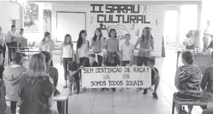
Coreografia da música "A cor do Brasil" com os alunos do 8º ano A