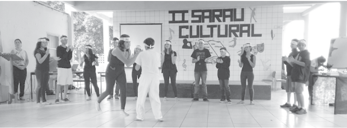
Improviso na dança com os alunos do 7º ano B