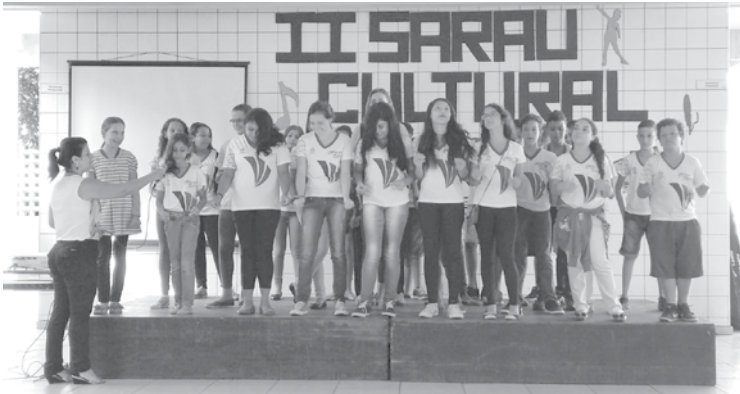
Apresentação Musical 6º ano B: Happy Day