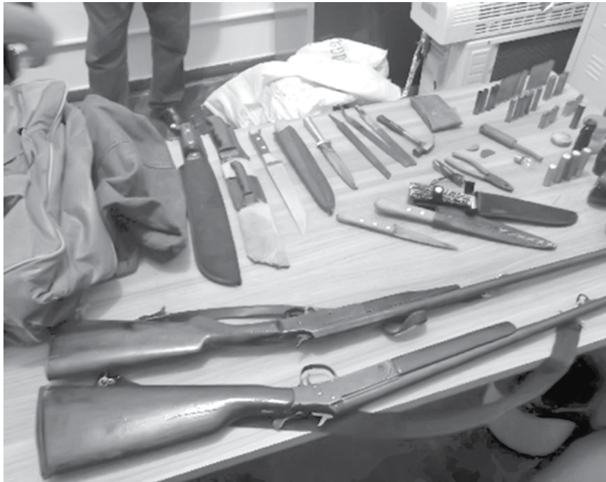
Armas apreendidas pela Polícia Ambiental com os dois homens

munição e sete facas. Diante do fato, os dois foram presos e encaminhados à cadeia de Guarani D'Oeste, na qual, até o fechamento desta edição, permaneciam à disposição da Justiça. Eles responderão por crime ambiental de caça, além de porte ilegal de arma de fogo de uso restrito. A pena, segundo a Polícia, varia de dois a seis anos.