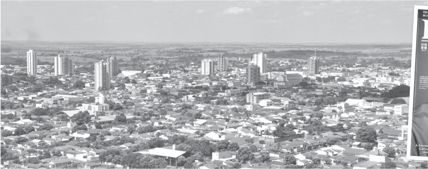
Fernandópolis: um bom lugar para investir. Esta é uma constatação do levantamento exclusivo feito pela consultoria paulista Urban Systems, a pedido da Revista EXAME

→ BRENO GUARNIERI contato@oextra.net Em 50º lugar, Fernandópolis integra o ranking das 100 melhores cidades para negócios do Brasil com população entre 50 mil e 100 mil habitantes. Os dados fazem parte do estudo “Melhores Cidades para Negócios”, realizado, a pedido da Revista Exame, pela Urban Systems, empresa de inteligência de mercado e soluções estratégicas especializada em desenvolvimento de planos de desenvolvimento de cidades e negócios imobiliários. Para a formação do ranking, a Urban Systems analisa 28 indicadores econômicos e sociais divididos em quatro áreas: desenvolvimento econômico, desenvolvimento social, capital humano e infraestrutura. Um ponto relevante da pesquisa é o fato de que a maioria das cidades de destaque no ranking, caso de Fernandópolis, ou estão localizadas próximas a grandes municípios ou estão em regiões metropolitanas, o que confirma a tendência de descen-