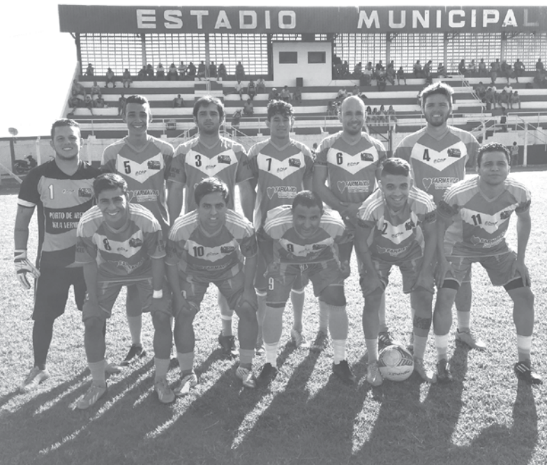
Jogadores da equipe de Arabá que também estão na semifinal do campeonato