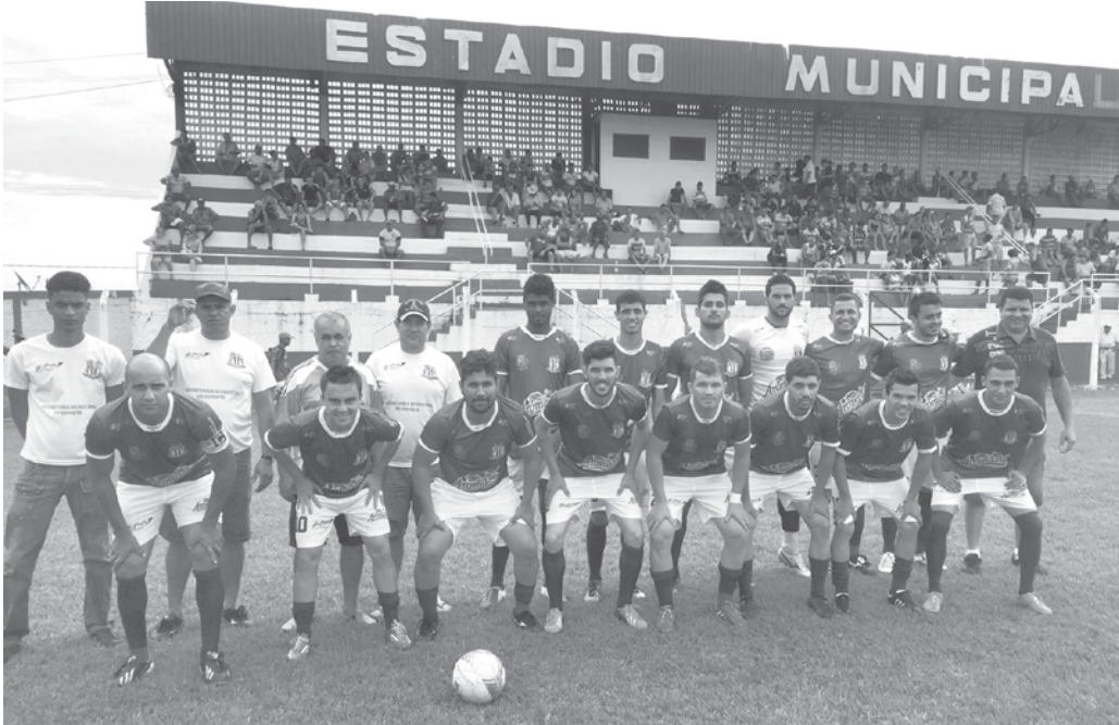
Jogadores e comissão técnica do Clube Esportivo de Ouroeste, que venceu nos pênaltis e se classificaram para a semifinal

Vale lembrar que amanhã, dia 06, não haverá rodada, por isso as equipes se enfrentam no próximo dia 13.