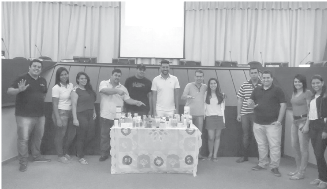
Consultores de Ouroeste, da região e convidados que participaram do treinamento da franquia de cosméticos Hinode