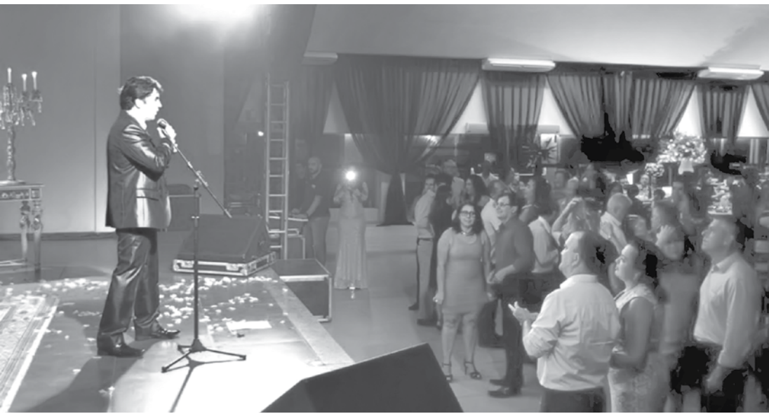
Solidariedade e uma noite muito agradável marcaram o Jantar

A partir daí, as voluntárias e a equipe da Santa Casa foram em busca de apoio para a realização do evento, que acabou envolvendo diversos parceiros e voluntários.