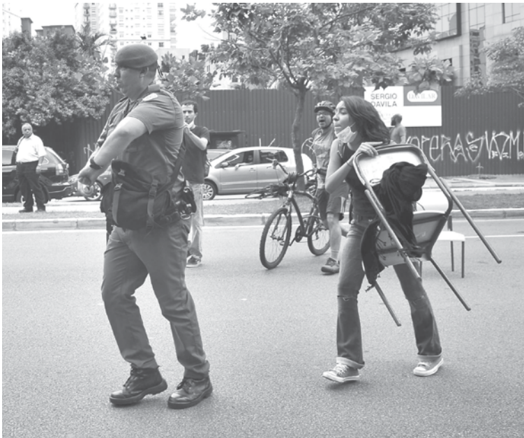
Após protestos, Governo do Estado de São Paulo cedeu à pressão dos estudantes e dos profissionais da Educação, e suspendeu o projeto de reorganização escolar

organizava as restantes por ciclo único. Desse modo, estudantes do ensino fundamental ficam em unidades diferentes do ensino médio. Na última terça, o governo do Estado de São Paulo publicou um decreto que permitia a transferência de servidores entre as unidades da reorganização -- esse foi o primeiro passo legal para a implantação do programa.