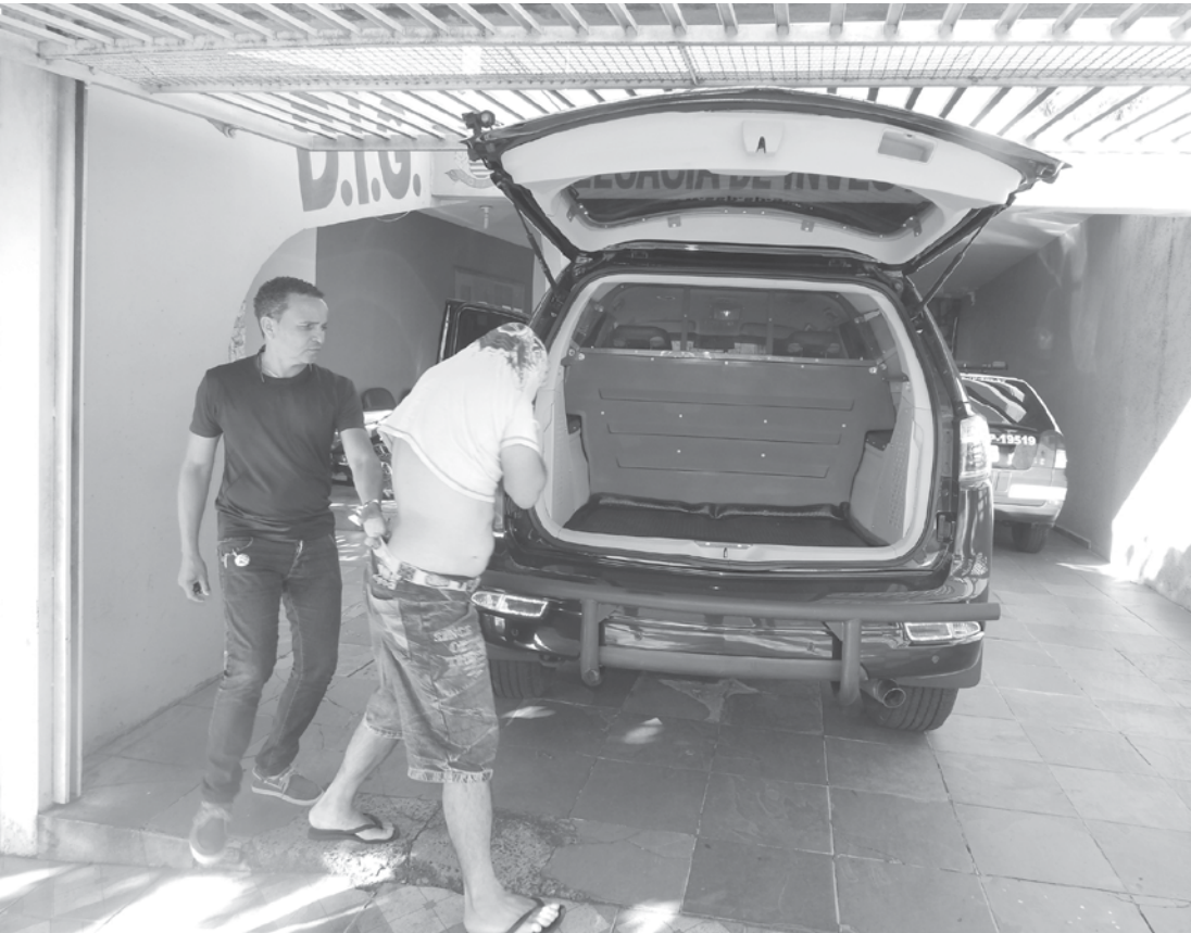
Indiciado pelo crime de pedofilia no momento que foi conduzido pela DIG à Cadeia de Guarani d'Oeste

Agentes da Delegacia de Investigações Gerais, DIG