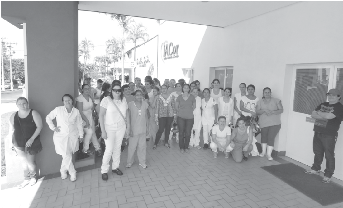
Em julho, também por atraso no pagamento, funcionários se reuniram com o Sindicato

o fechamento desta edição, os trabalhos transcorriam normalmente no hospital. Segundo a Assessoria de Imprensa da instituição, por causa do atraso no repasse dos recursos federais, os compromissos financeiros da entidade foram afetados. CRISE Atualmente, a Santa Casa de Fernandópolis enfrenta momentos de dificuldades para manter seu atendimento, em razão da situação da saúde pública. Com as finanças fragilizadas, diversas medidas de reestruturação estão sendo tomadas pela direção do hospi-