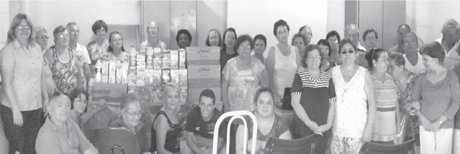
A coleta do leite foi realizada nos bairros próximos ao CRAS “Vida Nova”

frequentam os grupos realizados pelo CRAS. Os participantes dos grupos fizeram a coleta de leite nos bairros próximos ao CRAS. O endereço do Vida Nova é Rua Maragó, nº45 - São Cristóvão, e o telefone é o (17) 3462 3578.