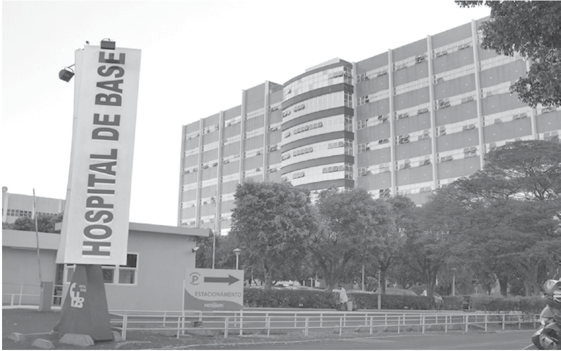
Jovem não resistiu aos ferimentos e morreu na madrugada de terça no Hospital de Base

xeira Neto trafegava pela referida rodovia quando, por motivos a serem apurados, bateu violentamente contra uma pilastra da ponte que passa sobre o rio Tomaizão. A vítima foi socorrida pelo Serviço de Atendimento Móvel de Urgência (Samu) até a