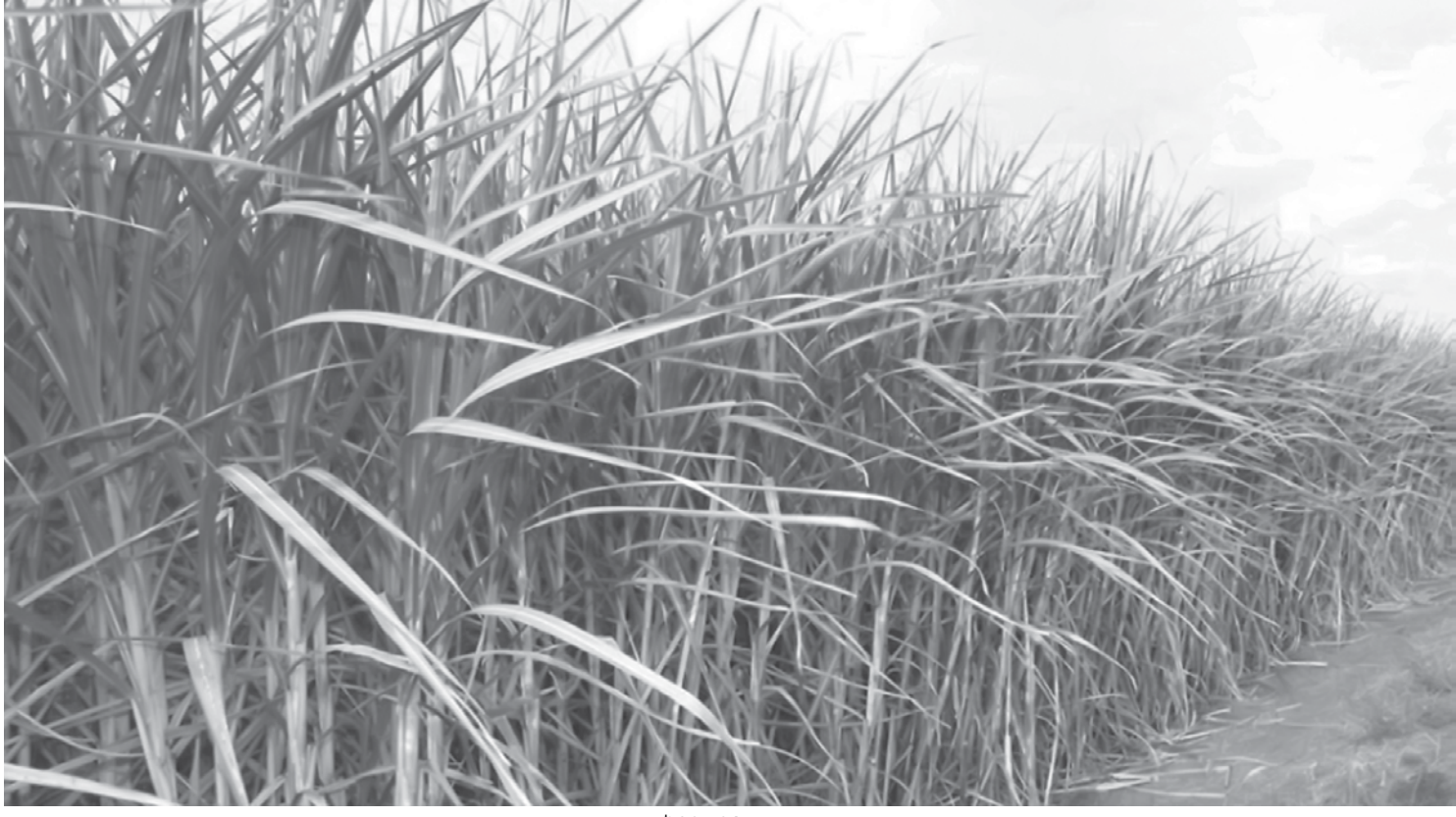
Renda do segmento de cana deve atingir R$ 967,64 milhões neste ano, o mais alto entre as culturas

mais do que dá, pois terá recompensas benéficas na sua própria vida, na saúde, felicidade e até no humor. Solidariedade é um valor importante e deve ser prática habitual. Ser solidário enriquece os seres humanos justamente porque reforça o que tem de mais bonito na relação entre as pessoas, que são os laços de companheirismo, amizade e afetividade. Faça da prática das boas obras uma ação cotidiana, de modo a beneficiar os que te rodeiam e a você mesmo. Farei a minha parte. “A solidariedade é o sentimento que melhor expressa o respeito pela dignidade humana”. (Franz Kafka)