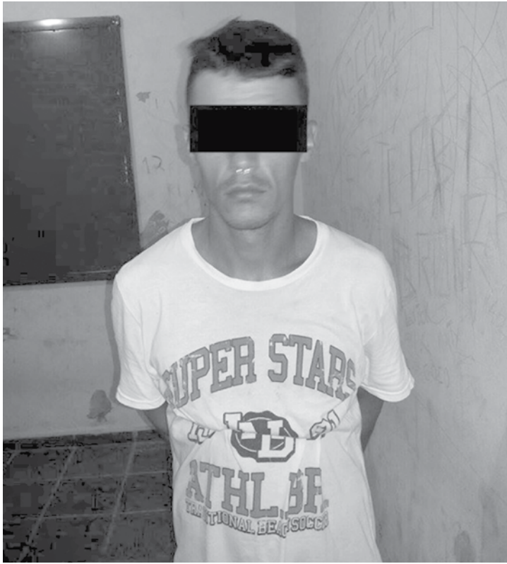
Português está preso na cadeia de Guarani d'Oeste à disposição da Justiça