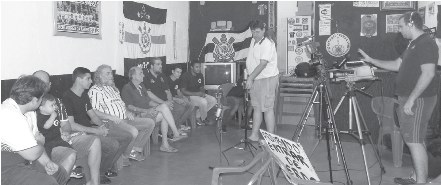
Bastidores da gravação inédita do programa Mesa Redonda, na sede da torcida organizada do Corinthians, a “Fiel Fernandópolis”