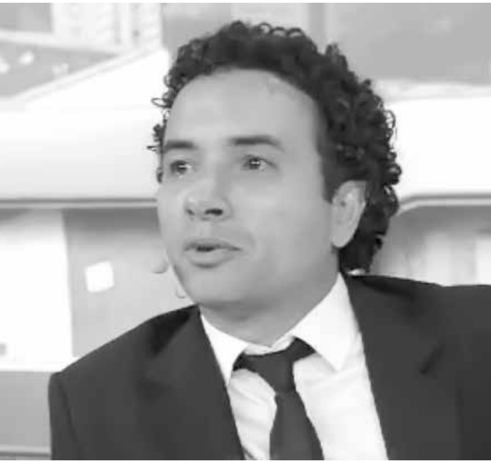
Apresentador não conteve as lágrimas ao comentar fim do programa e causa comoção

Após oito anos na grade da Band, um dos programas mais irreverentes da TV brasileira, o “CQC” sai do ar em 2016 para um ano sabático. Segundo a assessoria do canal, a emissora decidiu dar “um descanso aos homens de preto” e o semanal ganhará um “ano sabático” para “voltar com mais força” em 2017.