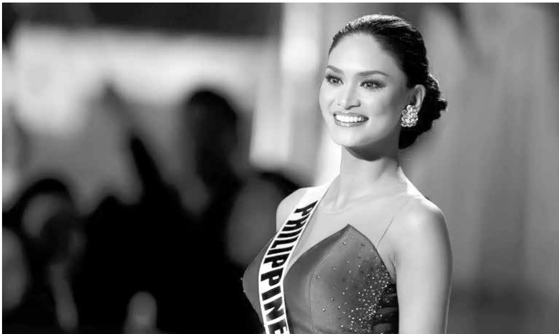
Pia Wurtzbach, das Filipinas, a Miss Universo 2015

Steve Harvey anunciou a Miss Colômbia Ariadna Gutiérrez como a grande vencedora. Ela chegou a receber a coroa e a desfilar com a faixa de Miss Universo. Entretanto, o apresentador se corrigiu e disse que, na verdade, a Miss Universo era Pia Alonzo Wurtzbach, representante das Filipinas. Ariadna Gutiérrez teve que devolver a faixa e a coroa para a verdadeira campeã. Paulina Vega, a Miss Universo 2014 e prima de Ariadna, foi quem teve essa difícil missão.