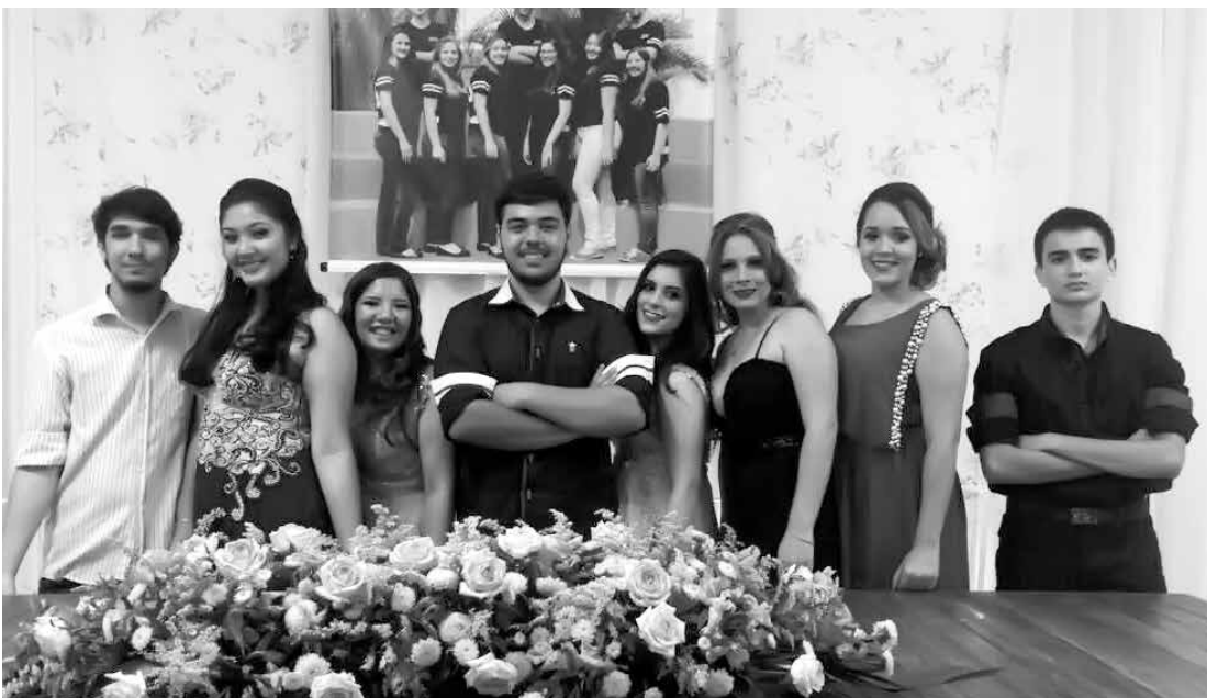
Destaque para os alunos formandos da escola COC , que estiveram em festa no último final de semana.