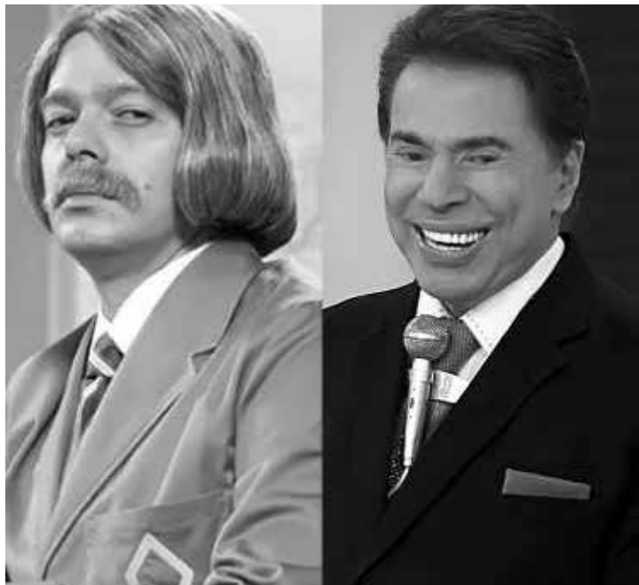
Caso nova temporada seja aprovada, humorístico iria ao ar na faixa das 11 da noite e apostaria em piadas de teor sexual

Se a audiência corresponder, a “Escolinha” - elogiada após sua estreia na TV paga - ganhará uma nova temporada. Por ora, o humorístico tem correspondido, deixado a emissora carioca na liderança e barrado o “Domingo Show”, da TV Record. Caso saia do papel, a nova “Escolinha” só irá ao ar em abril, uma vez que no mês que vem estreia o “Big Brother Brasil” - cuja 16ª temporada terá novas regras e poderá contar com dois líderes.