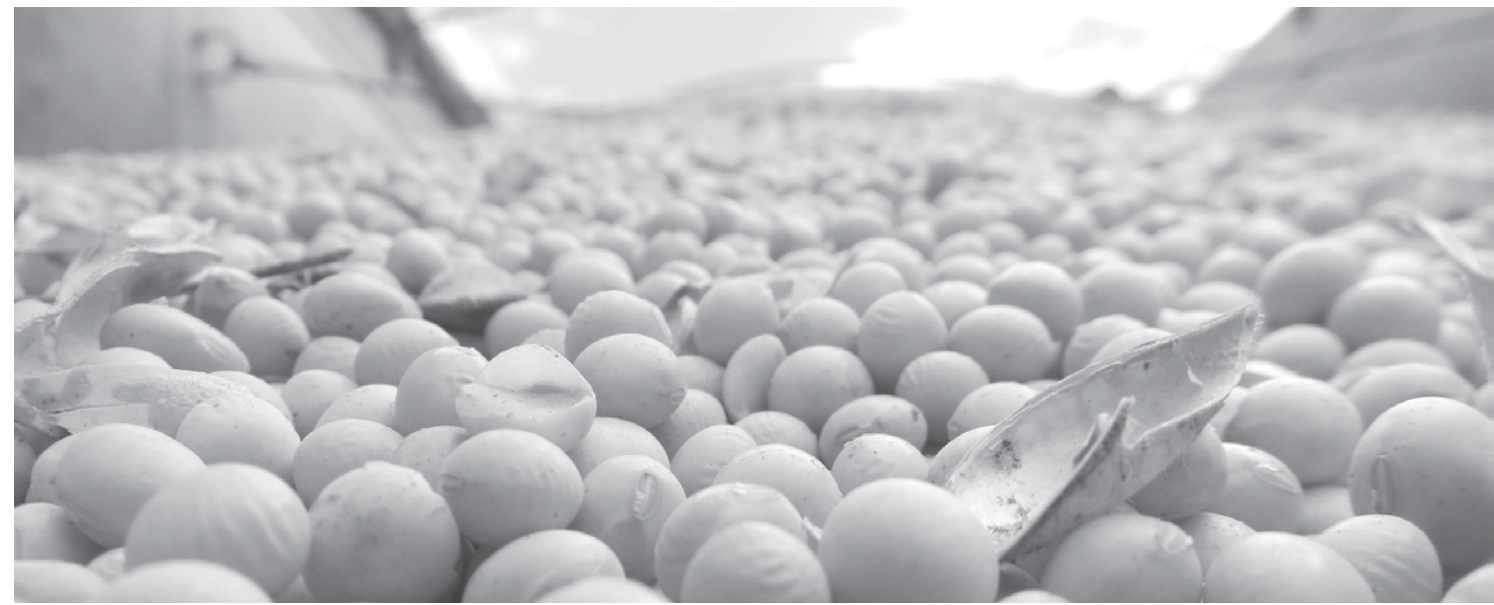
Soja, pelo sexto ano consecutivo, liderou ranking de exportações de Mato Grosso do Sul

→ Da REDAÇÃO contato@oextra.net Mato Grosso do Sul encerrou o ano de 2015 registrando uma queda de 9,73% na receita com as exportações em comparação com 2014. O faturamento, segundo o Ministério do Desenvolvimento, Indústria e Comércio Exterior (Mdic), caiu de US$ 5,245 bilhões para US$ 4,735 bilhões, o que representou uma perda de US$ 510,382 milhões. Convertido para o real - na cotação de abertura do pregão desta quarta-feira (06), de US$ 1 correspondendo a R$ 4,024 - este valor representa nada menos que R$ 2,053 bilhões. O agronegócio reafirmou em