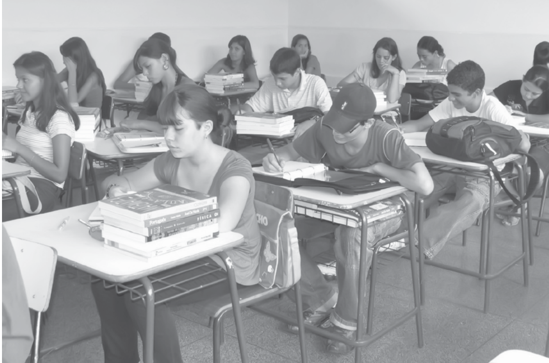
Cerca de 4 milhões de estudantes iniciam ano letivo dia 15 de fevereiro

alunos interessados em ingressar na rede estadual. Para fazer o cadastro basta se dirigir à unidade de ensino mais próxima e preencher o formulário. É indicada a apresentação de documento de identidade (certidão de nascimento e RG) e comprovante de residência. No caso de alunos menores de idade, o cadastro deve ser feito por pais ou responsáveis. Quanto aos alunos que frequentaram a rede em 2015 e, por quaisquer motivos desejam mudar de unidade, a Se-