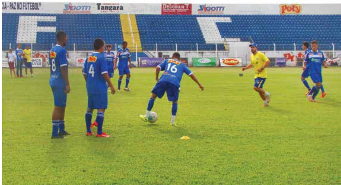
Comissão técnica não perdeu tempo e já mantém treinos puxados