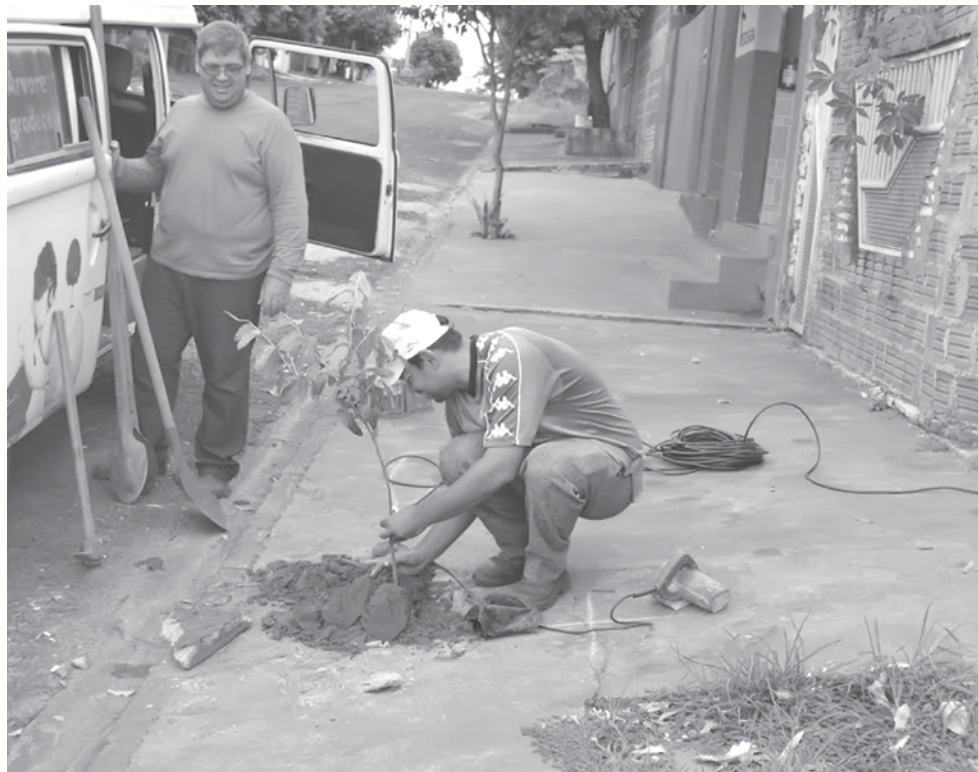
Todas as mudas foram produzidas pelo Viveiro Municipal