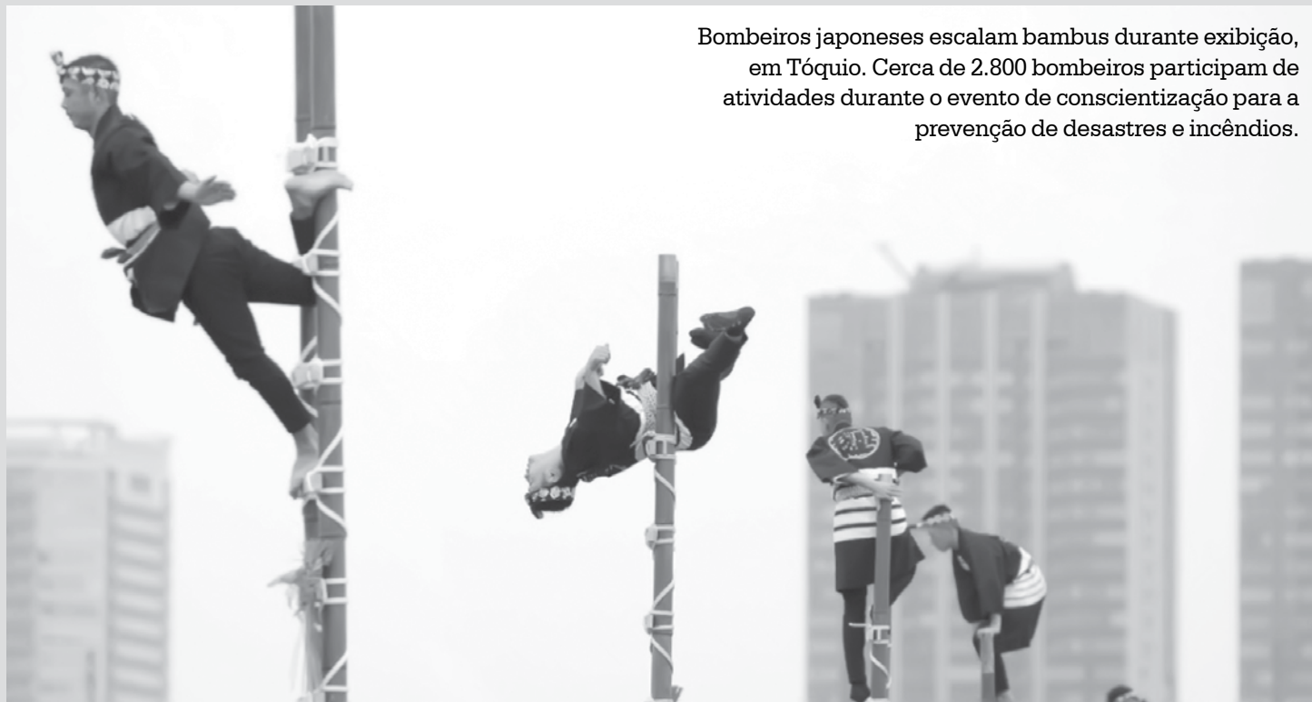
Bombeiros japoneses escalam bambus durante exibição, em Tóquio. Cerca de 2.800 bombeiros participam de atividades durante o evento de conscientização para a prevenção de desastres e incêndios.