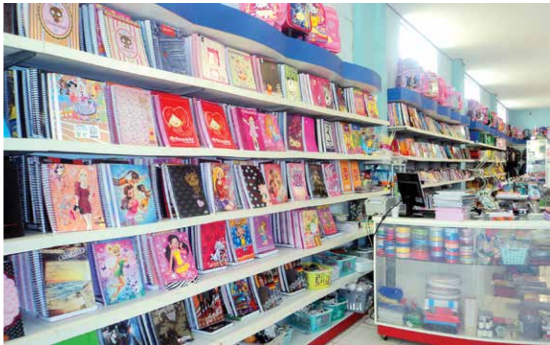
Para atender às solicitações dos filhos, pais precisam pesquisar bastante os preços dos materiais

Em Fernandópolis, a expectativa dos estabelecimentos do setor é de aumento nas vendas em comparação com o ano passado.