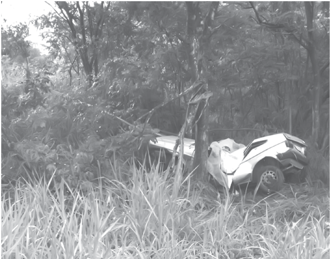
Motorista perdeu controle e veículo só parou ao bater em árvore

Resgate do Corpo de Bombeiros foi acionado, mas homem morreu no local