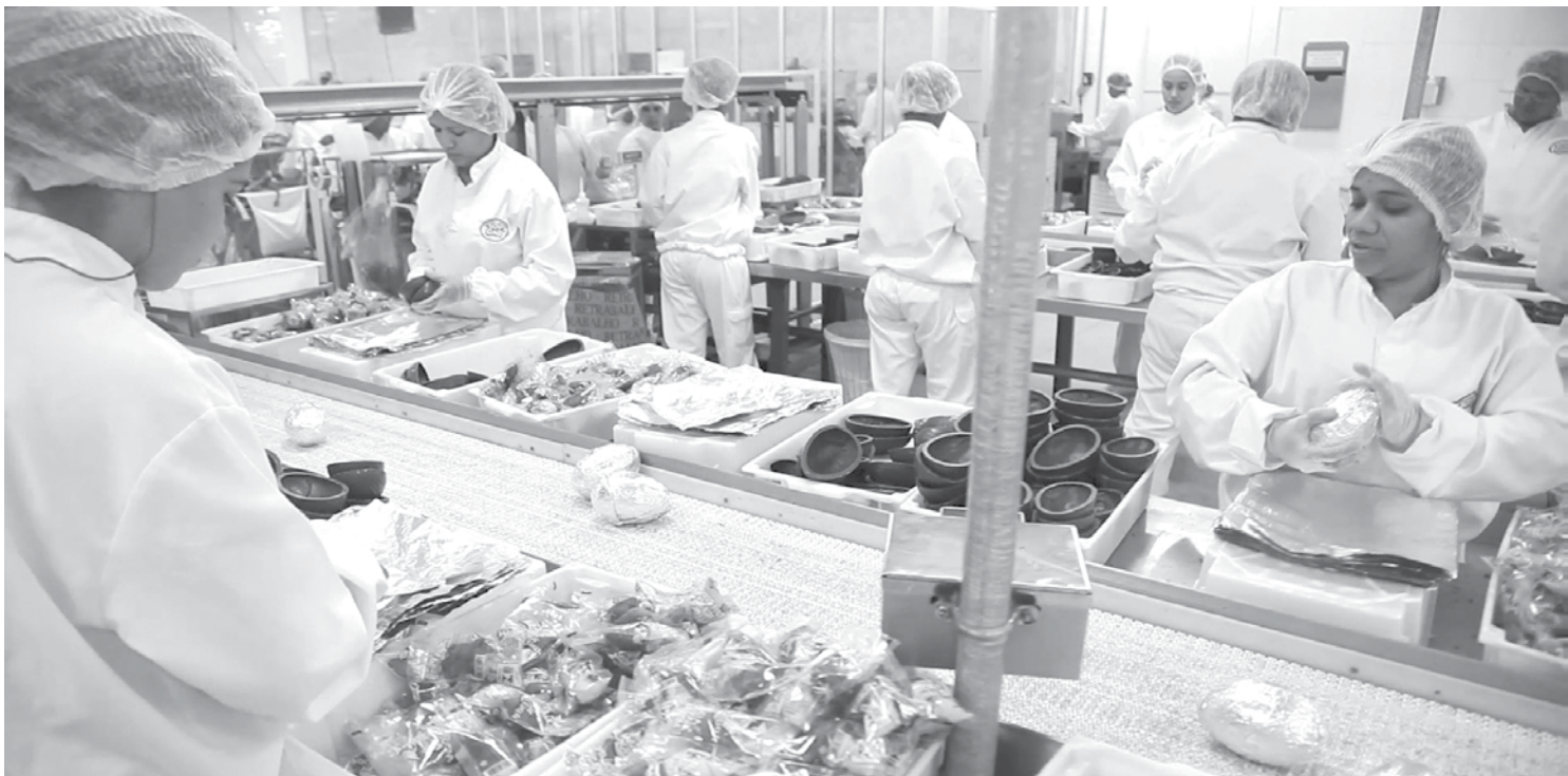
Número de vagas é o maior quando comparado com 2015 e com os anos anteriores

Com paciência e formação, com carinho e atenção, os jovens em 2016 serão capazes de surpreender uma vez mais os adultos, assumindo alternativas, soluções e propostas criativas, inovadoras e transformadoras. Os jovens fernandopolenses merecem oportunidades. É o desafio do ano novo.