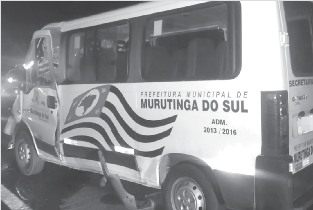
Animal invadiu a rodovia e atingiu a lateral do veículo

Segundo a Polícia, os pacientes iam passar por tratamento no Hospital do Câncer de Jales. O motorista e seis passageiros tiveram ferimentos leves. Eles foram levados para