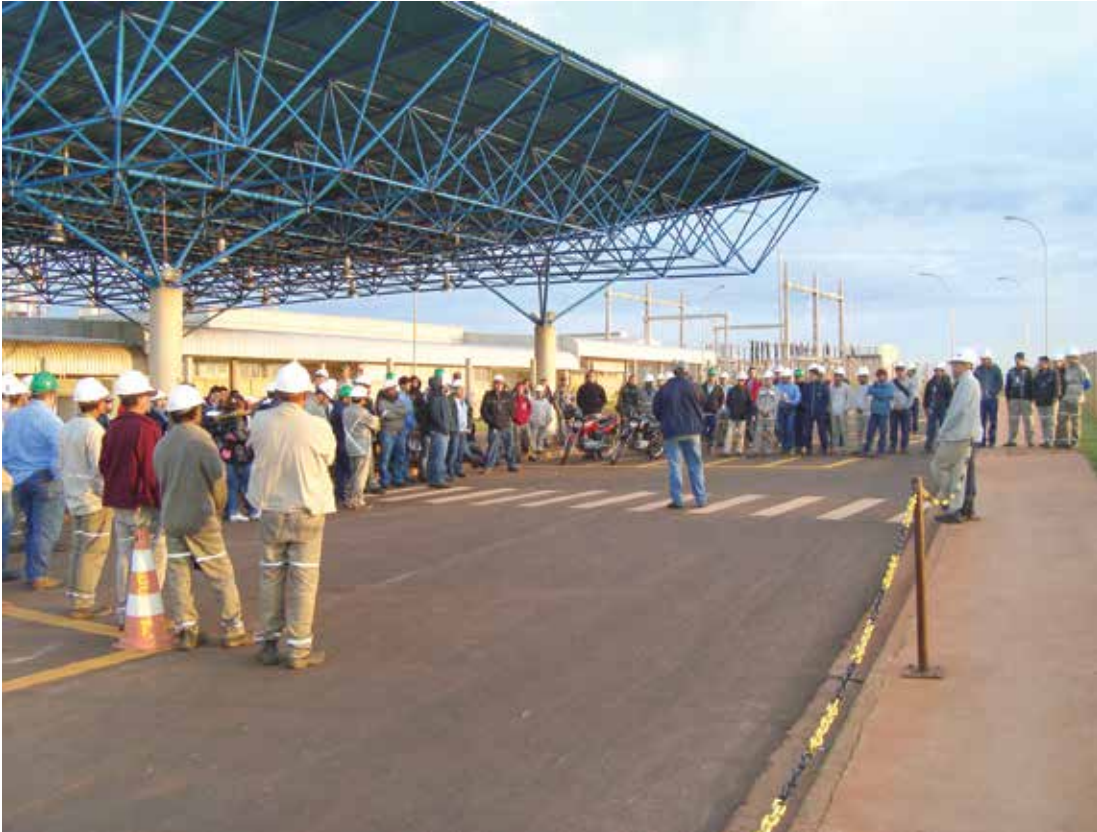
Registro de uma das assembleias realizadas pelos funcionários da Usina Noble Agri, em Meridiano

A Noble Agri, uma “joint venture” - consórcio de empresas já existentes no mercado e criado para realizar uma atividade econômica em comum -, é composta por investidores financeiros internacionais, entre eles empresários que detêm o Noble Group, proprietário de diversas usinas de açúcar, etanol e co-geração de energia a partir de biomassa no Noroeste do Estado de São Paulo, com unidades em Meridiano, Sebastiãoópolis do Sul, Catanduva e Potirendaba, e que opera um terminal de transbordo na cidade de Votuporanga.