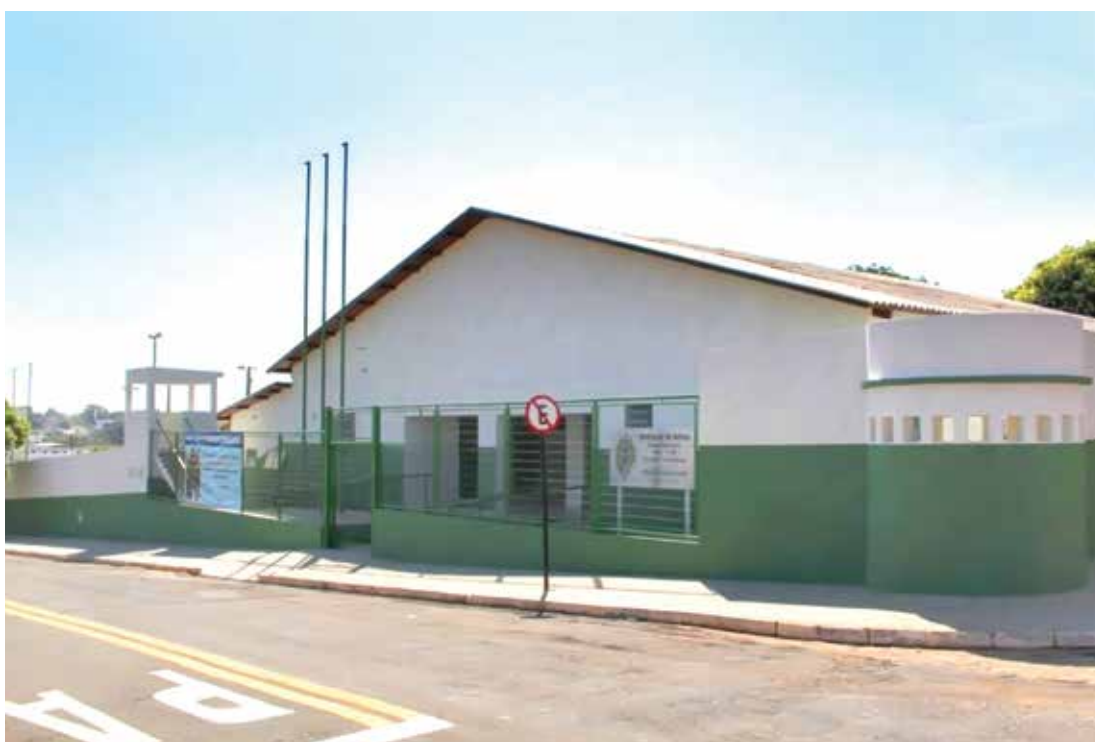
Em caso de dúvidas, os jovens devem comparecer à Junta de Serviço Militar, ao lado do Tiro de Guerra, ou entrar em contato pelo telefone (17) 3442-2317, no período da manhã, pois os trabalhos serão iniciados às 08h