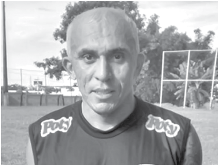
Jogador estava no XV de Piracicaba, mas não entrou em acordo financeiro para permanecer

Ferroviário/CE e Cratêus/CE, além de São Caetano, Guaratinguetá e Chapecoense. PREPARAÇÃO O Votuporanguense fará dois jogos-treino, contra Olímpia, no estádio Tereza Breda, em Olímpia, hoje (13), e três dias depois enfrenta o Catanduvense, no Silvío Salles. Já no dia 23, o clube tem