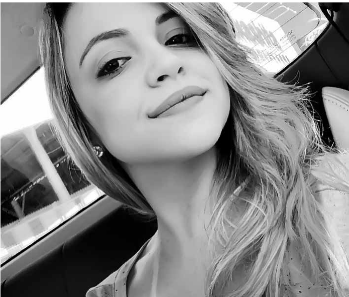
A bela Ná Saves assopra as velinhas hoje em clima de muita festa, homenagens e recebendo o carinho da família.