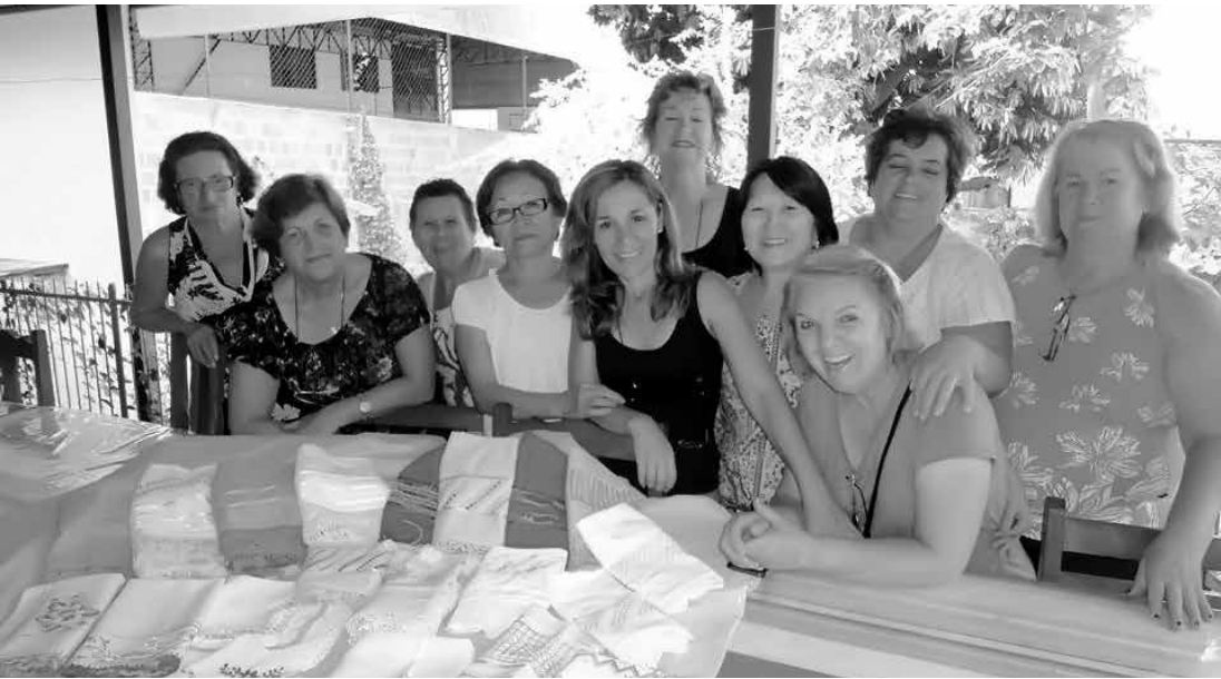
Destaque para a Turma de Pintura em Tecido da Unati , já retornando às atividades na instituição.