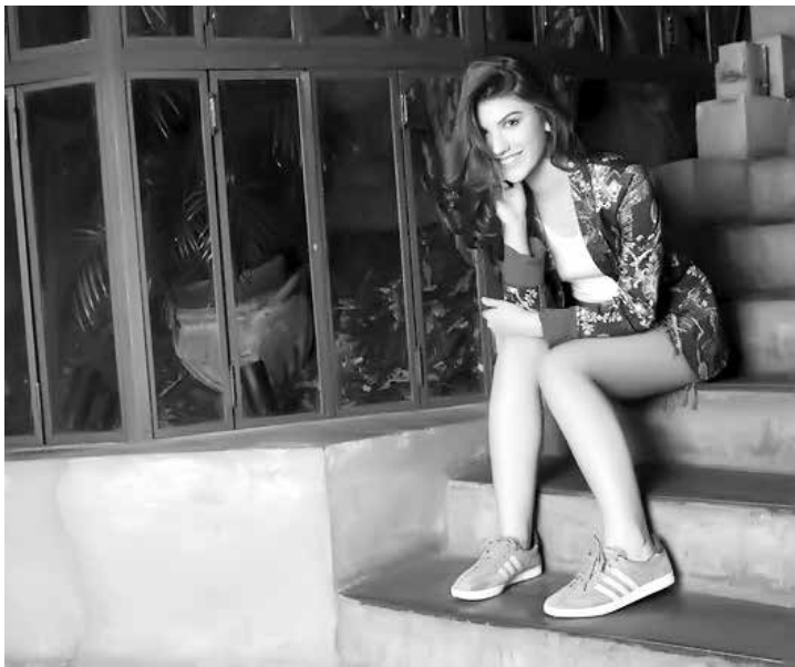
Sucesso nas redes sociais por seus modelitos, atriz será Gersa na próxima novela das seis