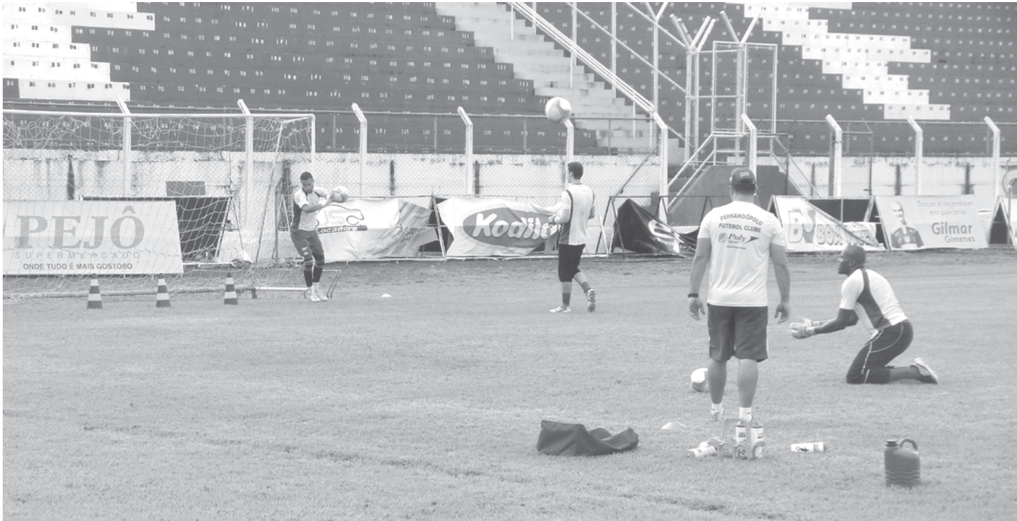
Goleiros da Águia em dia de treinamento no municipal Cláudio Rodante

“Nosso trabalho está sendo bastante intenso, deslocamento, chute, salto, são atividades no limite. Estamos realizando um misto de todos os exercícios e isso nos fortalece para fazer bons jogos ao longo da temporada”, frisou.