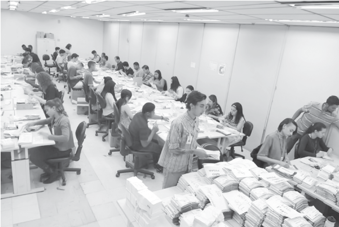
Detran.SP e Prodesp montam força-tarefa que trabalha em três turnos para garantir o envio dos documentos pelos Correios

últimos anos. Já no segundo dia, 5 de janeiro, o licenciamento antecipado registrava 161,4 mil serviços realizados. No dia 6 foram 121 mil e, no dia 7, 119,8 mil. No ano passado, o volume de documentos remetidos chegou a 296 mil em um único dia, o que pode ser repetir neste início de 2016. O CRLV é um documento de porte obrigatório. O motorista flagrado sem o documento ou com ele desatualizado pode ser multado, além de ter o carro apreendido. No Estado de São Paulo, o calendário anual obrigatório de licenciamento começa em abril e vai até dezembro, de acordo com o final da placa. Para os veículos de carga (caminhão) vai de setembro a dezembro. A frota total de veículos registrados no Estado é de aproximadamente 27,6 milhões. Quem preferir pagar o licenciamento conforme o calendário, poderá receber lembretes sobre a proximidade do vencimento. Basta baixar o aplicativo Detran.SP, gratuitamente, em seu tablet ou celular. Os alertas ocorrem no início e no meio do mês de vencimento. O licenciamento antecipado só pode ser feito de forma eletrônica via sistema bancário, com entrega do documento pelos Correios no endereço de registro do veículo. As unidades de atendimento do Detran.SP e os postos Poupatempo não emitem o licenciamento antecipado. Em 2016, o valor da taxa de licenciamento é de R$ 80,07