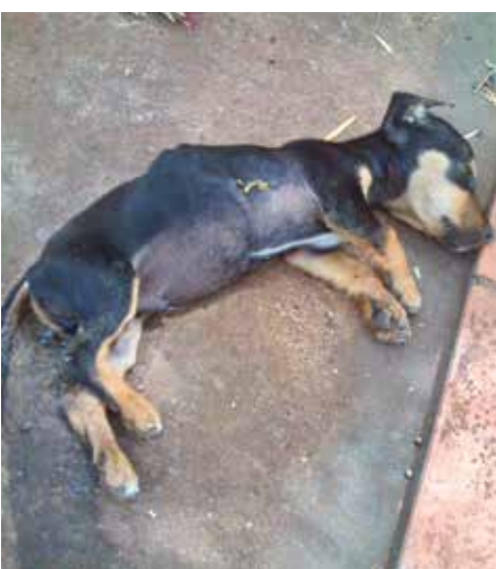
Animais abandonados pelas ruas de Fernandópolis e que estão à procura de um lar

crias, sempre vai ter animal doado para pessoas que não têm responsabilidade nenhuma, somente pega porque o filhote é bonitinho, mais na primeira obrigação que tem, que é vacinar seu animal, já não quer gastar com isso. Meses depois o animal fica doente e ele simplesmente solta na rua. Enquanto não houver punições e multas para quem abandona animal, vamos continuar tendo animais sendo descartados como lixo", desabafou uma das voluntárias da Associação.