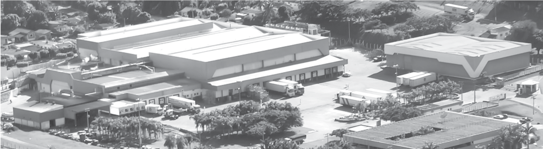
Unidade II da empresa Estrela Alimentos “Industrializados”, também na cidade de Estrela d'Oeste, em atividade desde 1998. Possui um Mix de mais de 30 produtos, dentre eles: salsichas, mortadelas, presuntos, apresetados, bacon, lombo canadense, embutido cozido de carne bovina, linguças calabresa, toscana e de pernil, hambúrguer, carne moída e temperados semi-prontos

ção e sua direção têm com a população e o empresariado regional.