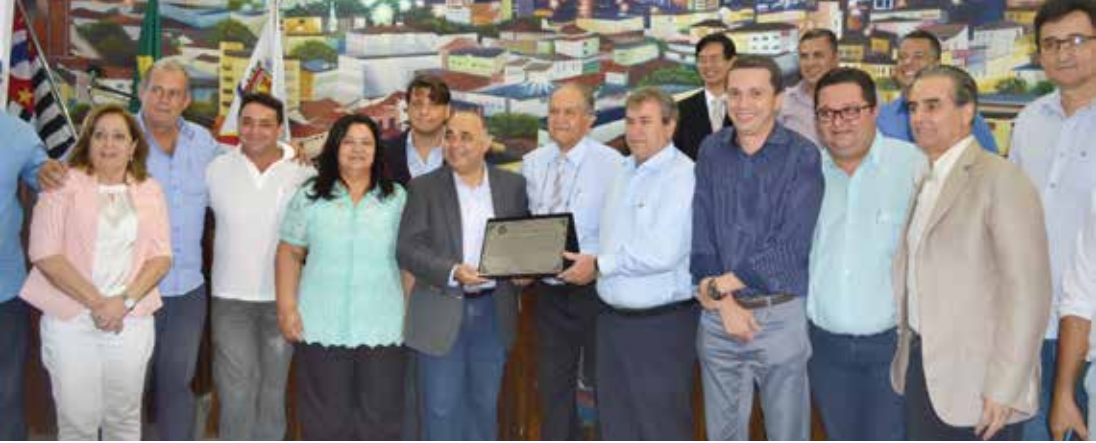
Ministro George Hilton juntamente com lideranças políticas na Câmara Municipal

dades para que eles façam naturalmente o que mais amam na vida, esporte. Que o programa revele talentos para o esporte nacional”, disse. Logo depois de atender a imprensa, Hilton, na sala de presidência da Câmara, despachou diversos pedidos de prefeitos que acompanharam o evento. PERFIL George Hilton é teólogo. Exerceu o cargo de deputado estadual por Minas Gerais por dois mandatos consecutivos, entre 1999 e 2007. No pleito de 2006 elegeu-se deputado federal por Minas Gerais, sendo reeleito sucessivamente em 2010 e 2014. No período militou no Partido Progressista, e desde 2009 é filiado ao PRB.