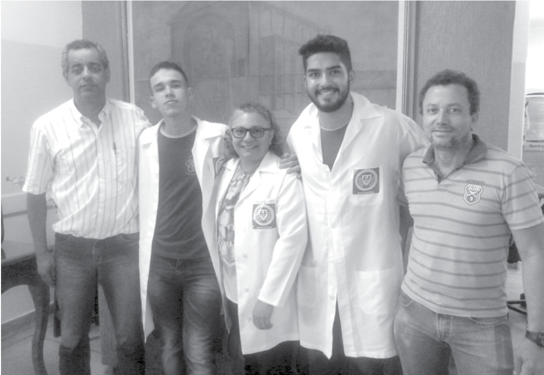
Em destaque, representantes da direção da escola, alunos participantes da Jornada e professores

A participação dos alunos no evento conta com apoio da Fundação Educacional de