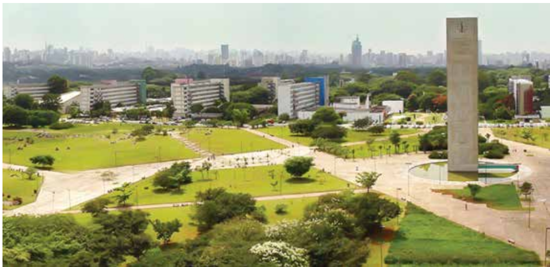
Vista da “Praça do Relógio” da Cidade Universitária, na USP em São Paulo, a universidade mais atingida pela falta de verba

O governo de São Paulo vem utilizando o termo “contingenciamento” em relação ao repasse anual de recursos às universidades estaduais paulistas - USP, Unesp e Unicamp -, e refuta qualquer referência à palavra “corte” nessa verba. Após “O Extra.net” publicar matéria nesta quarta-feira, dia 27, em sua edição de nº 2724, cujo título é “Governo Alckmin corta repasses a universidades estaduais”, a Secretaria de Planejamento e Gestão entrou em contato com o Jornal para reforçar seu posicionamento. “Sobre a reportagem ‘Governo Alckmin corta repasses a universidades estaduais’, a Secretaria de Planejamento e Gestão esclarece que é errado falar em corte, isso porque o recur-