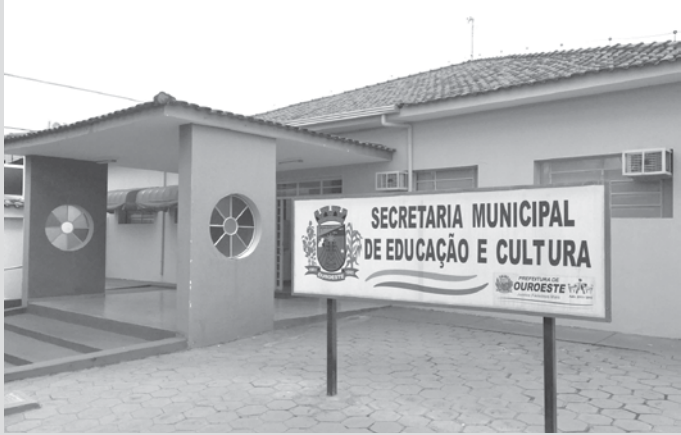
Fachada da Secretaria de Educação e Cultura do município de Ouroeste

tigo 6º: “É dever dos pais ou responsáveis efetuar a matrícula das crianças na educação básica a partir dos 4 (quatro) anos de idade”. Se até então a Educação Infantil era uma opção dos pais, algo mais flexível, sem exigências de frequência, a partir da Lei n.12.796 não mais. Então, atenção pais de crianças de 4 anos ou a completar 4 anos em 2016, caso não façam isso estarão sujeitos a multas segundo o artigo 249 do Estatuto da Criança e do Adolescente (ECA) e à prisão, segundo o artigo 246 do Código Penal.