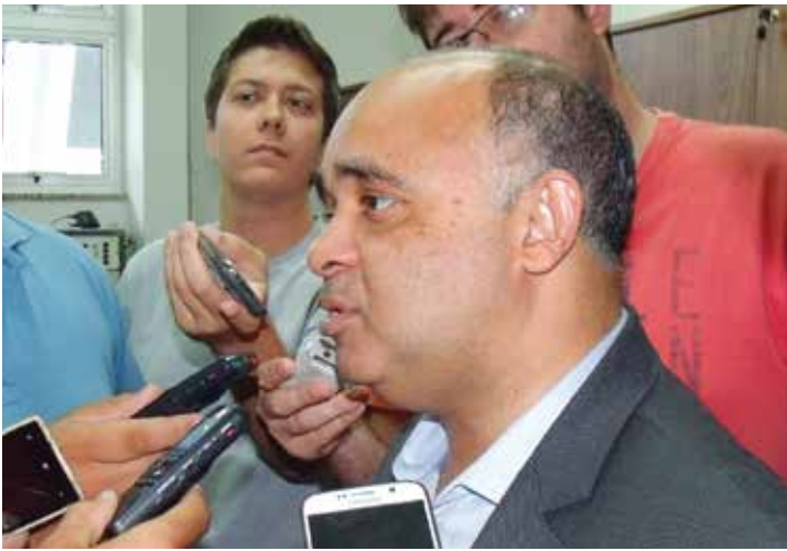
Após o evento, Hilton atendeu a imprensa e mostrou satisfação com os investimentos do Programa Esporte e Lazer da Cidade