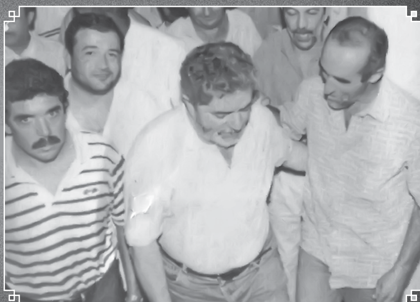
O então pré-candidato petista, junto ao ex-prefeito José Manoel, Noel e de Marco Caboclo (in memorian), que se tornou importante elo entre a região e Brasília

De olho no saldo das eleições municipais de 2000, quando o PT foi o partido que mais cresceu no país, Lula iniciou uma série de visitas Brasil afora e também esteve na região. Naquele ano, aportou em Paranapuã, onde o então desconhecido petista “Cajú” arrebatou a Prefeitura. Cenas de comção, pedidos de autógrafos e idolatria marcaram a passagem de Lula pela região.