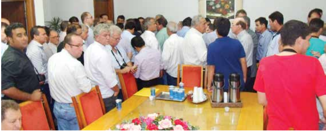
Diversos gestores municipais compareceram à ocasião e pleitearam recursos junto ao Governo Federal